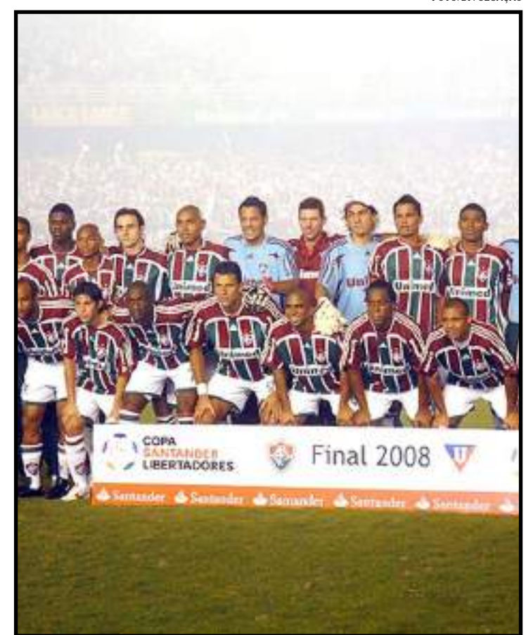
Elenco do Flu vice-campeão da Libertadores em 2008

bém no Couto) e Atlético-GO (dia 25, às 20h30, no Antônio Accioly).