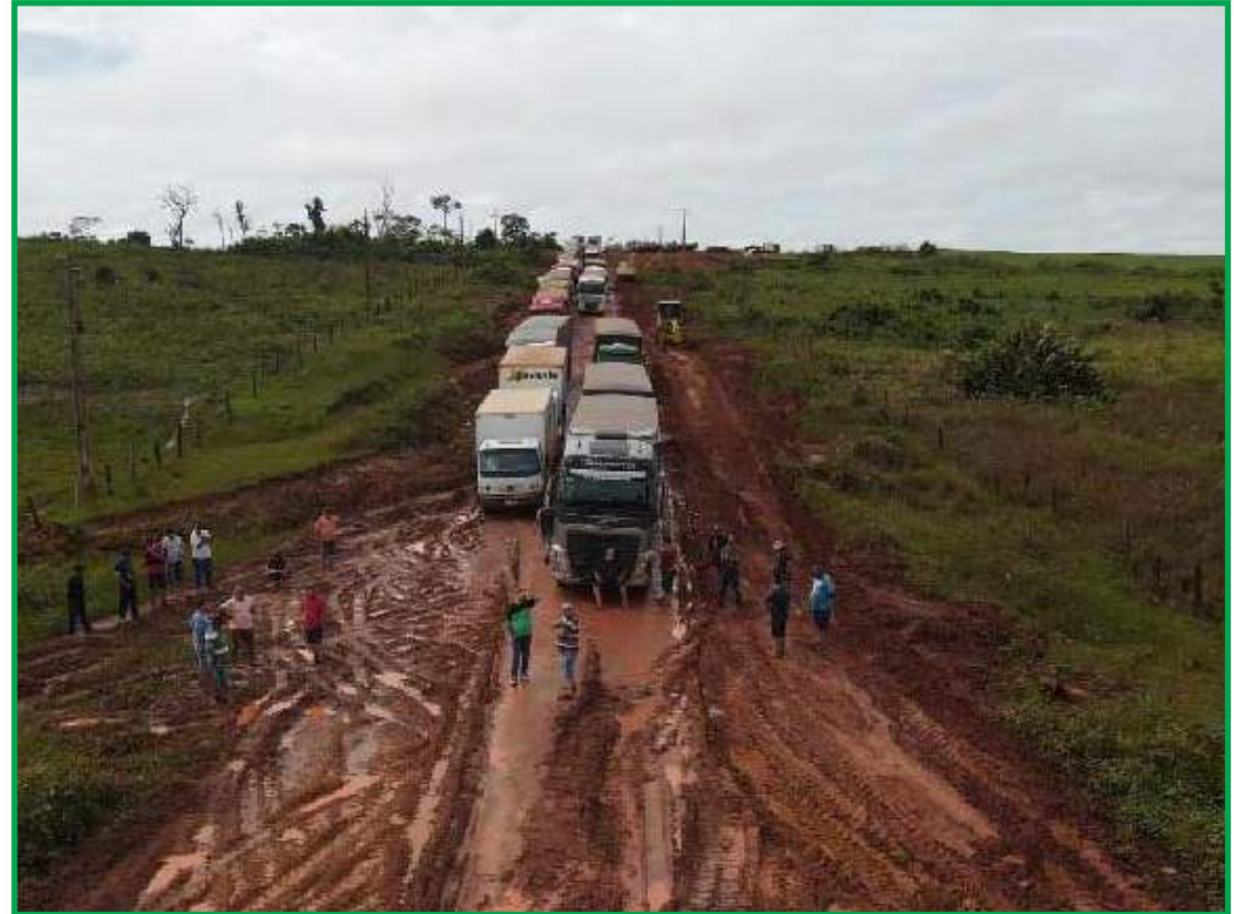
Carretas formam filas paradas por conta das péssimas condições da rodovia

O Governo do Estado pretende, via consórcio de municípios, asfaltar 91 km pela MT-322 até Espigão do