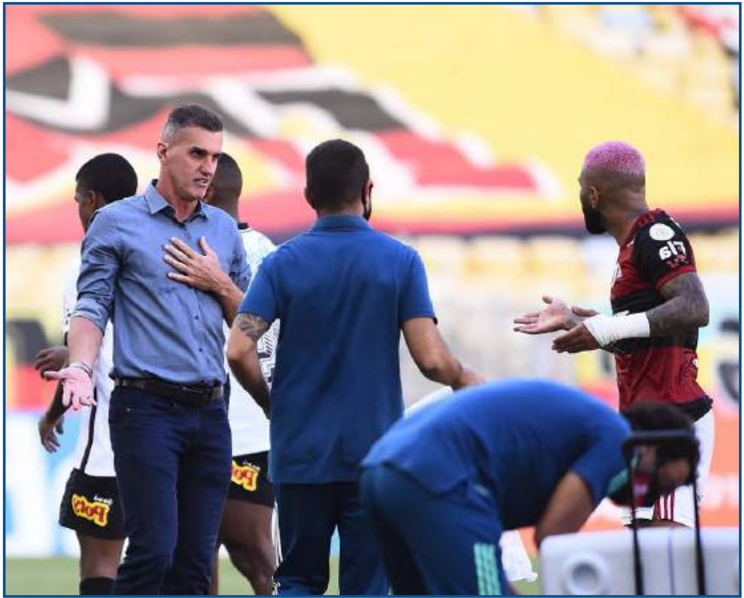
Corinthians perdeu jogo importante, mas ainda está no bolo pela vaga

“Nestes últimos jogos diminuimos a estatura do time e a gente vem sofrendo com isso, seja em escanteios, faltas laterais ou até naqueles lances de segunda bola. A saída do Jô e do Jemerson fez a gente ter uma estatura menor, e a gente tem sofrido com isso, sim. Não justi-