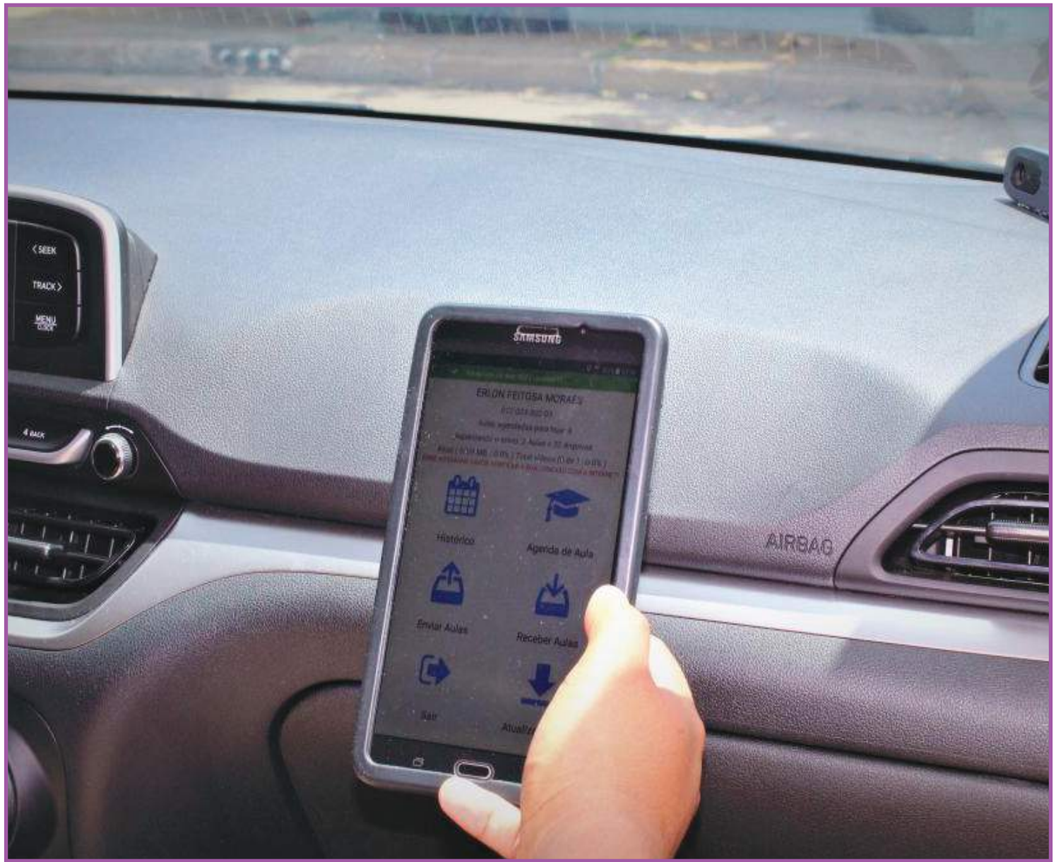
Sistema de telemetria nas aulas práticas de direção

Do dia 15 de outubro de 2020 até a última quarta-feira (11) o Detran-