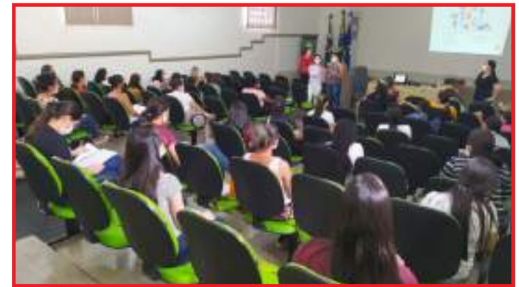
Ação contou com participação de 37 auxiliares