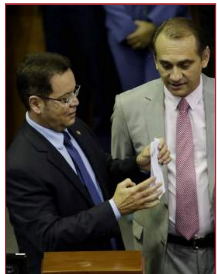
Presidente refuta ideia do colega de proibir voto secreto