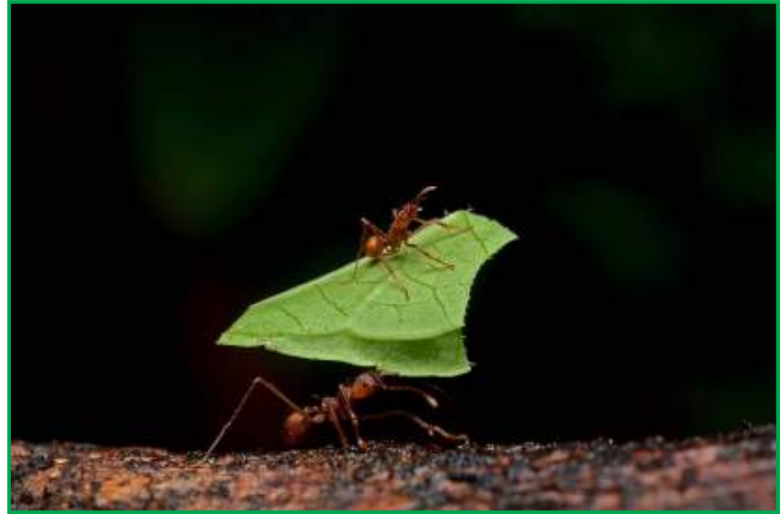
Projeto de biopesticida combate formigas cortadeiras em plantações

Quenquém, saúva-de-vidro, saúva limão e saúva-mata-pasto: essas são apenas algumas das espécies de formigas cortadeiras que fazem a festa em quintais alheios. Elas cortam e carregam as folhas até os seus ninhos porque esse material é utilizado para a produção de fungos que, mais tarde, servirão de alimento para esses insetos. O problema é que esse processo acaba causando prejuízo aos agricultores. Isso porque, da noite para o dia, as formigas cortadeiras são capazes de desfolhar boa parte