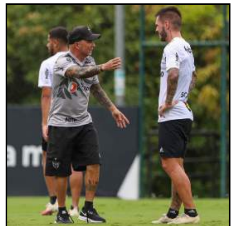
No melhor dos cenários, Galo termina em segundo lugar e garante vaga direta nos grupos

pela 37ª rodada do Brasileiro. O duelo será fundamental para os dois principais postulantes ao título. Neste momento, restando duas rodadas, o Inter lidera a competição, com um ponto de vantagem sobre o Flamengo, o segundo colocado.