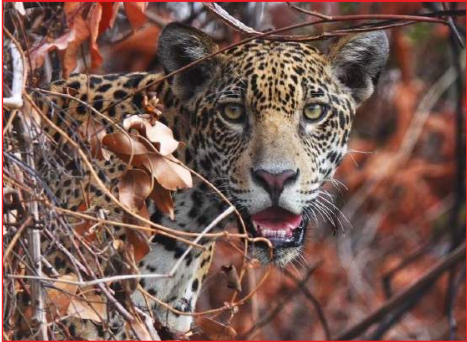
Incêndios em 2020 atingiram 30% do bioma e afugentaram onças

As onças foram para as matas ciliares, que foram menos afetadas pelo fogo e, por estar na beira do rio, ficaram mais visíveis para quem está