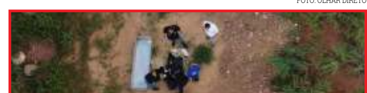
empresária foi morta com cortes no pescoço