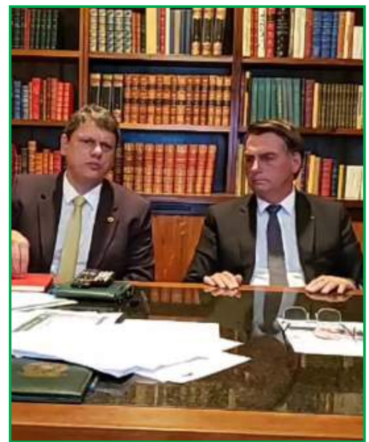
Medidas passam a valer a partir de março