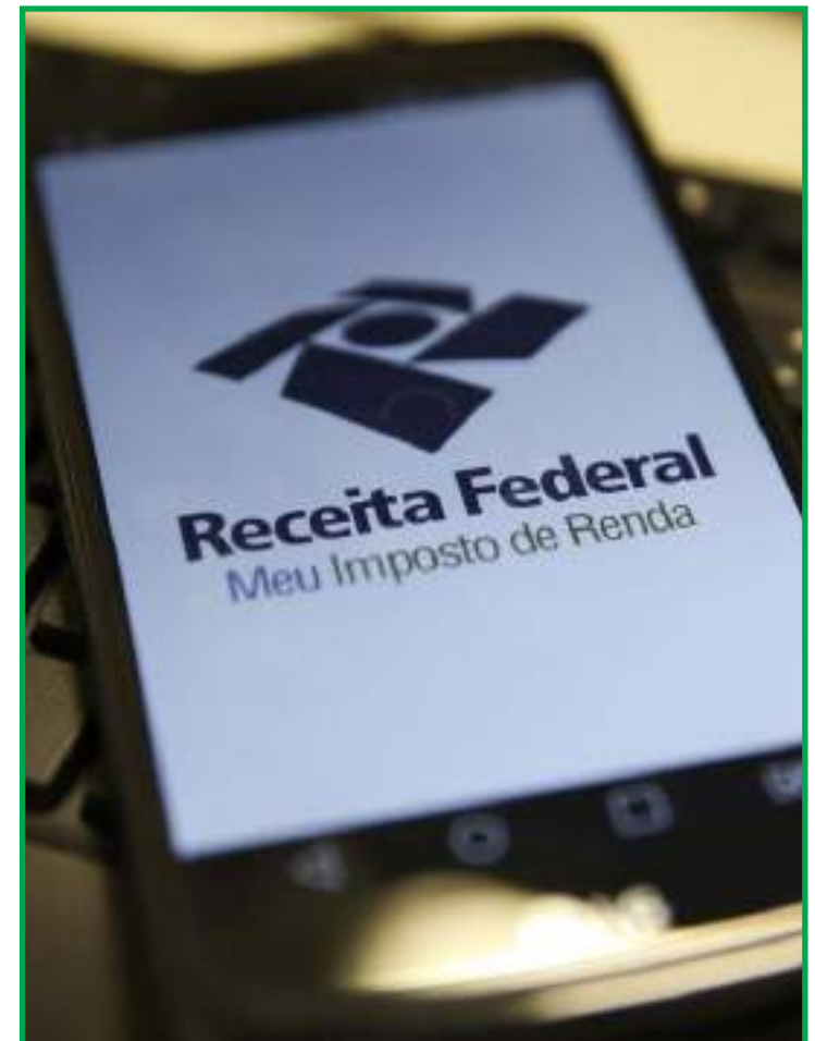
Dedução é para programas voltado a pessoas com deficiência ou câncer