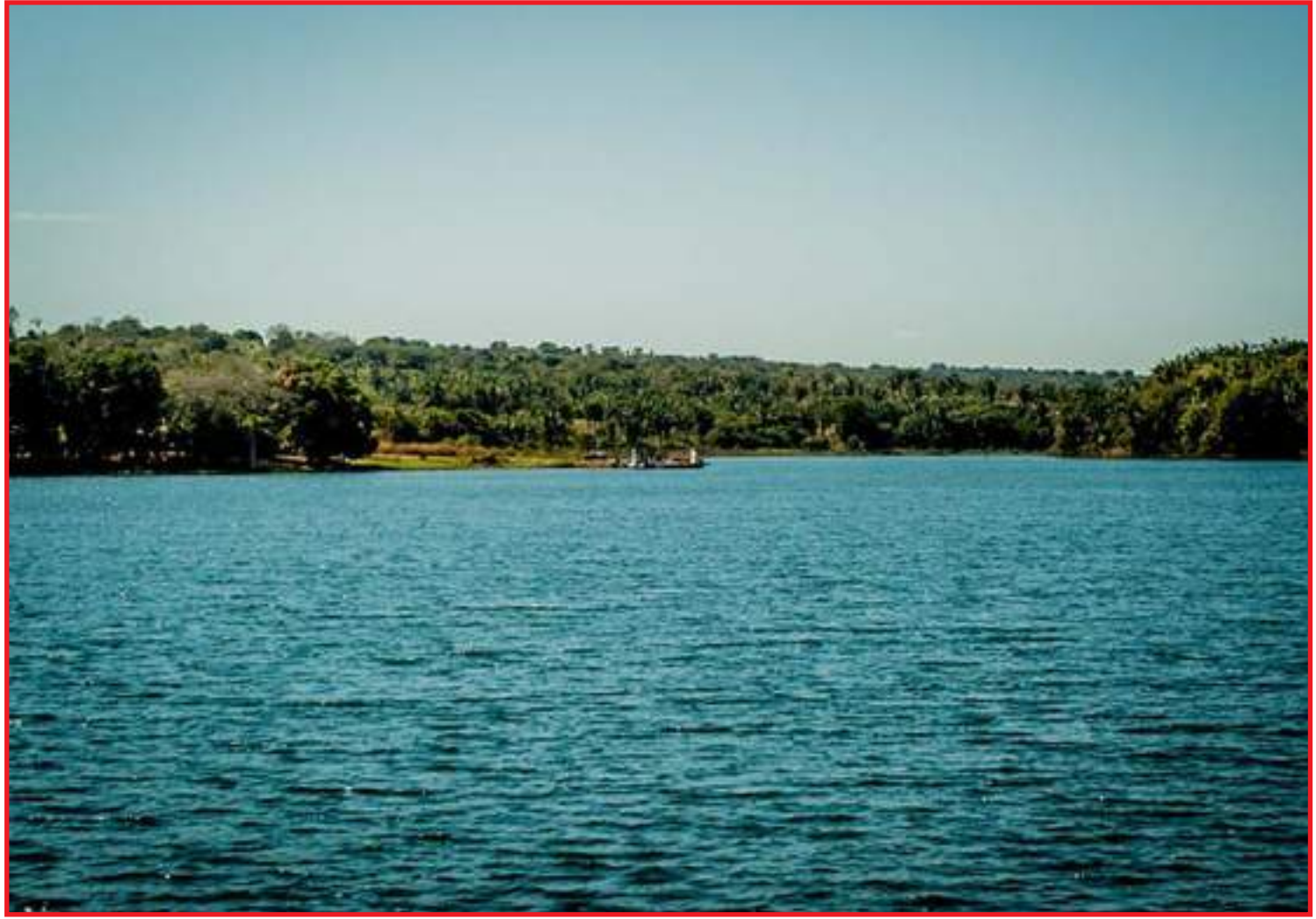
Lago do Manso se tornou um dos principais pontos turísticos de MT

Os recentes ataques de piranhas no Lago do Manso, foi o que motivou os moradores e proprietários de casas de campo na região a fazerem uma campanha para