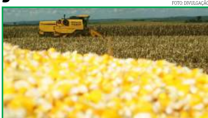
Primeira estimativa da saca 2021/22

Por fim, levando em conta todos os fatores citados, para que o produtor