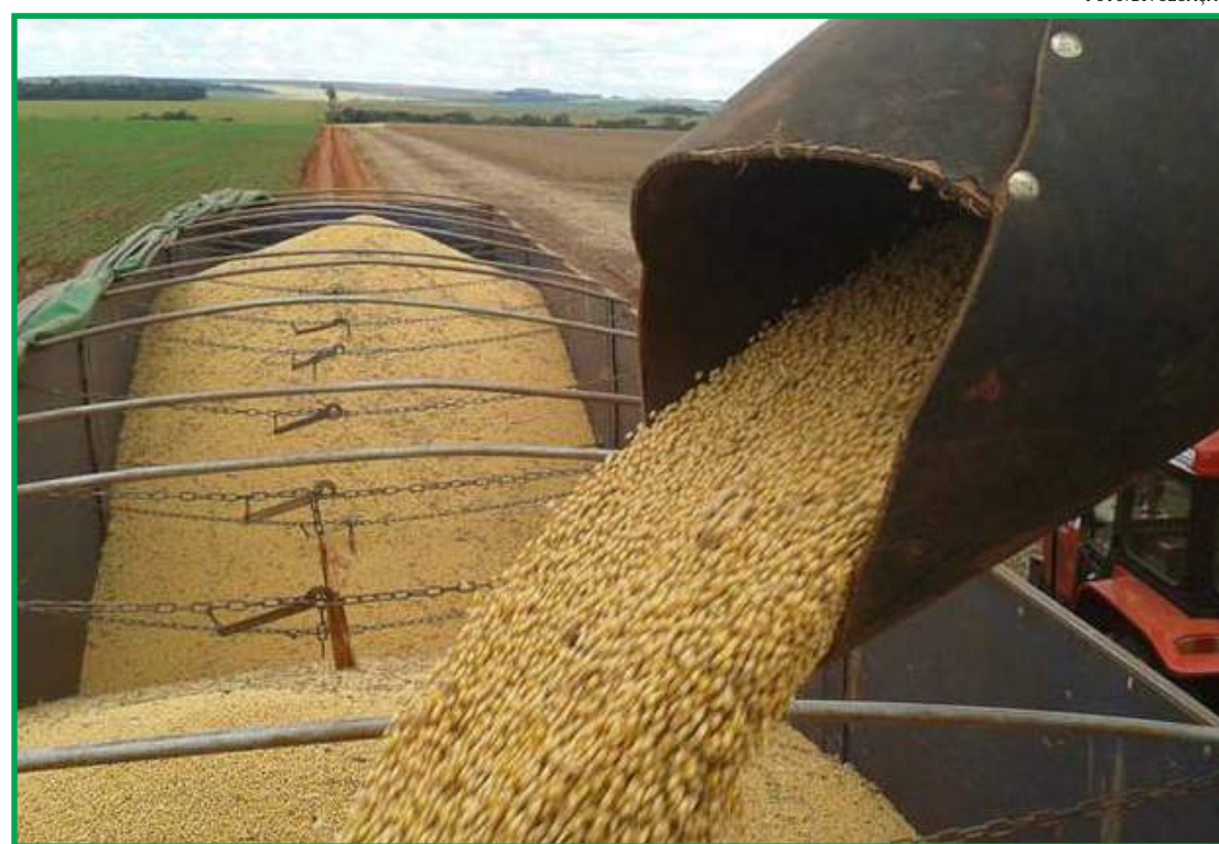
Governo esclarece como empresas devem proceder na hora de recolher tributo

O documento deixa claro que o valor deverá ser calculado sobre o peso dos grãos após a classificação e não sobre o peso bruto da carga. Esta definição já havia sido publicada em agosto do ano passado, quando o Governador Mauro Mendes sancionou mudanças na Lei do Fethab, atendendo a uma antiga demanda dos agricultores. Porém, segundo a Aprosoja-MT, algumas empresas não estavam aplicando na prática as