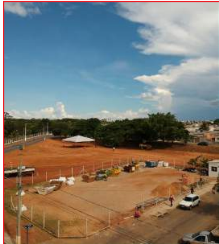
Área é de 5,7 mil m 2 , com Academia da Terceira Idade, playground e arborização

calçada no entorno da praça terá 2,5 metros de largura que irá permitir à população a prática de caminhadas ao ar livre. O projeto também prevê paisagismo com diferentes espécies de árvores como flamboyant, oiti e os três tipos de ipê-branco, amarelo e roxo, para garantir o colorido durante a primavera. O prazo previsto para a entrega da obra da praça do bairro Bela Vista é de 150 dias. Outro destaque anunciado pelo prefeito é o início da obra de revitalização do Ecoponto do mesmo bairro, com orçamento de R$ 65 mil e conclusão prevista para 60 dias. O projeto será pago, inicialmente, com recursos do município, porém, 100% do valor investido será reembolsado pelo Fundo do Meio Ambiente da Promotoria de Justiça de Primavera do Leste, conforme estabelecido em Termo de Ajustamento de Conduta (TAC).