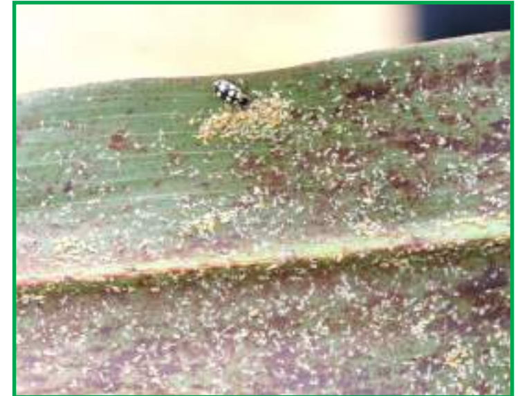
Praga já tem sido vista em cultivos de verão em Mato Grosso