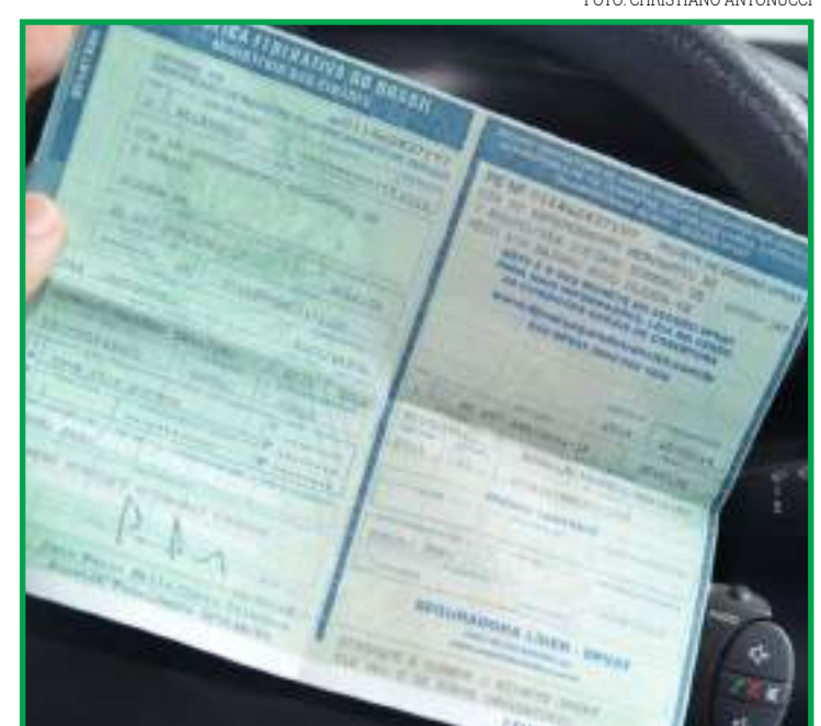
Medida visa minimizar impacto econômico causado pela pandemia