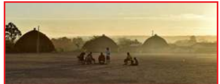
Terra Indígena Marãiwatsédé enfrenta crescimento de casos da Covid-19