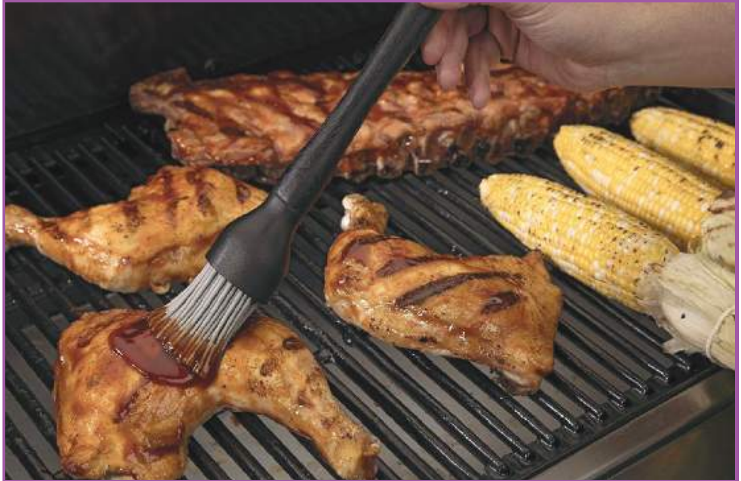
Grill quebra um galho quando faltar uma churrasqueira

Para que o churrasco em casa seja gostoso, você não pode errar o ponto da