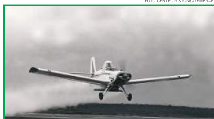
O Ipanema voou pela primeira vez em 1970

O Ipanema é atualmente o pulverizador aéreo mais utilizado em fazendas no Brasil. De cada 10 aviões agrícolas em operação no país, seis deles são do modelo fabricado pela Embraer, que está próxima