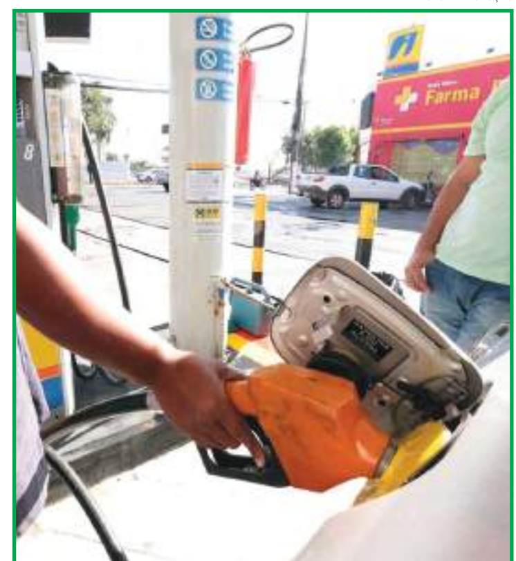
Valor da gasolina já subiu pela quinta vez neste ano

e flexibilizado as operações em regiões com terrenos irregulares. A aeronave também tem aplicação em atividades de semeadura, controle de vetores e larvas, povoação de rios e até combate a incêndios florestais.