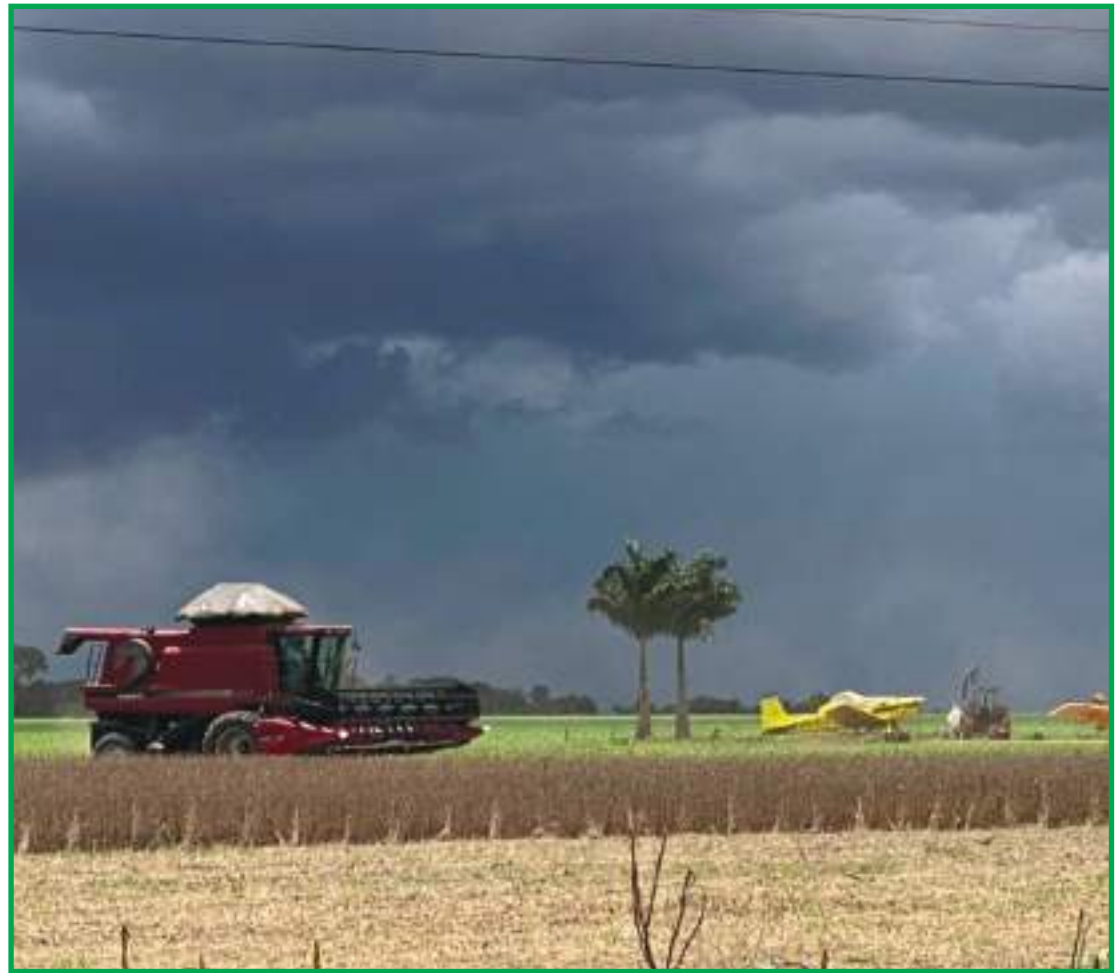
Área de soja abrangeu mais de 400 mil hectares na safra 2020/21

Uma coisa leva a outra e vai beneficiar toda a região", concluiu o secretário.