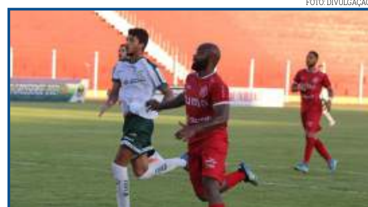
Luverdense, Mutum e União receberão R$ 560 mil

Em 2020, o Cuiabá entrou diretamente nas oitavas de final da Copa do Brasil. O clube eliminou o Botafogo, com uma vitória por 1 a 0 dentro da Arena Pantanal e um