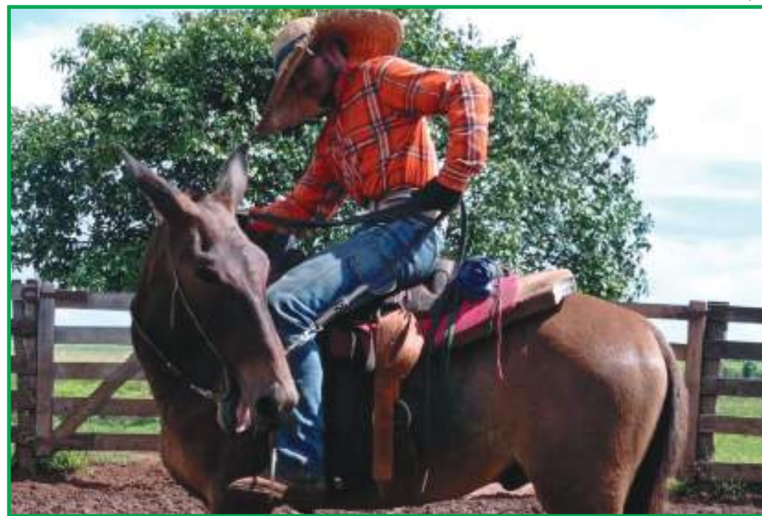
Treinamento foi oferecido a funcionários da Fazenda Stella

Os participantes receberam instruções sobre segurança e saúde no trabalho, meio ambiente, introdução, orientações sobre anemia, infecciosa equina, conhecer sobre o animal, identificar os equipamentos, arrear o animal, montar no animal, manter a postura correta e o equilíbrio sobre o animal, conhecer os andamentos básicos, conhecer as ajudas, fazer os exercícios de rédeas e equitação, desmontar do animal, desarrear o animal, princípios de gestão.