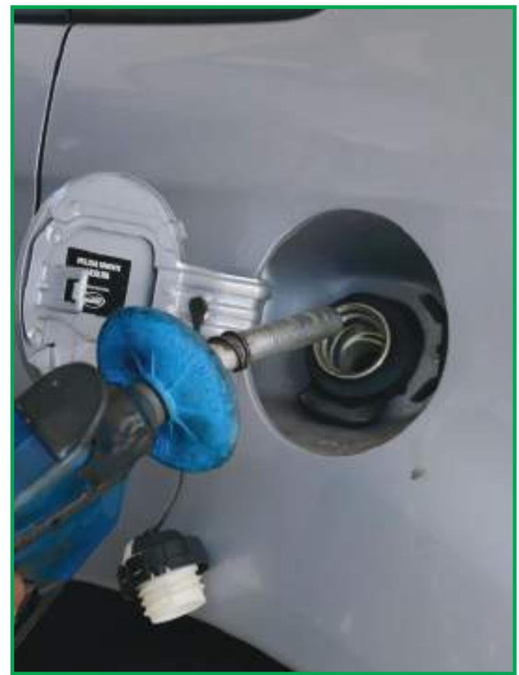
Álcool acumula aumento de 21% desde janeiro