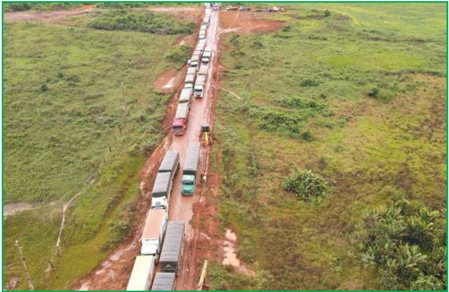
Bancada federal vinha exigindo solução para um trecho da rodovia

A BR-158 chega a movimentar por dia 2 mil carretas bitrem com 70 toneladas cada.