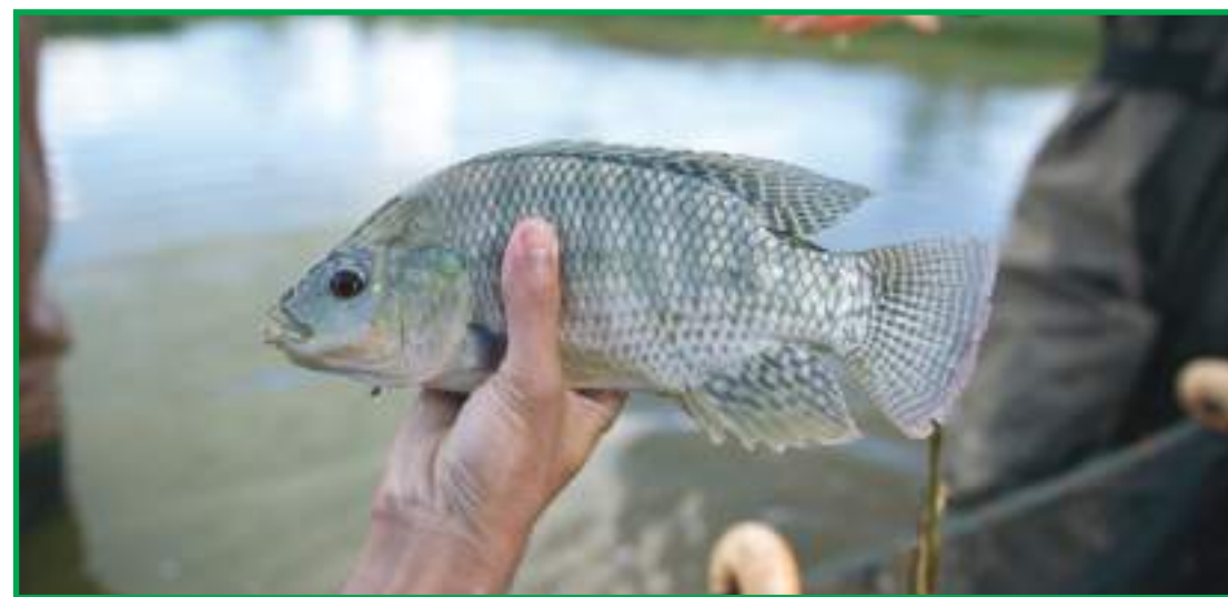
Desempenho foi o melhor entre todas as espécies de peixes de cultivo

O desempenho da tilápia foi o melhor entre todas as espécies de peixes de cultivo. A produção cresceu expressivos 12,5% em relação ao ano anterior (432.149 t). A região Sul lidera a produção de tilápia no Brasil, com 44% do total (213.351 t). Entre os estados, destaque absoluta ao Paraná, com 166.000 t (135% a mais que São Paulo, o se-