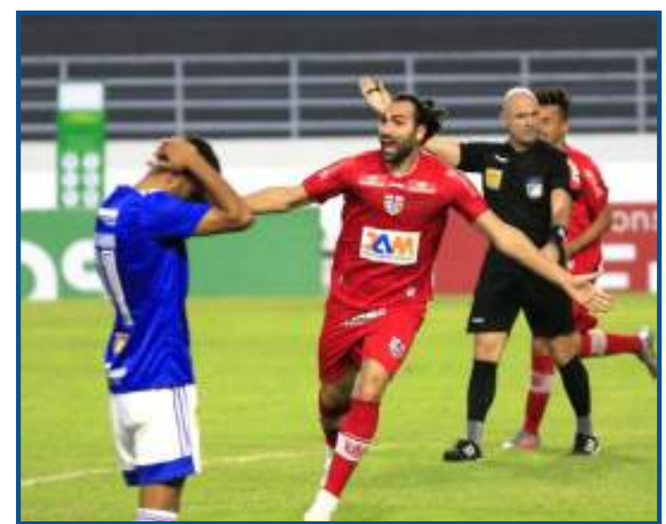
Raposa foi eliminada da última Copa do Brasil pelo CRB