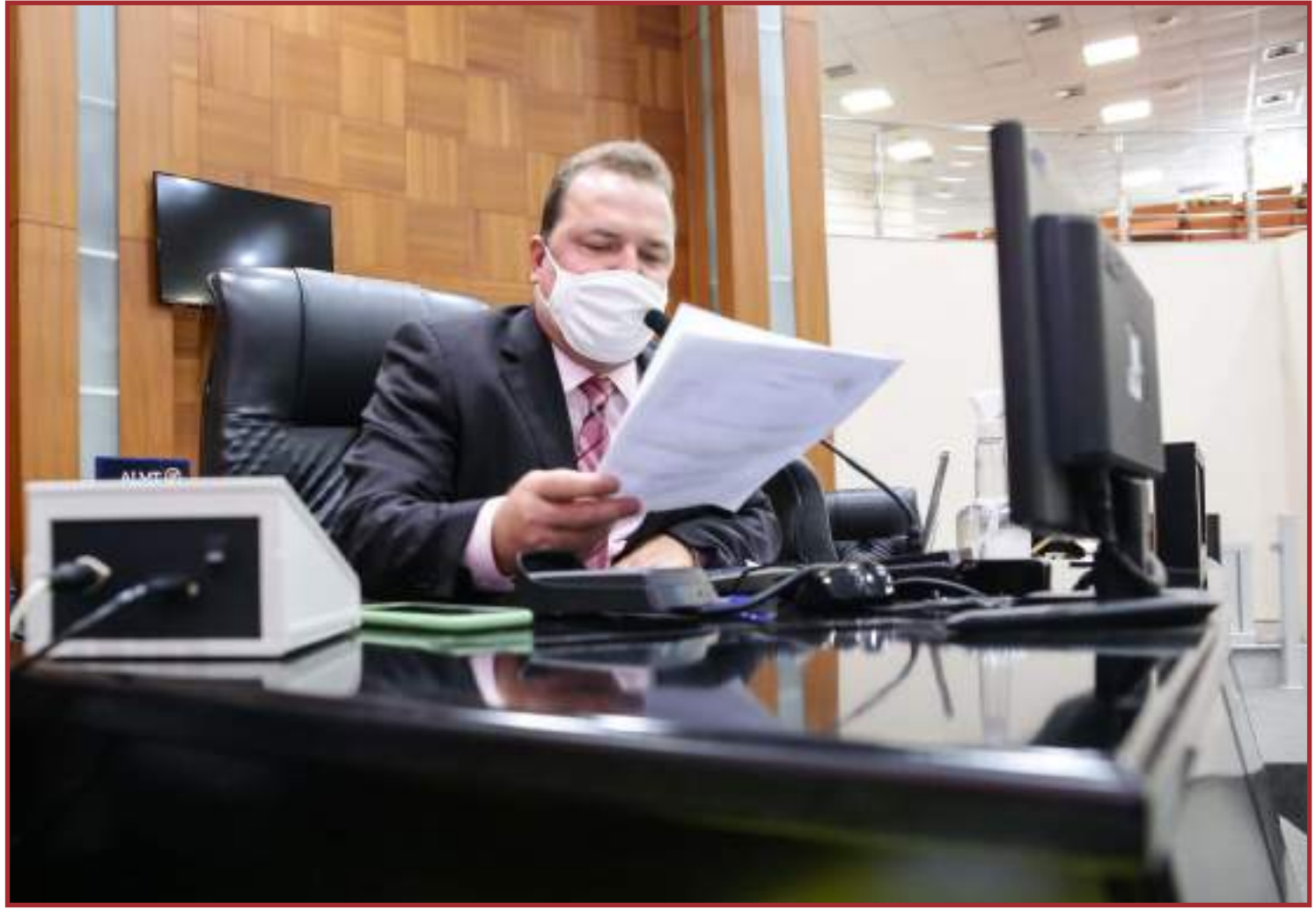
Agência de Fomento pode ser saída para empresários e comerciantes

A Agência de Fomento do Estado de Mato Grosso S/A - Desenvolve MT é uma Sociedade Anônima de Economia Mista, de capital fechado, com sede e foro em Cuiabá, Estado de Mato Grosso. Constitui-se em um instrumento de execução da política de investimento