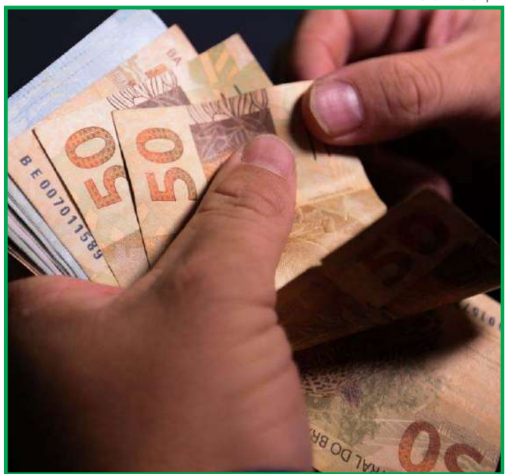
Prazo foi estendido de 8 para 11 meses

De acordo com o Ministério da Economia, o programa disponibilizou mais de R$ 37 bilhões em financiamentos para quase 520 mil micro e pequenos empreendedores.