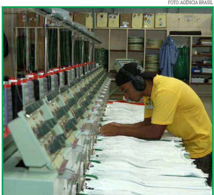
Alta sustentou o crescimento de 0,4% da indústria nacional, diz IBGE

Na comparação com janeiro de 2020, oito dos 15 locais pesquisados tiveram resultados positivos, com destaque para os estados do Pará (13,3%), Paraná (11,5%) e Santa Catarina (10,1%). Sete locais tiveram queda, sendo as maiores delas na Bahia e no Mato Grosso (ambos com recuo de 13,9%).