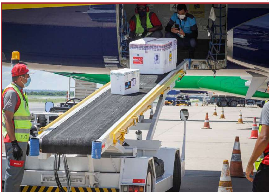
Doses chegaram ontem à Capital

Após a chegada da remessa, as equipes da Vigilância Estadual trabalharam na conferência da quantidade, catalogação dos imunizantes e encaixotamento para distribuição e retirada dos municípios. Até o momento, Mato Grosso recebeu apenas 250 mil doses de imunizantes contra a Covid-19.