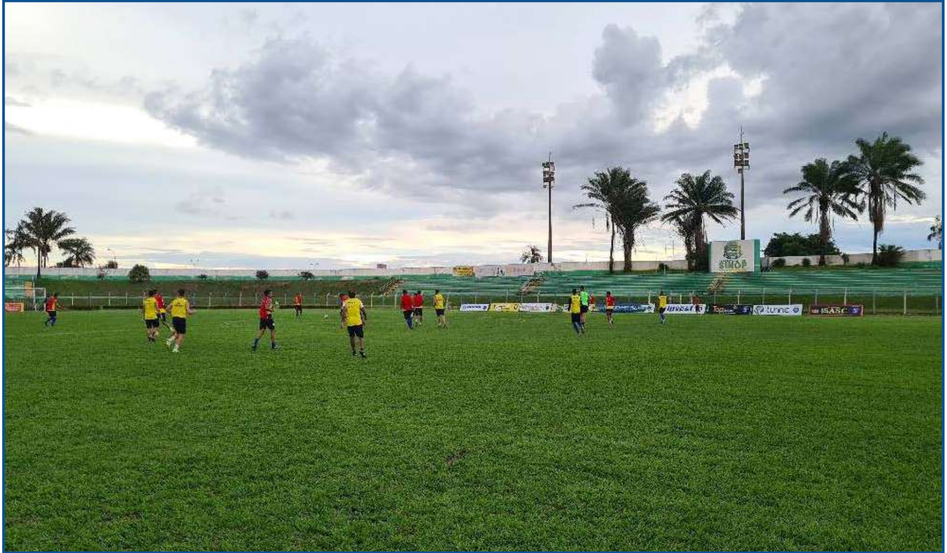
Sinop treina buscando reabilitação no campeonato

No mesmo dia, o Dourado recebe o Operário-VG, às 17h, na Arena Pantanal. Com seis pontos somados, a equipe da Capital está na liderança com melhor saldo de gols que o Sorriso (7 a 6). O confronto estava agendado para o domingo, mas teve que ser antecipado devido a estreia do Cuiabá pela Copa do Brasil na próxima terça-feira (não daria o intervalo de 66 horas de um jogo para outro). Em