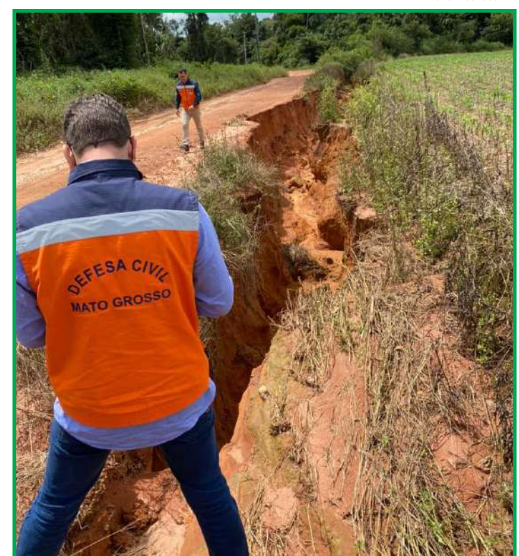
Chuvas contínuas causaram alagamentos