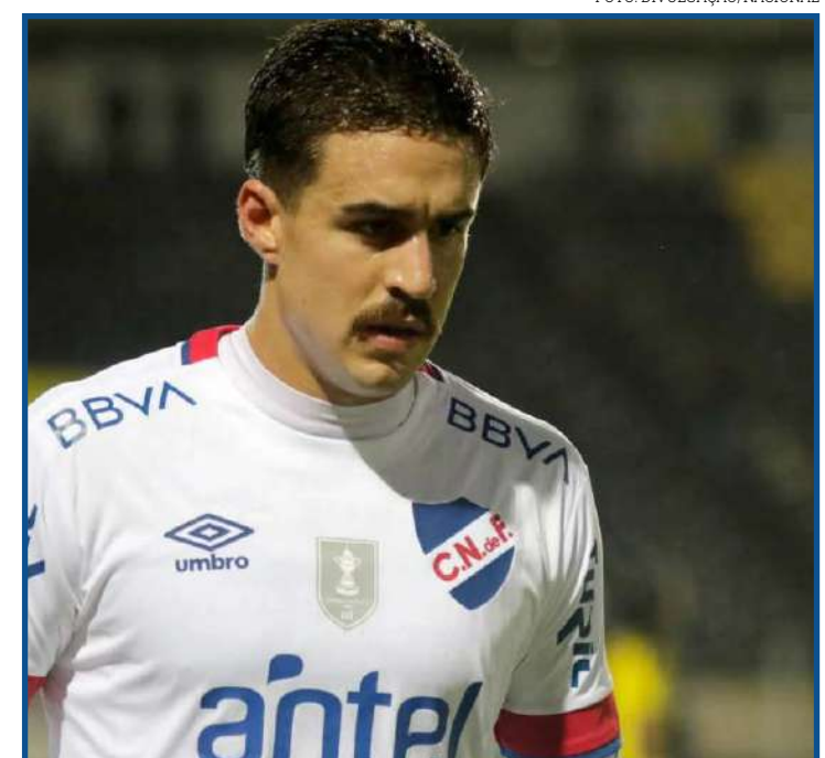
Neves negocia com o São Paulo, que adota discrição