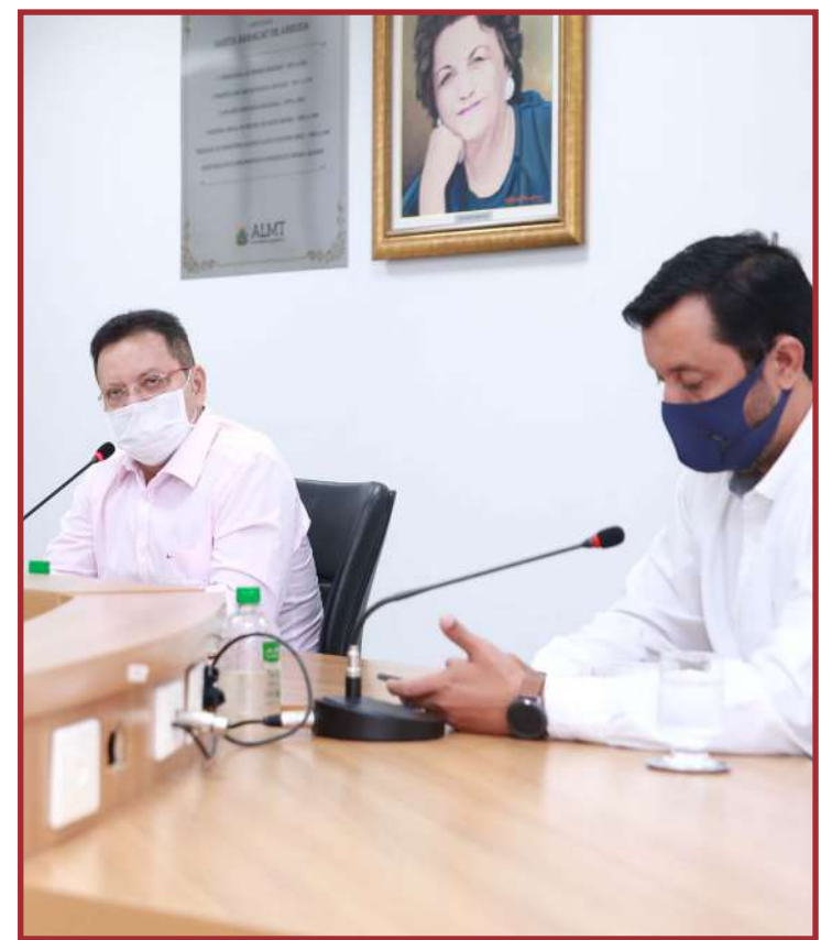
Indústria e comércio sentem reflexos negativos e buscam solução