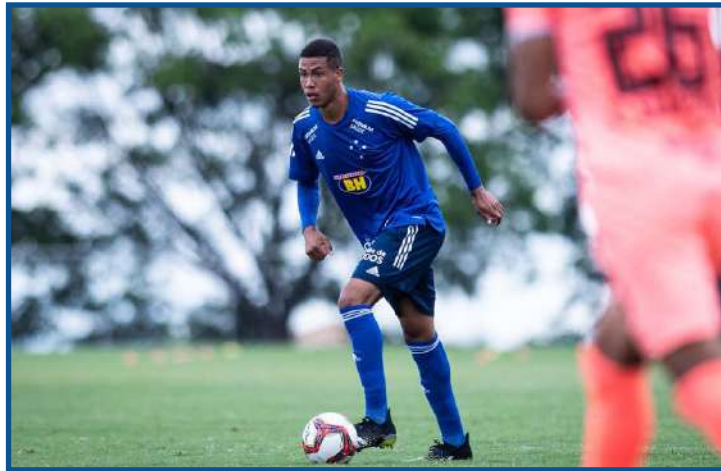
Garoto é o terceiro zagueiro a ficar fora da partida