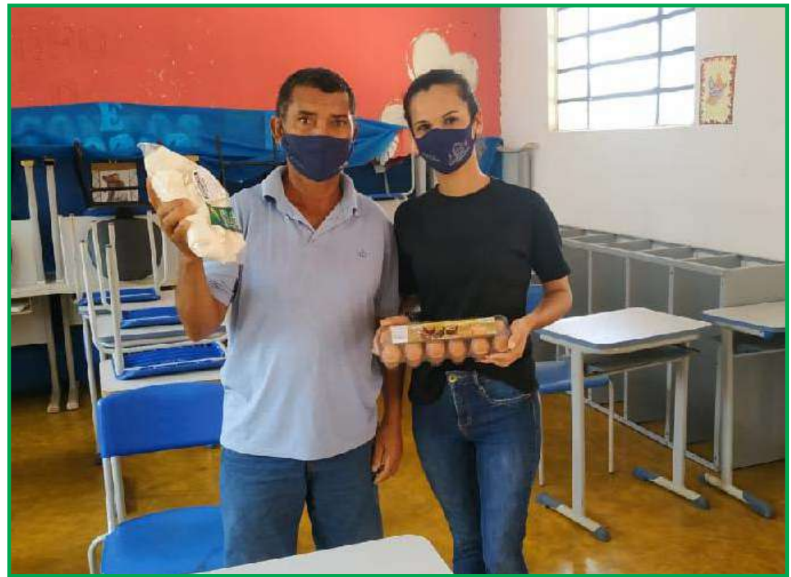
Agricultores familiares estão entregando frutas, legumes, verduras e ovos