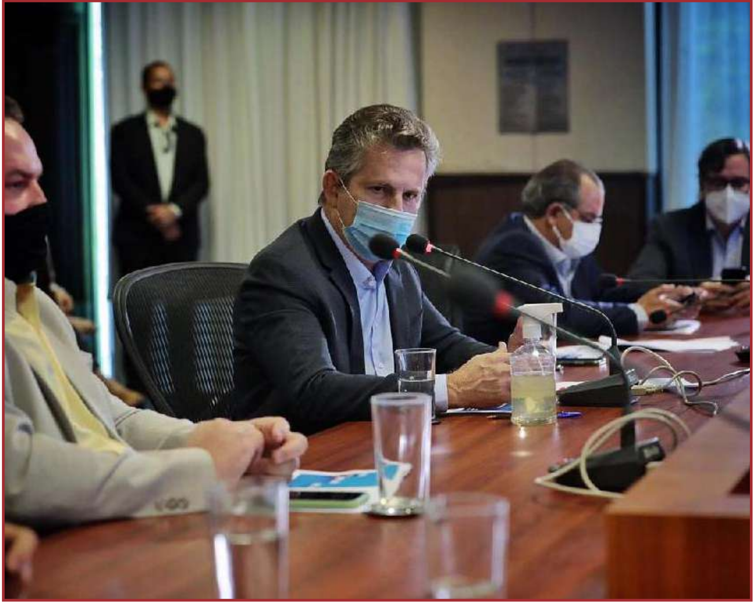
Governador Mauro Mendes anunciou novas medidas

- Toque de recolher a partir das 21h até às 5h, com proibição de circulação.