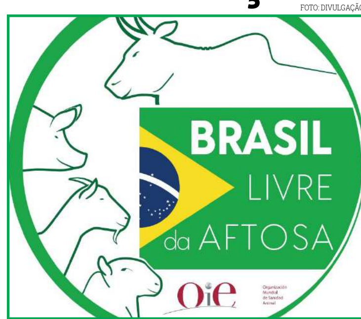
Decisão deve ser confirmada em maio

A gente tem que ter responsabilidade, todos, principalmente apoio aos serviços de veterinária oficial, aos institutos de defesa animal para que, com a responsabilidade devida, a gente coloque o Brasil em outro patamar, sem correr risco sanitário nenhum", completou.