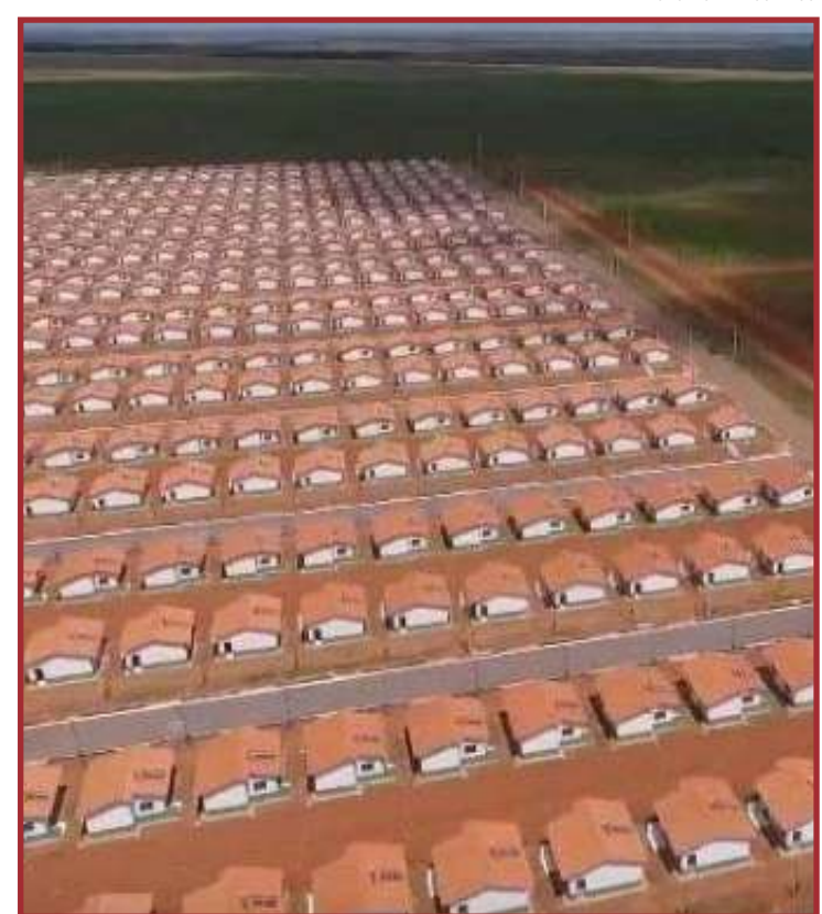
Ação custará cerca de R$ 9 mi/mês para o Estado