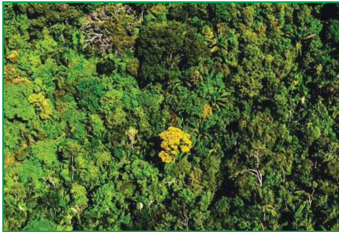
Proibição significaria a paralisação de todos os 1.681 empreendimentos

A Justiça Federal determinou no domingo (21), em caráter liminar, que a União não promova o bloqueio do sistema de emissão do Documento de Origem Florestal (DOF) para produtos florestais com origem de Mato Grosso. O Instituto Brasileiro do Meio Ambiente e dos Recursos Naturais Renováveis (Ibama) havia anunciado o bloqueio a partir desta segunda (22). Na prática, a proibição significaria a paralisação de todos os empreendimentos do setor de base florestal de Mato Grosso. As 1.681 empresas ficariam impedidas de comercializar e transportar seus produtos florestais de origem nativa para outros estados da federação. A juíza federal da 1ª Vara Federal Cível e Agrária Seção Judiciária de Mato Grosso, Ana Lya Ferraz da Gama Ferreira, concedeu tutela provisória de urgência impedindo o bloqueio do sistema, pela falta de "razoabilidade" e "proporcionalidade".