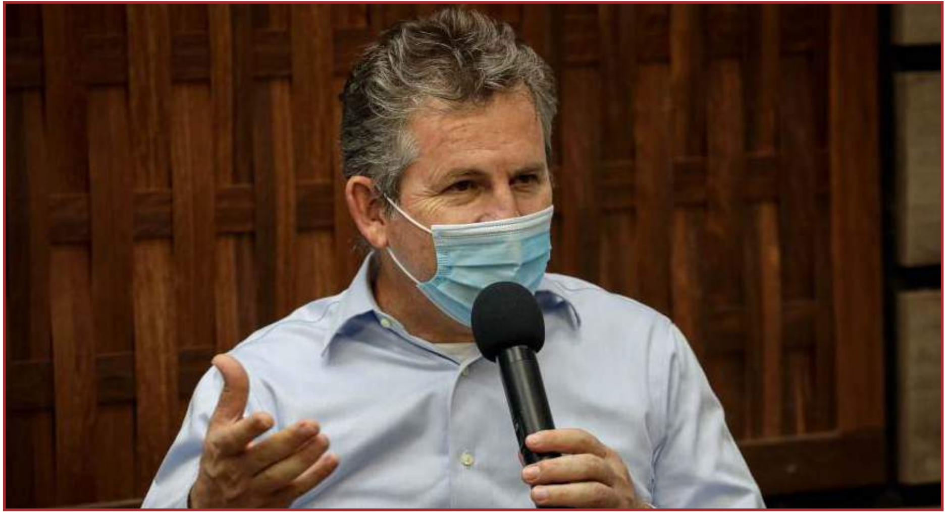
Governador Mauro Mendes anunciará "medidas mais efetivas"

"O consenso entre os setores e o Governo é de que há a necessidade urgente de se tomar medidas mais efetivas", consta nota do Governo do Estado. As novas medidas deverão começar a valer nas primeiras horas da próxima sexta (26). Mendes não divulgou qual será o horário em que anunciará o novo decreto.