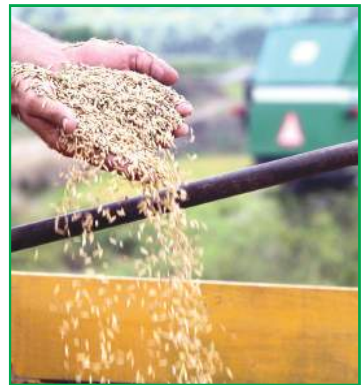
Entidade ainda projeta produção de arroz ainda maior

disse que irá apoiar a medida do Governo, caso seja implantada.