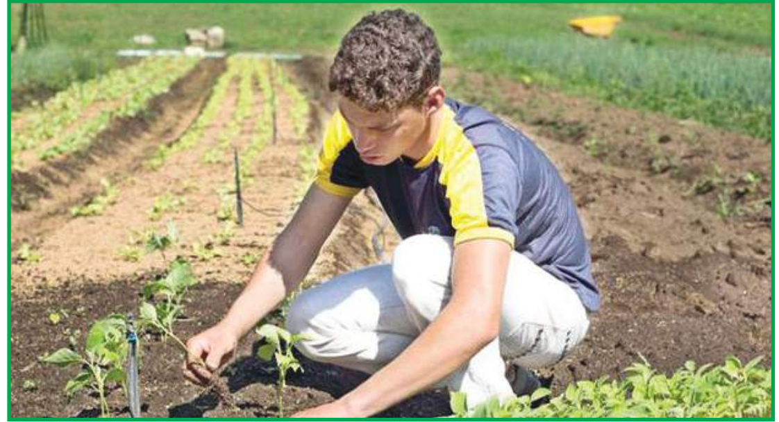
Pronaf ainda é pouco conhecido

O Plano Safra prevê mais recursos e oportunidades para os pequenos produtores. Os beneficiários do