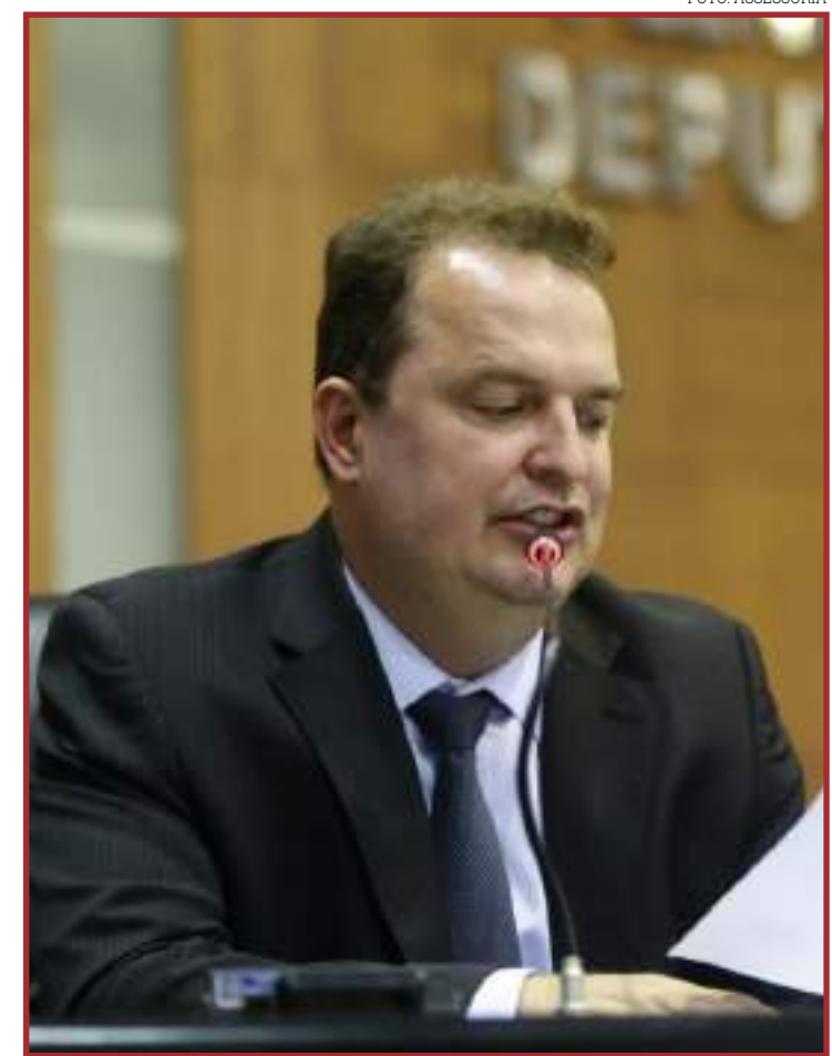
Russi cobrou prioridade na recuperação asfáltica