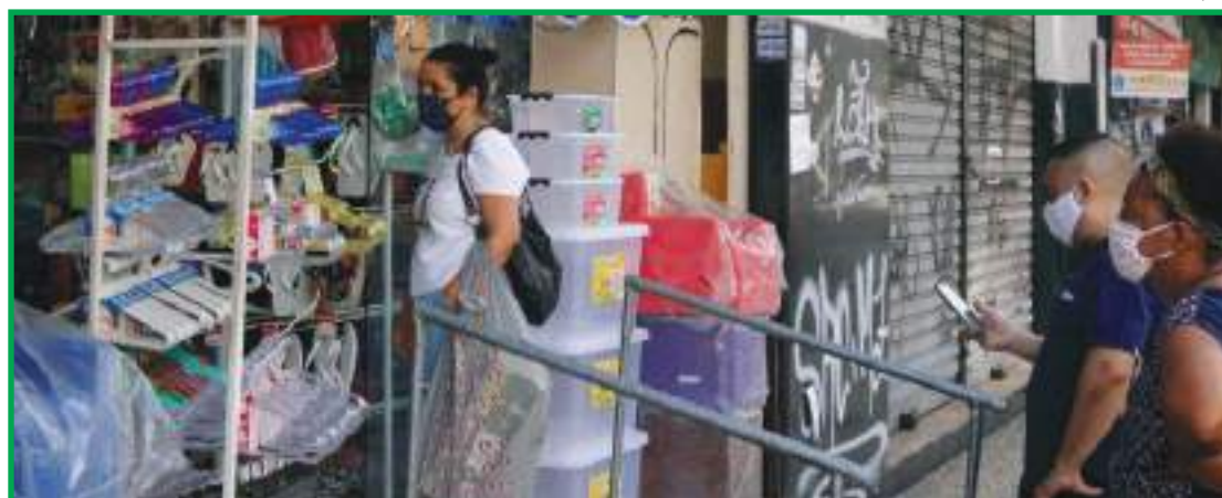
CDL vai contra antecipar feriados

Diferente de algumas CDLs de Mato Grosso, a Federação do Comércio de Bens,