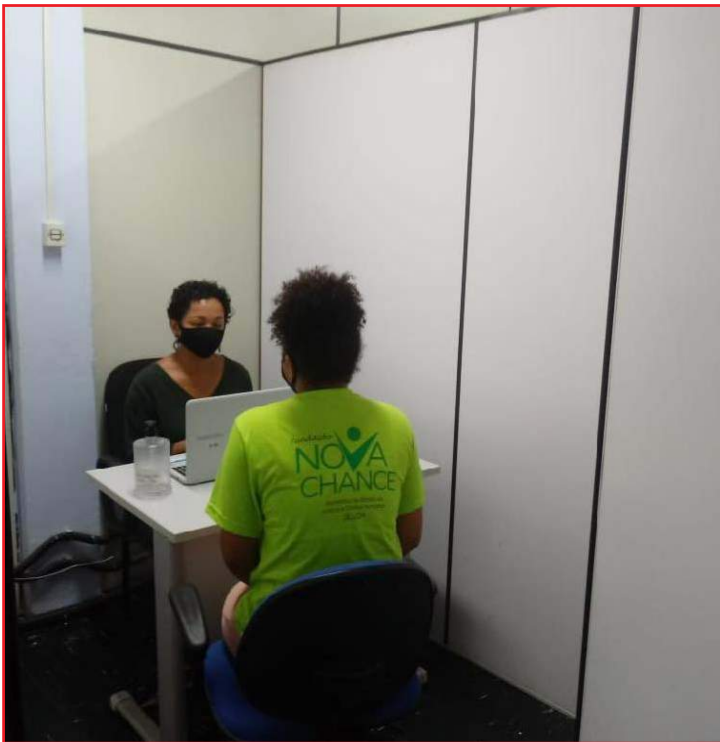
Um total de 472 homens e mulheres exercem alguma atividade laboral

Os telefones para contato são 3613-8626, 3613-8613, 98463-0210 e 99919-6161.