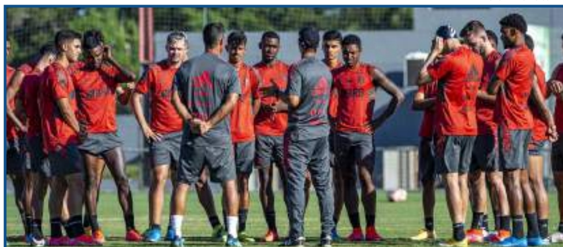
Grupo do Flamengo que disputa o Carioca durante treino no Ninho

O prefeito do Rio de Janeiro, Eduardo Paes, afirmou que estão proibidos os jogos na cidade entre os dias 26 de março e 4 de abril. A medida afeta o Campeonato Carioca, e, diante da possibilidade, o Flamengo já tinha feito consultas. As duas alternativas monitoradas pelo clube para mandar seus jogos fora da capital são em Volta Redonda e Nova Iguaçu. A diretoria aguarda o posicionamento oficial da Ferj sobre como será a sequência do Carioca. O Flamengo não conta com possibilidade de os treinos serem proibidos, o que realmente não está previsto