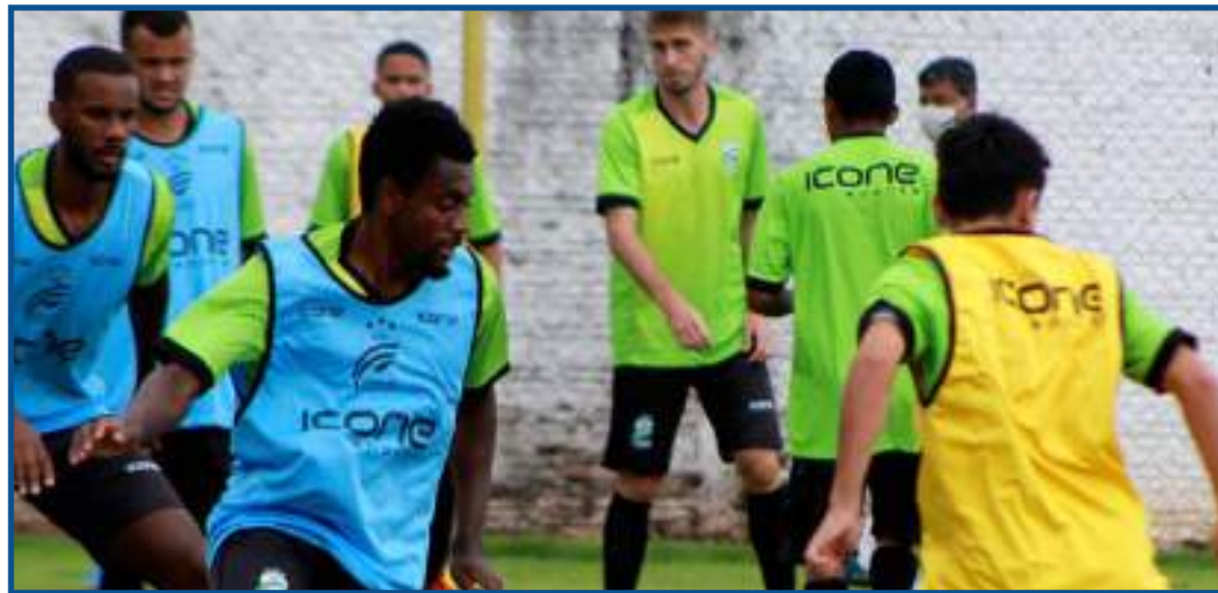
LEC treina em busca da primeira vitória

"Antes do primeiro treino, tivemos uma conversa com os jogadores. Temos que procurar se adaptar dentro daquilo que temos. Gosto que minha equipe seja rápida, intensa e que seja sempre organizada da melhor ma-