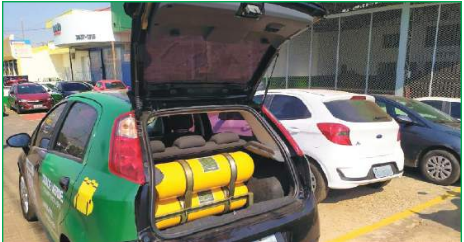
Veículo com kit gás: tendência no estado

"Fizemos um estudo de viabilidade para a região e sabemos das demandas dos