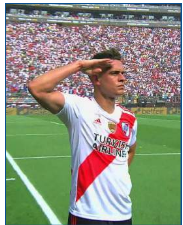
Atacante está descartado pela diretoria do São Paulo

em segundo lugar na Taça Guanabara com nove pontos em quatro partidas.