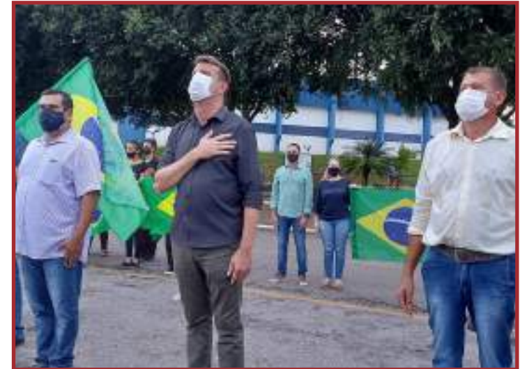
Prefeito percorreu as ruas contra medidas

NÃO BAIXE A GUARDA. A LUTA AINDA NÃO ACABOU.