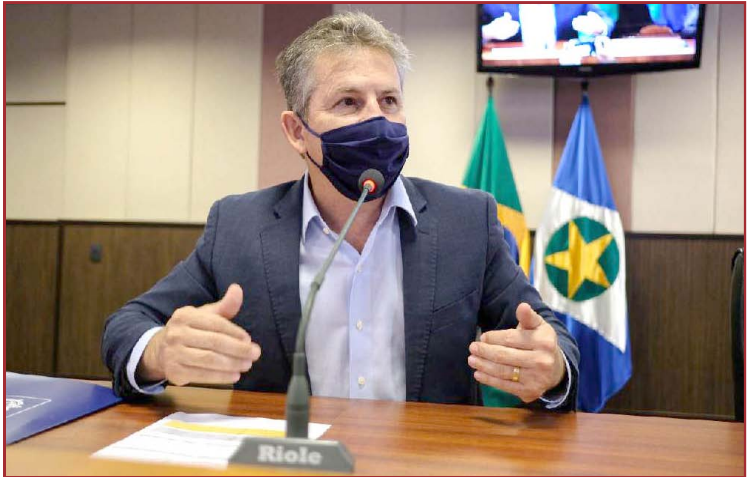
Verba será para construção e reforma de escolas, compra de equipamentos e de ar-condicionado

"Os investimentos vão garantir, por exemplo, a formação continuada dos estudantes e dos profissionais da educação. Nossa meta é melhorar cada vez mais o ensino público estadual e esses recursos nos dão garantia para continuar trabalhando nesse sentido, que é o que o governador Mauro Mendes nos determinou: melhorar as condições físicas das escolas, implementar cada vez mais recursos tecnológicos no en-