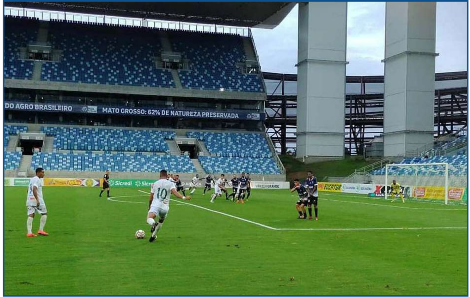
O Sinop FC perdeu mais uma partida neste Campeonato Mato-grossense

do Mato-grossense foram Cacerense (Grupo A), Araguaia e Operário LTDA (Grupo B), todos com 3 pontos – apenas o Araguaia não foi rebaixado.