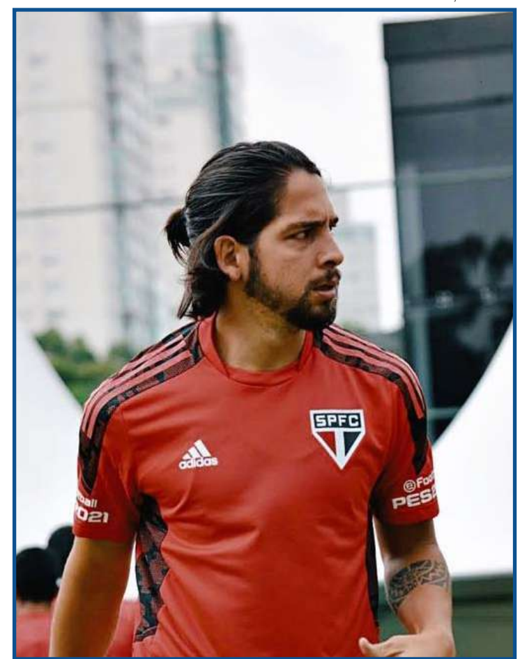
Benítez já treina no CT da Barra Funda