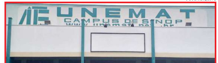
São linhas de pesquisa em Estudos Linguísticos e Estudos Literários