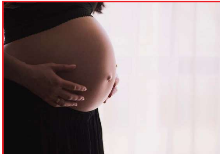
MT registrou 27 mortes em decorrência da Covid-19, sendo 17 somente neste ano

A médica também orientou que as mulheres gestantes evitem ir a hospitais sem necessidade. "É importante que a mulher mantenha o pré-natal adequado, mas que evite procedimentos que não são