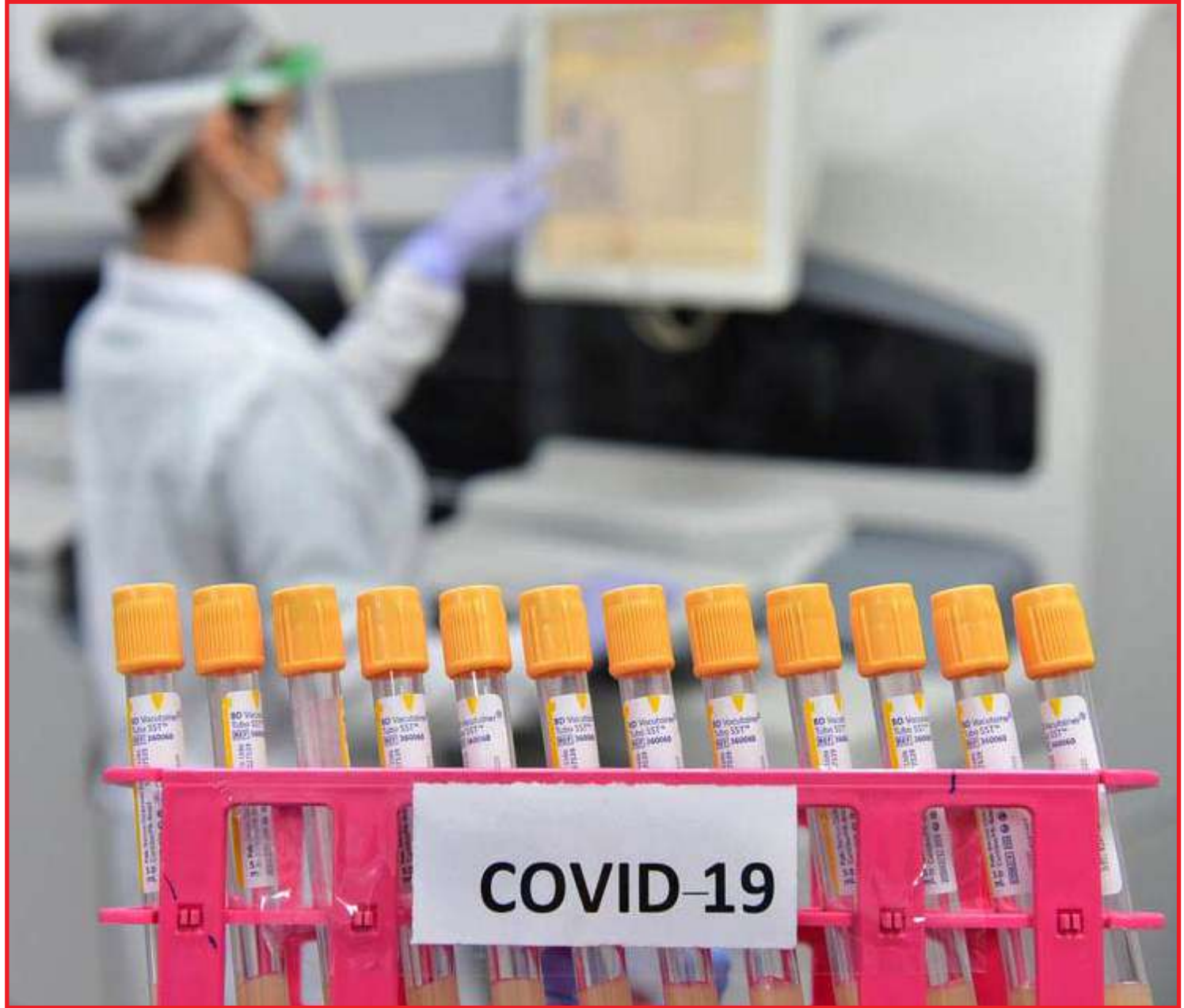
Equipamento para pesquisa de anticorpos contra o vírus SARS-CoV-2