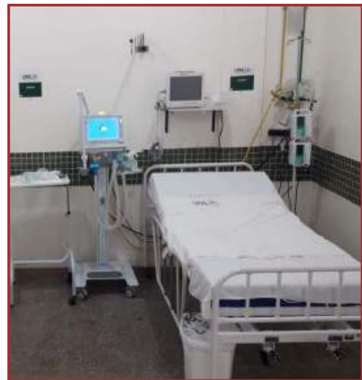
Os leitos foram abertos na UPA Sara Akemi Ichicava