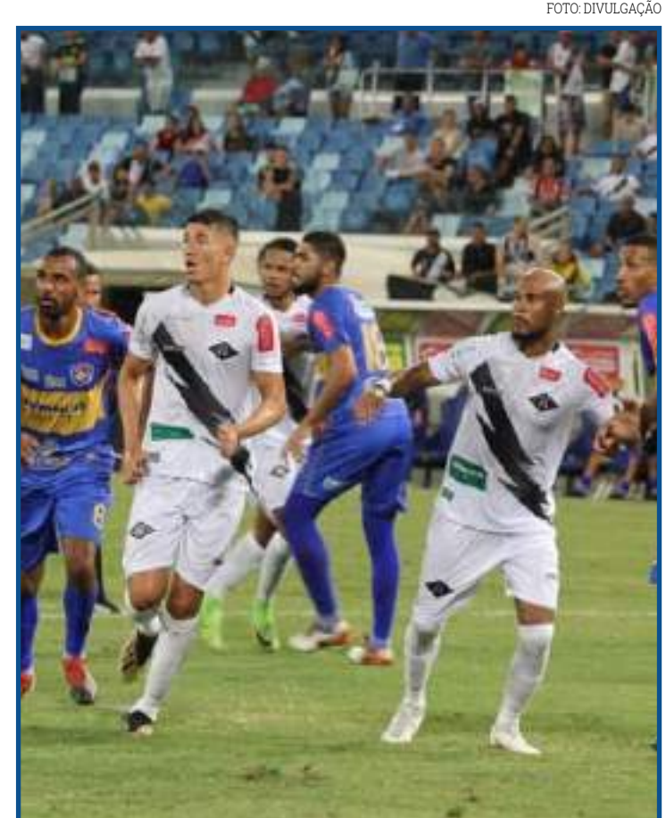
Rebaixados em 2020, Mixto e Araguaia devem jogar a Segundona

A fase de grupos da Libertadores começa daqui a duas semanas. A primeira rodada acontecerá entre os dias 20, 21 e 22 de abril. A tabela ainda será desmembrada pela Conmebol. A final da Libertadores está marcada para 20 de novembro, e decisão da Sul-Americana prevista para 6 de novembro. Os locais dos jogos ainda não foram definidos.