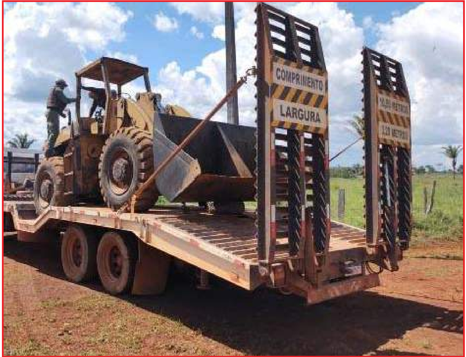
Maquinário é removido após apreensão

As equipes apreenderam 46 tratores de pneu, 22 tratores esteira, 17 caminhões, 12 motosserras, 10 armas e conduziram 14 pessoas à delegacia após flagrante de crime ambiental. A retirada do equipamento do infrator é uma etapa importante da fiscalização, porque além de impedir a continuidade dos ilícitos ambientais, permite a descapitalização do infrator de forma imediata. Para isso, o Estado conta com um contrato de uma empresa especializada na remoção de ma-