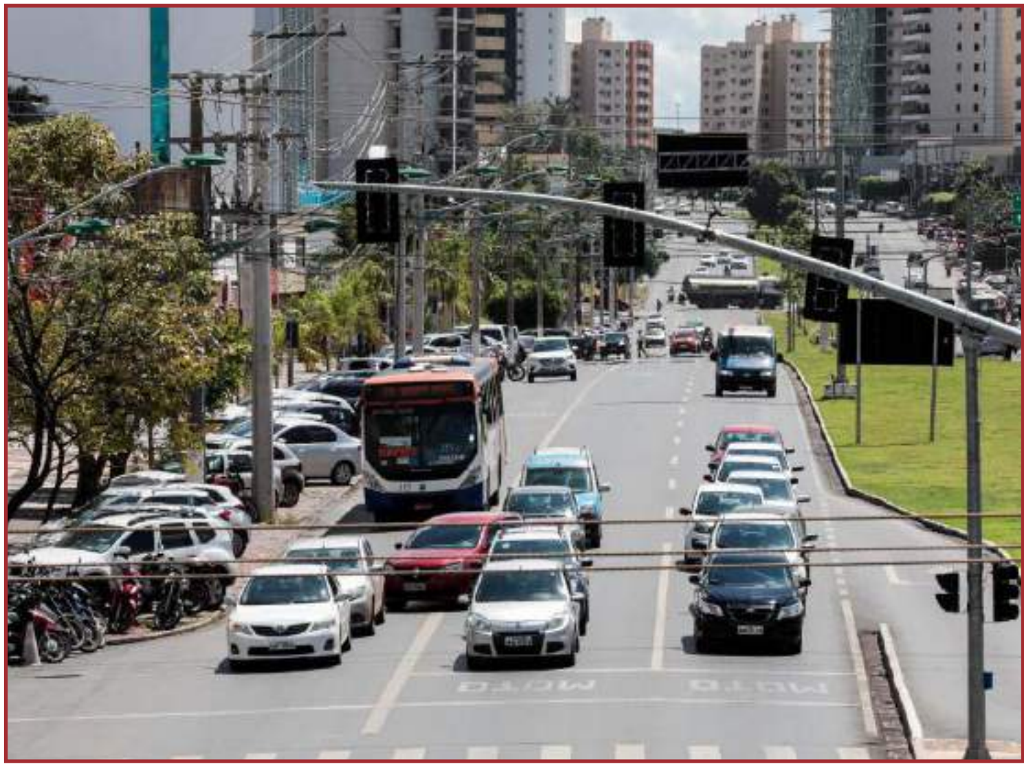
Diversas alterações serão promovidas

Antes das alterações, as crianças com idade inferior a 10 anos deveriam ser transportadas nos bancos traseiros dos veículos, sendo que até os 7 anos deveriam estar em dispositivo de retenção adequado para cada idade, salvo exceções devidamente regulamentadas pelo Conselho Nacional de Trânsito