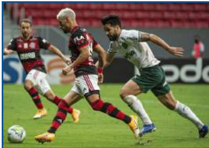
Fla x Palmeiras: decisão da Supercopa do Brasil

A partir de 2016, o Flamengo passou a frequentar a parte de cima da tabela do Brasileiro e elevou o investimento. Em 2018, ficou em segundo, e o Palmeiras foi o campeão. Em 2019, na administração Rodolfo Landim, o Flamengo recebeu a equipe de craques e viveu seu ano mágico com os títulos do Brasileiro e Libertadores. No