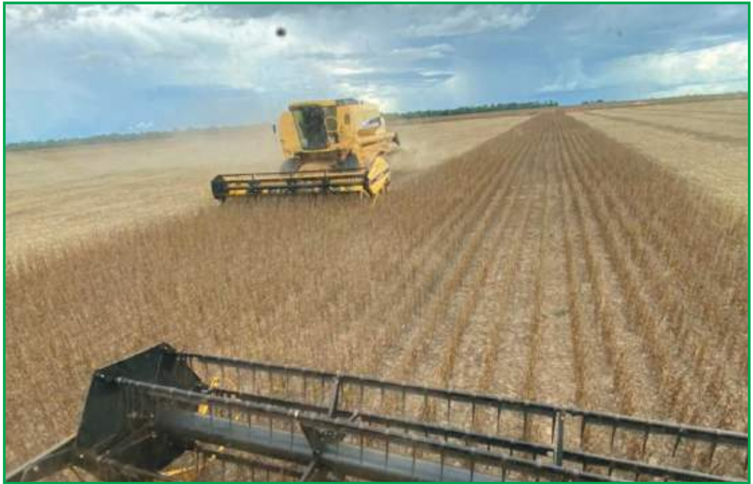
Incentivo para produção de peixes

do também não deve quebrar seu recorde individual, o Paraná.