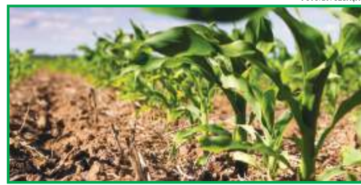
Irregularidade das chuvas aumentou incertezas quanto à produtividade

to nos preços, que operam em patamares recordes reais em muitas praças brasileiras. Entre 16 e 23 de abril, o Indicador ESALQ/BM&FBovespa avançou 0,84%, fechando a R$ 98,77/sc de 60 kg na sexta (23), recorde real da série. Em Canarana, o preço da saca do milho está sendo cotado, conforme Instituto Matogrossense de Economia Agropecuária (Imea), está sendo cotado a R$ 75,68. Em Querência, a R$ 75,58, conforme o instituto.