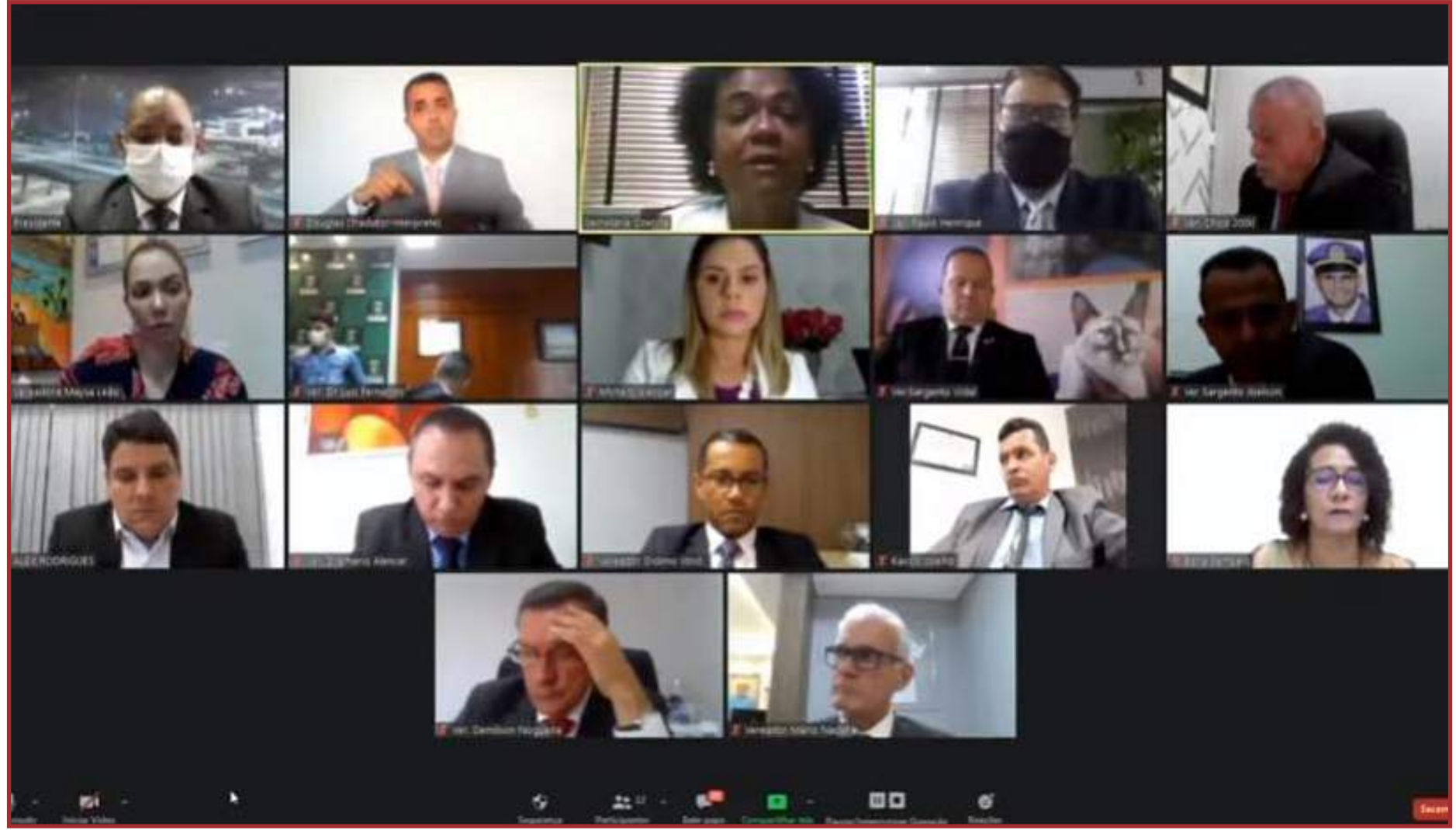
Ozenira desabafou em sessão da Câmara

Ao final de sua explanação, a gestora contou que sua relação com o racismo aconteceu desde o início da vida pública, e lembrou de uma vez que ela foi ter uma reunião com o governador