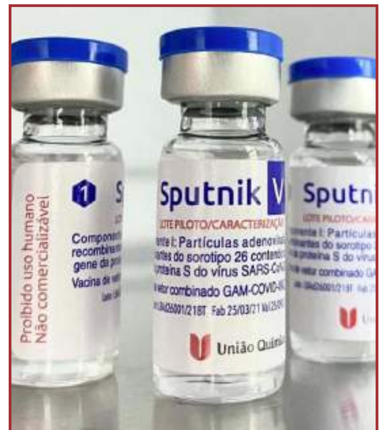
Mato Grosso não poderá importar 1,2 milhão de doses de vacina russa