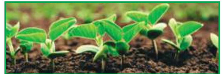
Município tem se tornado uma força estadual no agronegócio