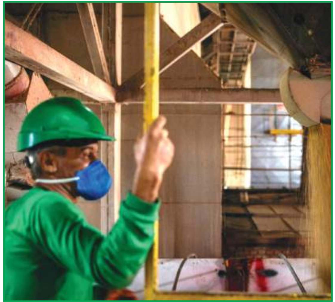
Caminhões descarregam soja em um silo da cidade de Sinop

Levantamento da Secretaria de Desenvolvimento Econômico de Sinop, somente no ano de 2020, indica que o município teve 3.974 empresas abertas uma crescente de pouco mais de 8% em relação ao ano anterior. "Somos grandes em outros segmentos, como por exemplo na prestação de serviços. Além disso, fomos apontados como destaque em um estudo nacional como referência no agro e no setor imobiliário", ressaltou o secretário.