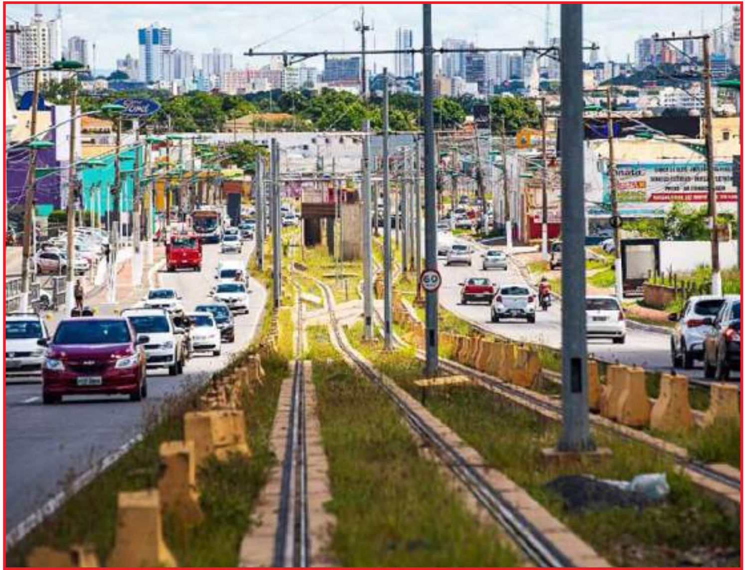
Vejam o VLT passando pelos trilhos...SQN!

Segundo a Sinfra, os estudos apontam também que o BRT terá uma tarifa mais acessível quando comparado ao sistema VLT. Ou seja, mensalmente o VLT demandaria um custo adicional que po-