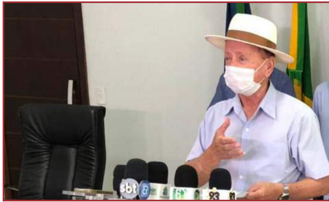
Dornier entregou verba para reforma do prédio

O batalhão de PM recebeu do Governo do Estado seis motos Honda XR 300 destinados às equipes de policiais militares da Companhia Raio de Moto-Patrolamento para o policiamento ordinário.