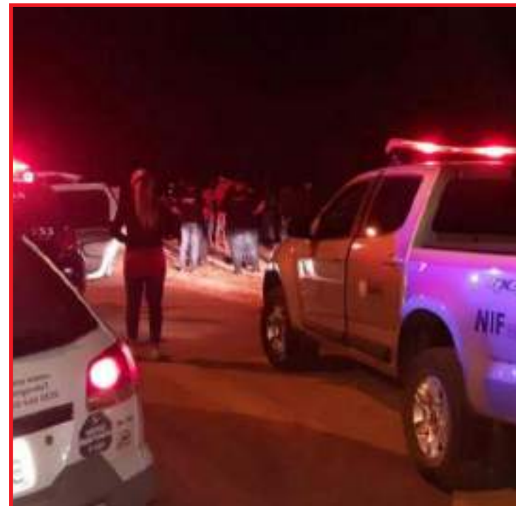
Atuação também foca pôr fim à perturbação do sossego

Ao todo, 109 estabelecimentos foram notificados, 317 aglomerações foram dispersas e 49 barreiras realiza-