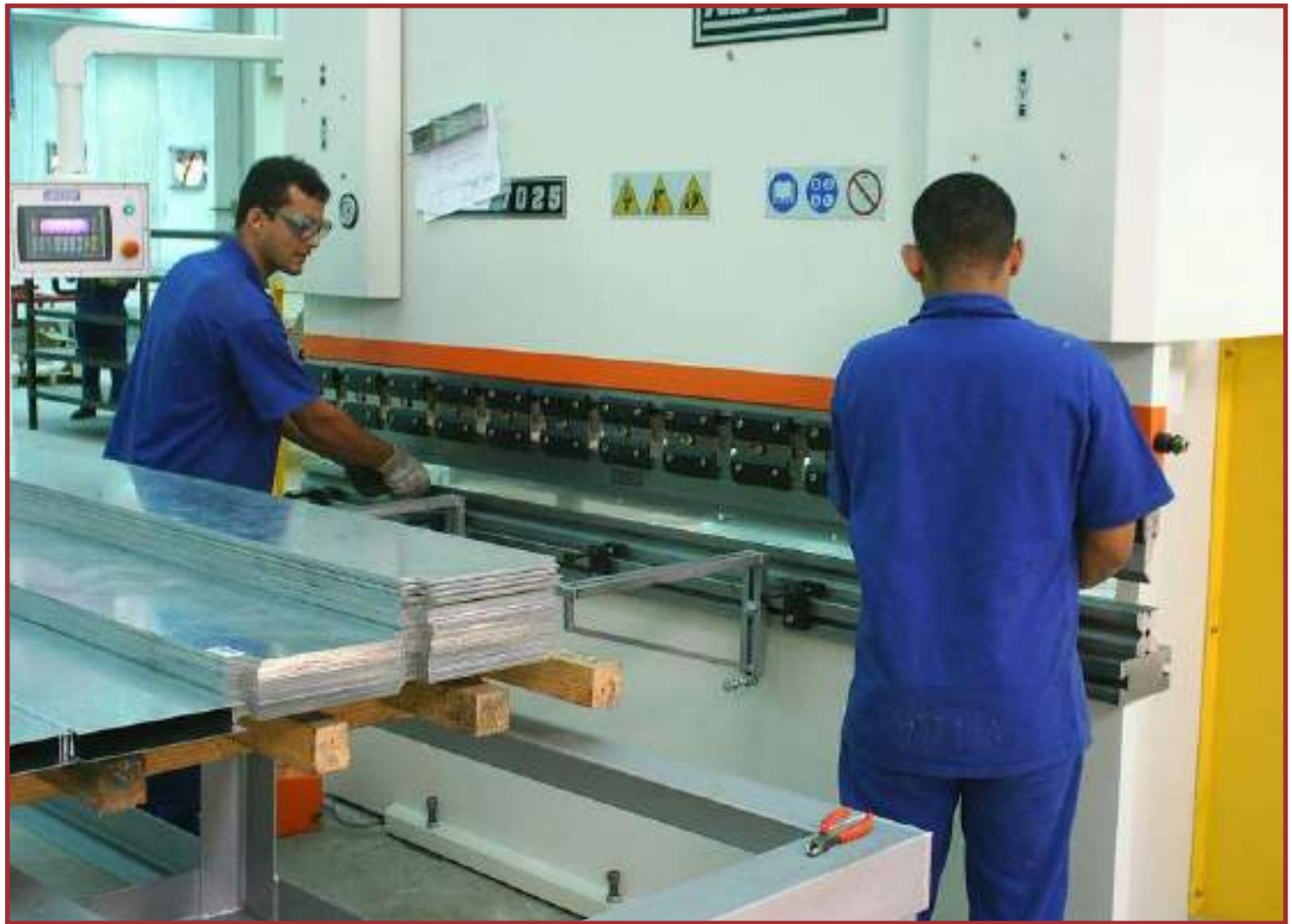
Atualmente, 672 empresas estão inscritas no Prodeic

Além dessas vantagens, as empresas que utilizam os recintos alfandegados para