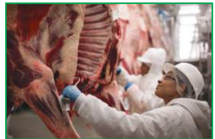
Escassez contribuiu para a queda