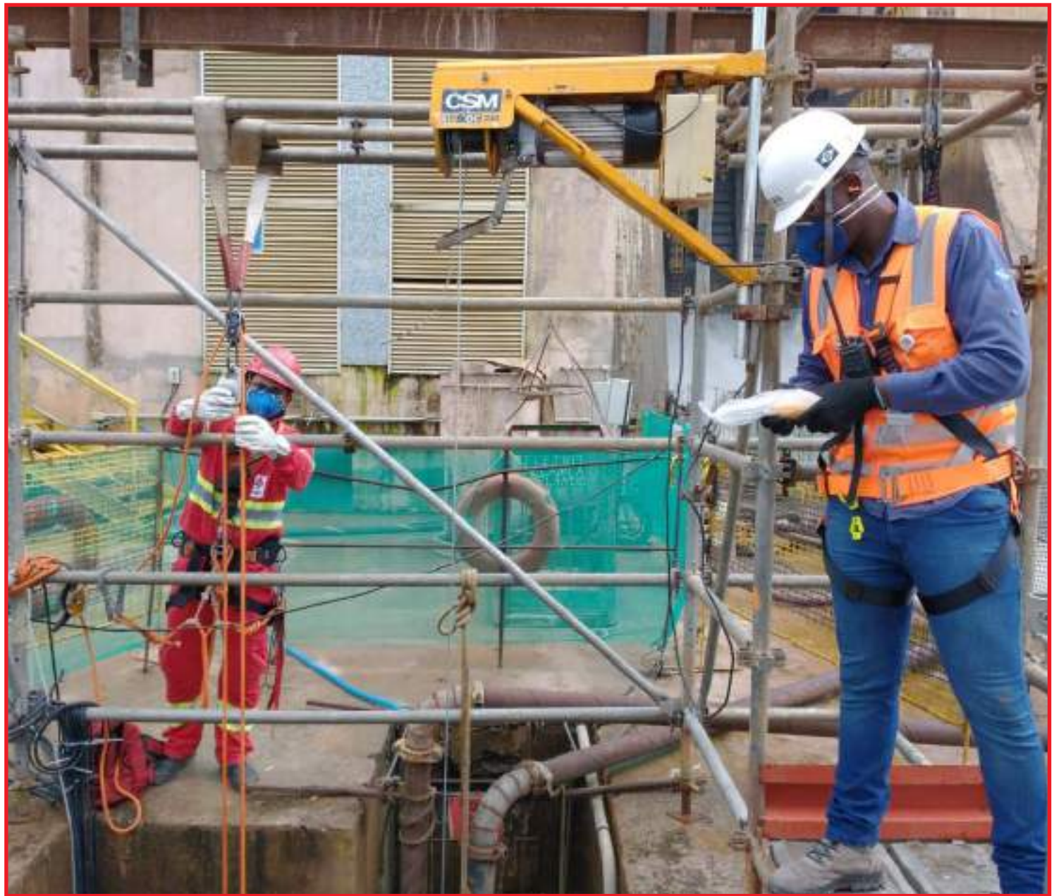
UHE Sinop está há mais de 365 dias de operação sem afastamento de funcionários

Apesar dos indicadores evidenciarem redução signi-