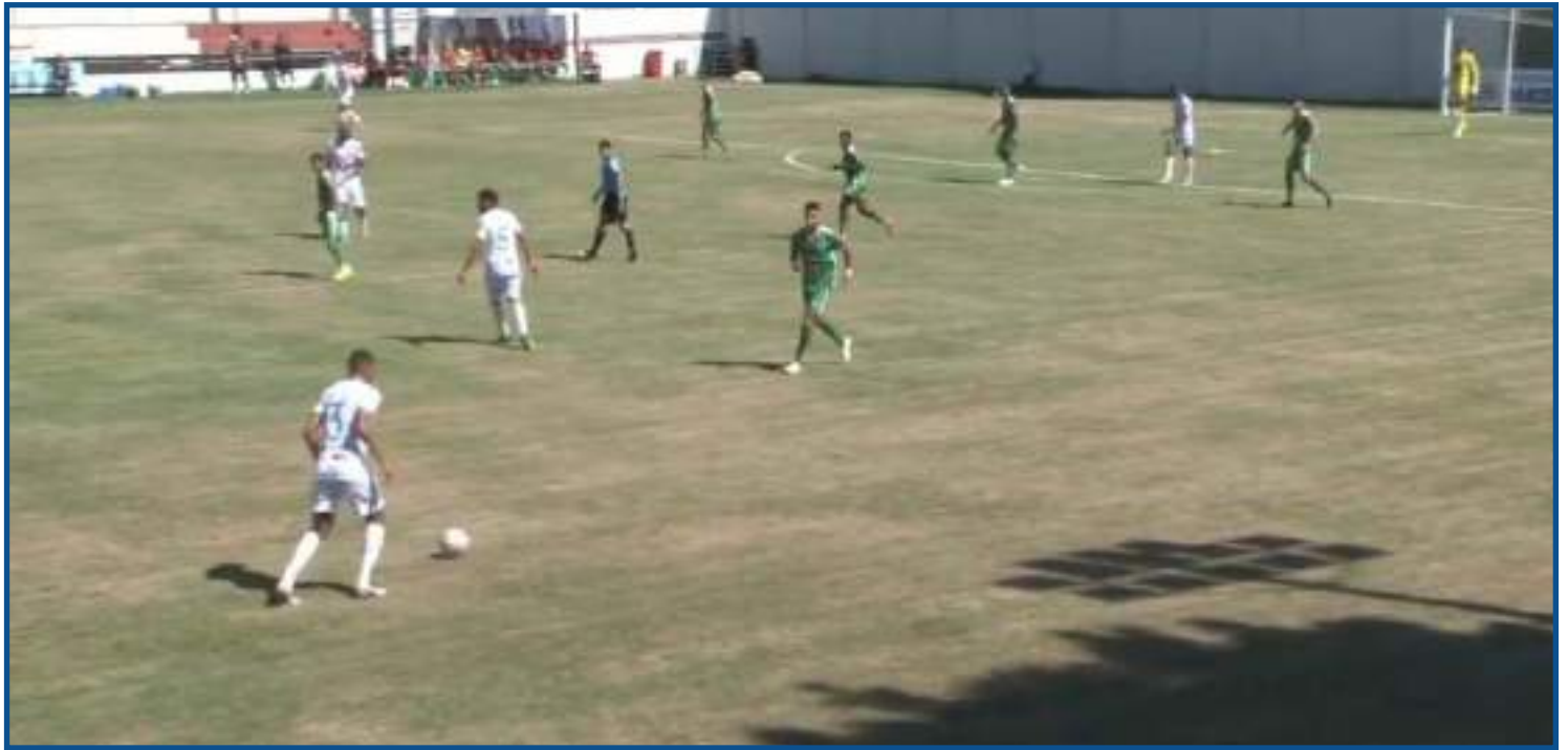
Operário venceu Sorriso após 0 a 0 no tempo normal

Com o persistente em-pate, a decisão da vaga foi