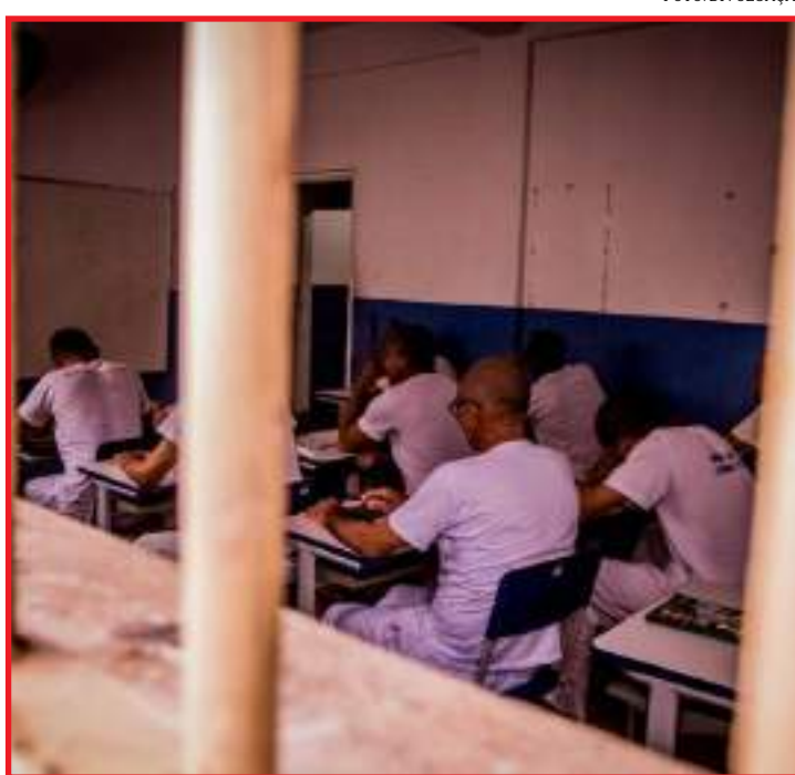
Eles fizeram o Enem para pessoas privadas de liberdade

Em alguns casos, os estudantes colocam a tor-