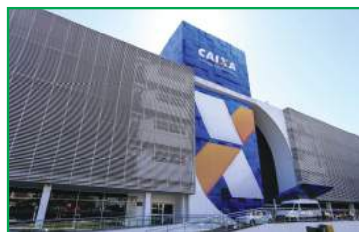
Inscritos no Bolsa Família com NIS final 9 podem sacar benefício

O auxílio será pago apenas a quem recebia o benefício em dezembro de 2020. Também é necessário cumprir outros requisitos para ter direito à nova rodada.