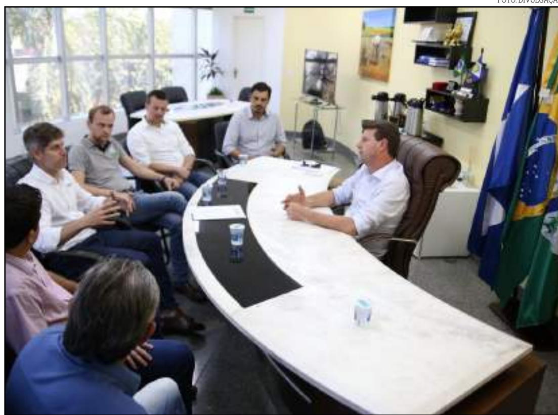
Do total da divisão, R$ 30 milhões serão para a Sorriso

"Recebemos total apoio do município para a implantação de nossos negócios no Brasil, e escolhemos esta região justamente para ficar próximos dos produtores, que têm interesse em adquirir nossos produtos, de alta tecnologia, e querem ter proximidade na hora dos atendimentos", comentou Galli.