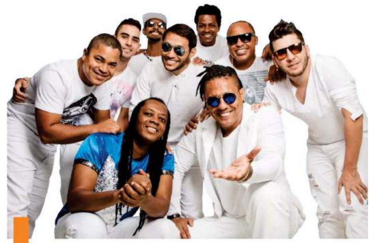
"O Araketu, o Araketu quando toca, deixa todo mundo pulando que nem pipoca...", quem nunca cantou ou pulou ao som dessa música, não é mesmo?! Dia 07 de abril é hora de pular bastante com o a banda nacional que estará em Sinop, para contagiar os convidados da FeijoVip 2019. A banda faz parte das três atrações nacionais que iremos trazer para os vip's de Sinop e região.