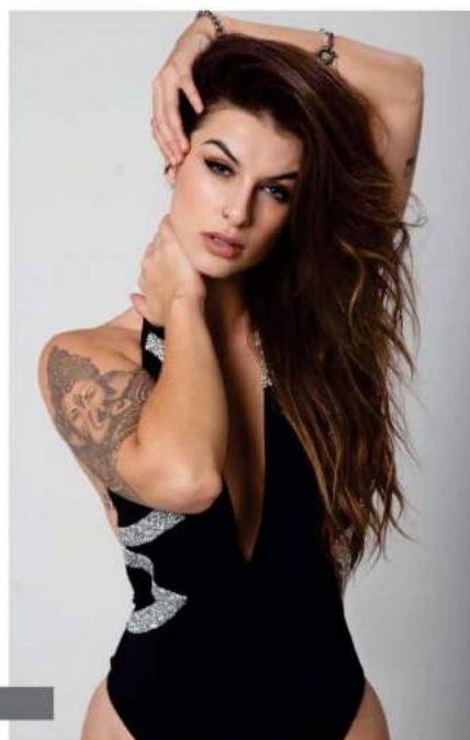
Para a alegria da galera e principalmente dos marmajos de plantão, a 8ª FeijoVip, terá a ilustre presença da DJ Bárbara Labres, considerada a mais gata do Brasil. Então já sabe, terá muito funk pelas pick-ups, da famosa!