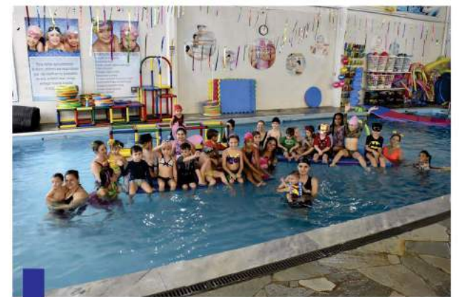
Falando em Carnaval, o pessoal da Acqua & Cia está em ritmo de folia com os alunos. Estivemos por lá, fotografando tudo e todos e olha esse registro de toda a turma...