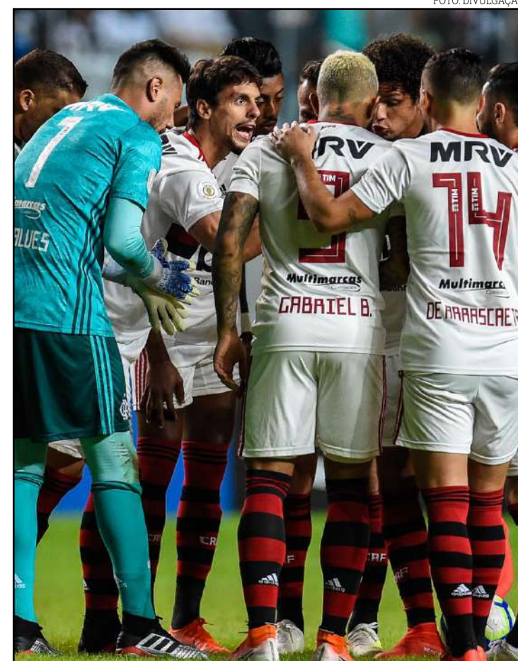
Flamengo tem desempenho aquém no último mês

No domingo, a equipe enfrenta o Atlético, no Maracanã. Na rodada seguinte, mais um jogo em casa, contra o Fortaleza. Uma boa chance para o Fla tentar retomar o caminho das vitórias.