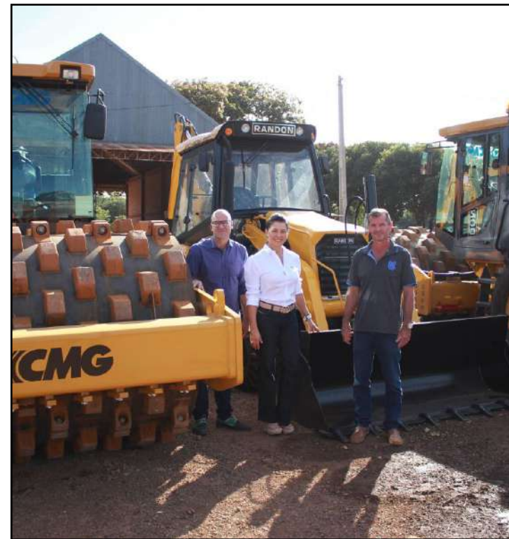
Maquinários tiveram custo de R$ 900 mil