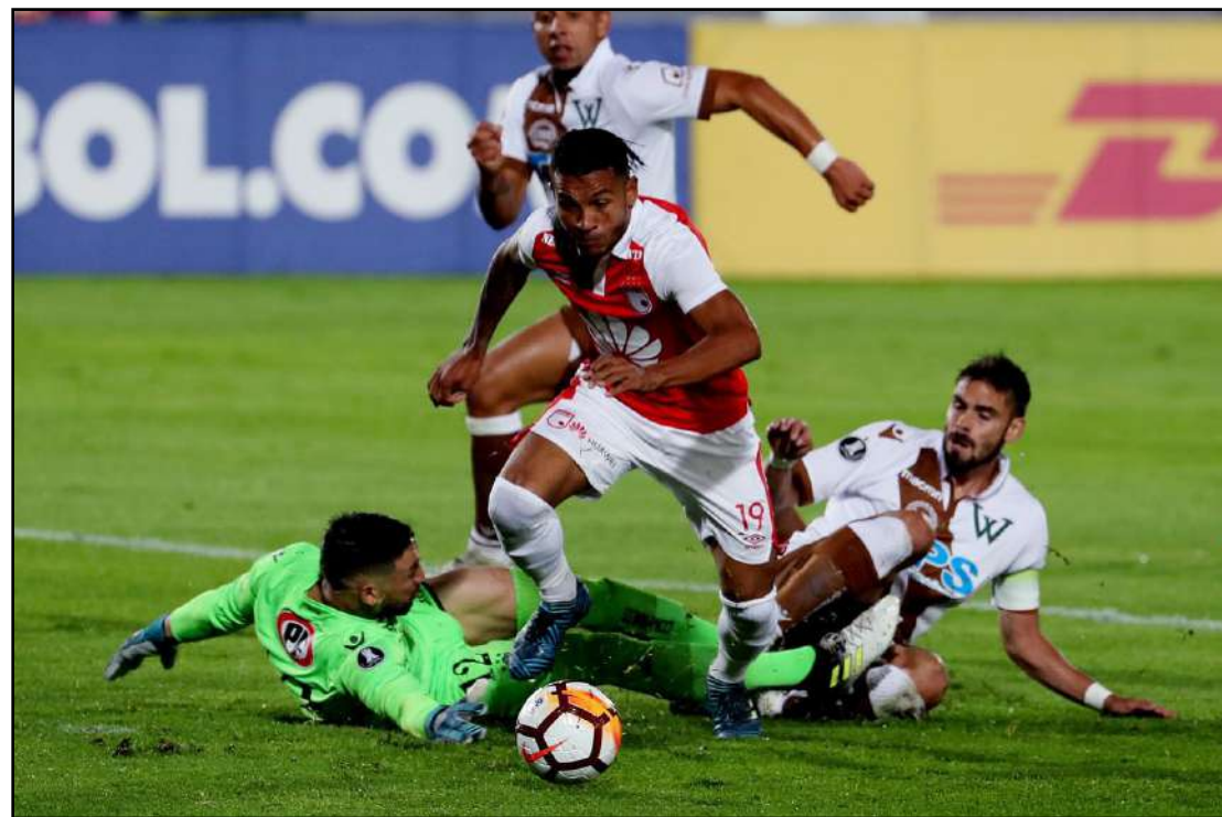
Mesmo na 2ª divisão chilena, Santiago Wanderers disputou a Libertadores

A AFA cita preocupação especificamente com a situação do Tigre, que, apesar de rebaixado, venceu por 5 a 0 o Atlético Tucumán no jogo