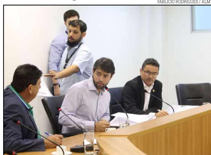
FABÍCIO RODRIGUES / ALMT

"Às vezes nos empolgamos com determinadas promoções e acabamos por não olhar a data de vencimento