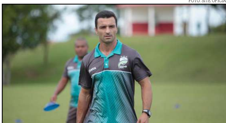
LEC somou apenas dois pontos em quatro jogos na Série C

"Tivemos oportunidades, no segundo tempo também tivemos boas chances, a gente queria uma vitória, estamos brigando na parte de baixo, mas agora temos dois jogos em casa e esse ponto será valioso. Temos uma possibilidade de subir na tabela, mas não é de qualquer