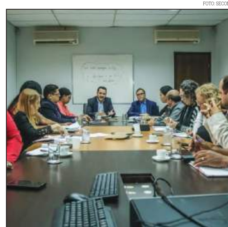
Secretários explicaram que reajuste geraria impacto de mais de R$ 200 milhões