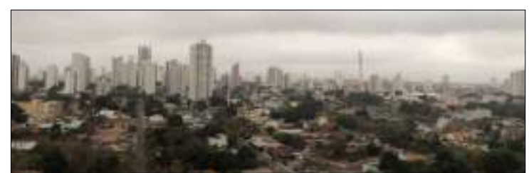
Esfriou em Cuiabá

do ar na capital aumentou e se manteve entre 64% e 82%. Tangará da Serra, a 242 km de Cuiabá, registrou 15°C durante a madrugada e amanheceu geroando. A previsão é de 16°C de mínima e 21°C de máxima. No sábado, a mínima prevista é de 13°C e a máxima de 26°C. Em Rondonópolis, a 218 km de Cuiabá, a máxima prevista é de 25°C e mínima de 15°C para esta sexta-feira. No fim de semana, os termômetros devem registrar mínima de 15°C e máxima de 29°C, já em Sinop, a 503 km de Cuiabá, o dia começou com poucas nuvens e com a temperatura em 20°C. A previsão para o sábado é mínima de 18°C e máxima de 32°C.