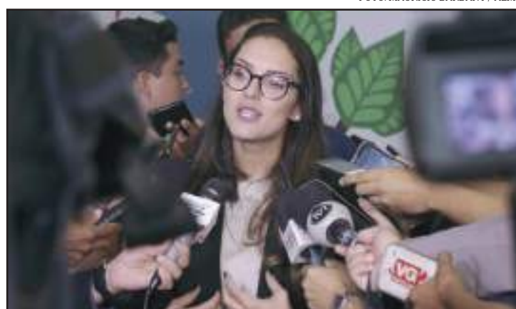
Presidente da ALMT cria comissão especial

"A preocupação é não perder recursos financeiros das edificações que já começaram ou que já tenham os recursos aportados. Hoje, tem obras paralisadas de