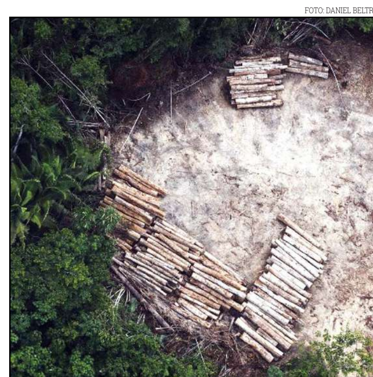
32% do desmatamento da área da Amazônia Legal foi feito em território mato-grossense

O horário de atendimento da unidade é das 7h às 11h e das 13h às 15h e não há necessidade do paciente chegarem com antecedência ao local. Outras três UBSs também estão em processo de construção: nos bairros Menino Jesus, Jardim Montreal e Safira.