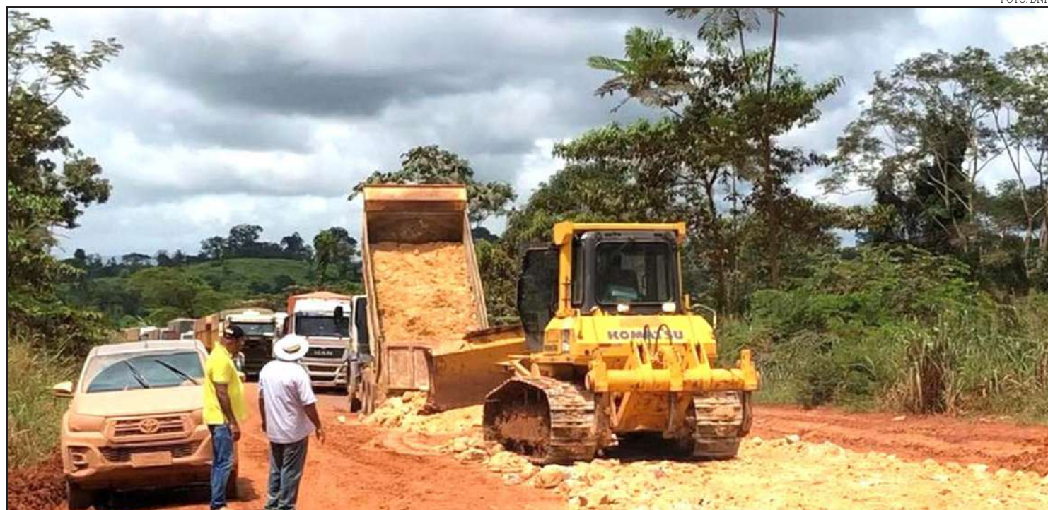
DNIT, Exército e PRF seguem trabalho para liberação da BR-163/PA

O volume de caminhões tornou-se mais intenso na região neste ano. Além disso, o trecho tem sido degradado pelas intensas chuvas, o que dificulta a manutenção da