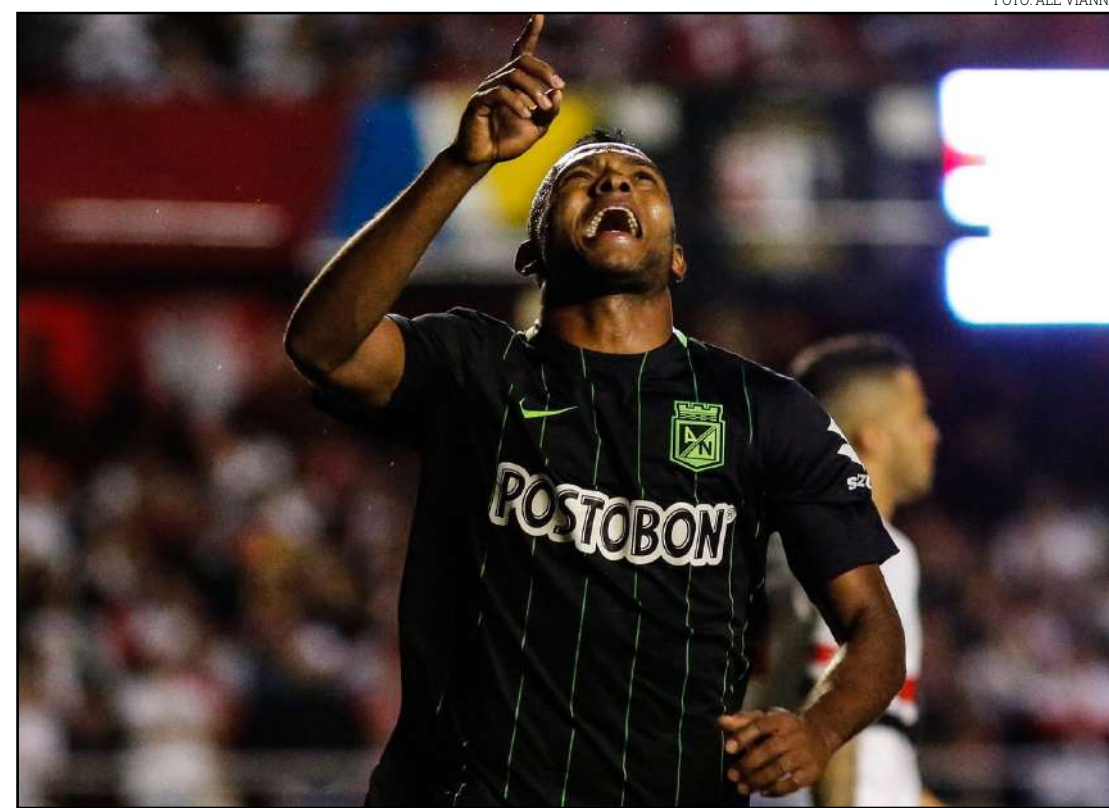
Borja, em jogo contra o São Paulo pela semifinal da Libertadores

Outro time que tem enfrentado seguidas elimina-