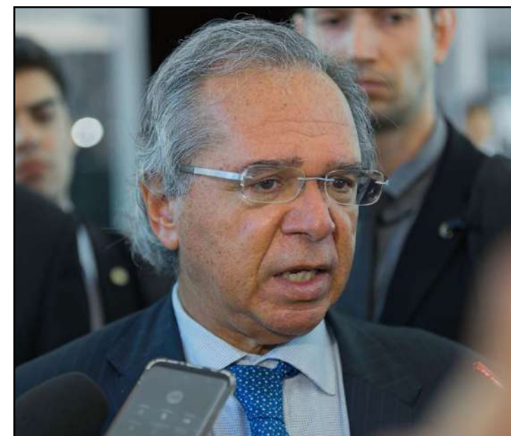
Ministro da Economia, Paulo Guedes acena com possibilidade