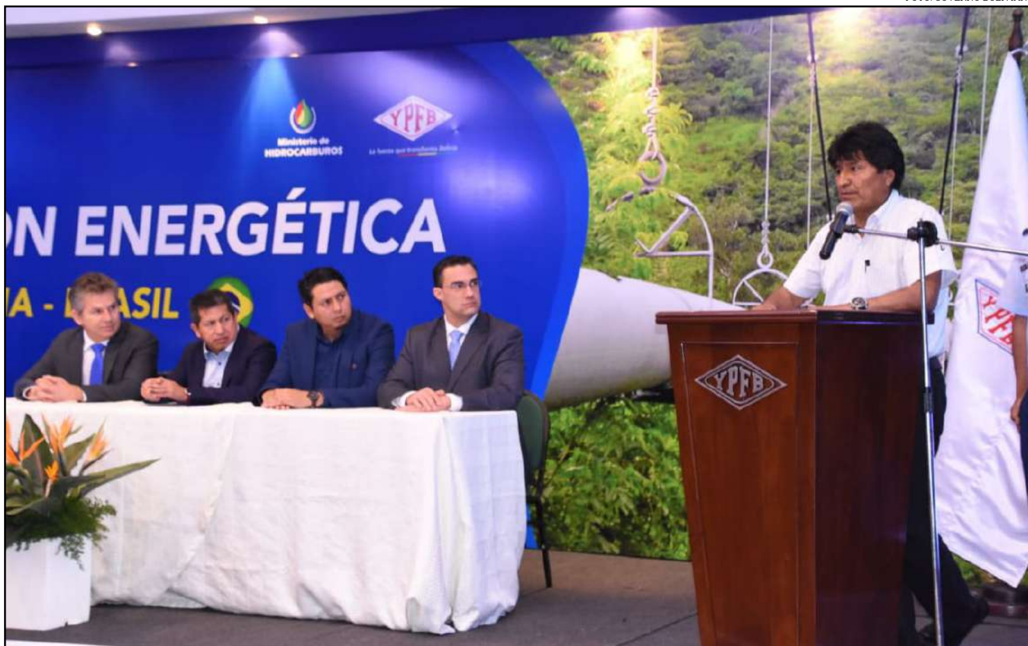
Mauro Mendes se reuniu com o presidente da Bolívia