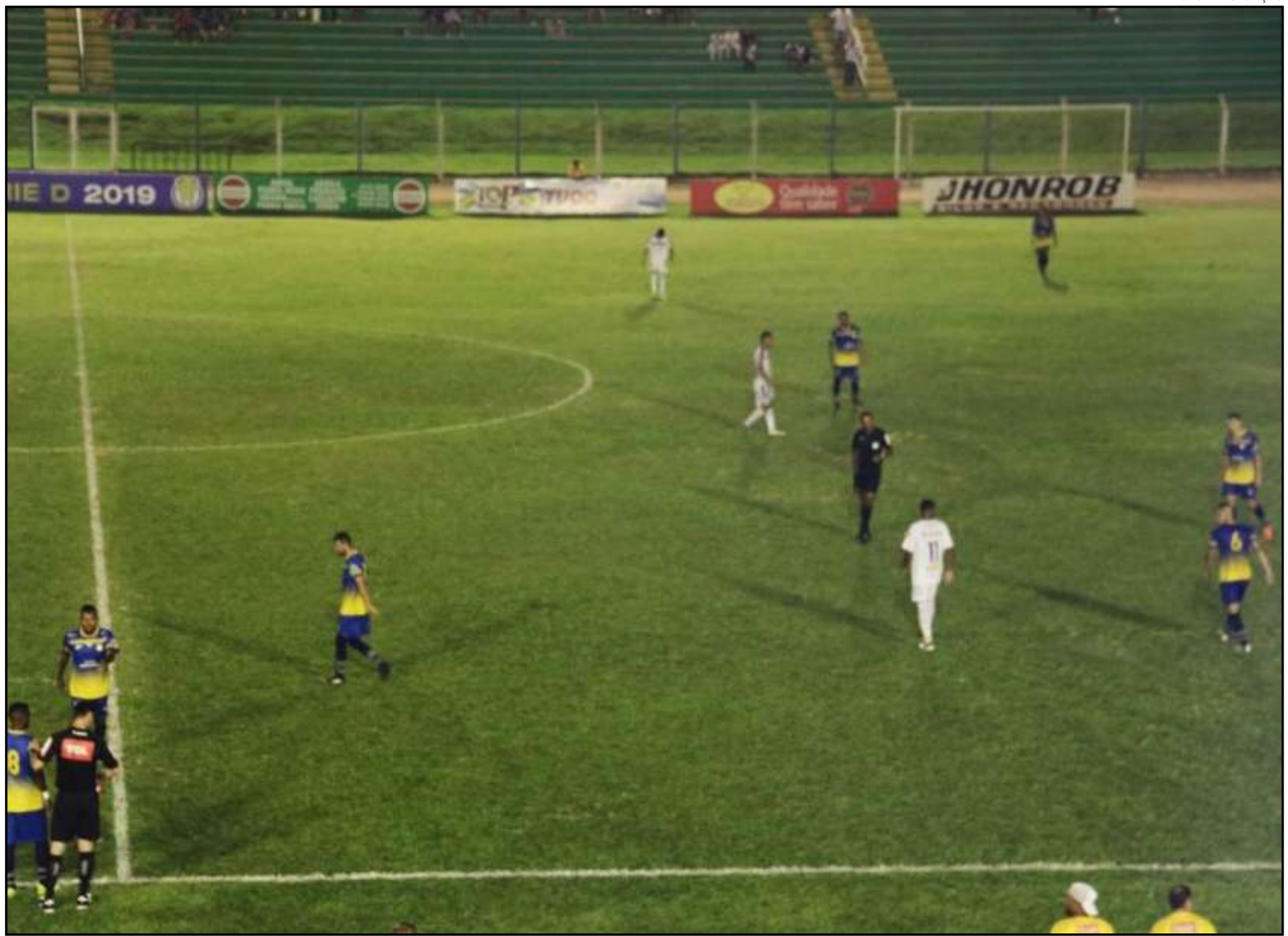
Sinop e Palmas empataram; Galo se complicou na classificação

Em outra chave bastante equilibrada, a A11, o União Rondonópolis recebe no Estádio Lutherio Lopes o Operário-MS. O Colorado está na segunda posição com 6 pontos, atrás do Patrocinense-MG, que tem 7, e na frente de Anapolina-GO e do Operário, que têm 5 e 4 pontos, respectivamente. Se vencer, o União praticamente assegura sua classificação. O jogo será neste sábado, às 18h.