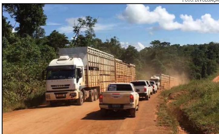
Uma das principais rodovias do noroeste de Mato Grosso

No encerramento da visita eles foram a um empreendimento mineral localizado no município antes de retornarem à Cuiabá.