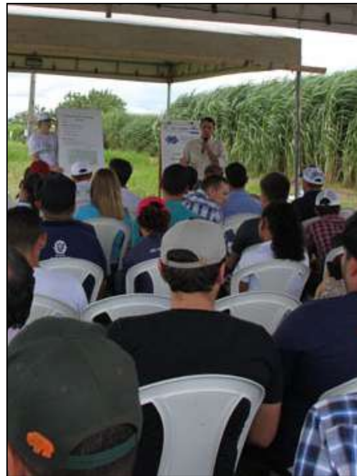
Evento acontece neste sábado, em Serra Nova Dourada

veiculares; equipe de fisioterapeutas; corte de cabelo; entre outros.