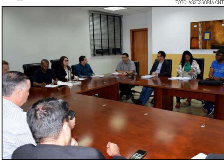
Tema foi debatido com representantes de várias instituições

Sobre as acusações do Sindicato dos Trabalhadores do Ensino Público (Sintep)