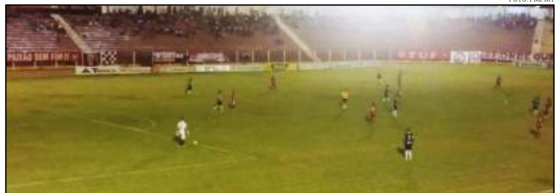
União cedeu empate em casa e se complicou na chave All