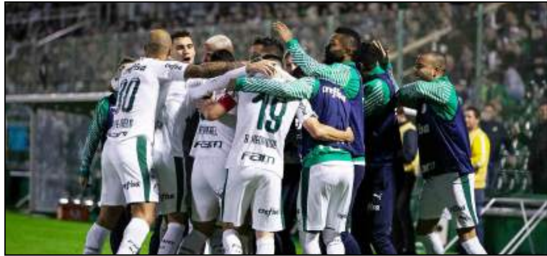
Palmeiras venceu a Chapecoense por 2 a 1