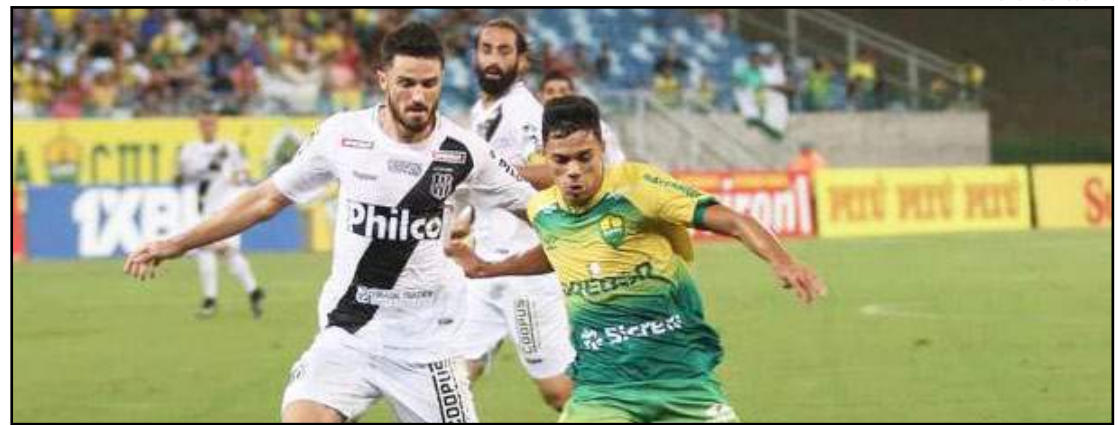
Cuiabá perdeu de virada para a Ponte Preta em plena Arena Pantanal

Com 7 pontos, a equipe vai precisar vencer obrigatoriamente na próxima rodada (o jogo entre Patrocinense e Anapolina, adversários diretos pela vaga, foi realizado ontem e encerrou após o fechamento desta edição).