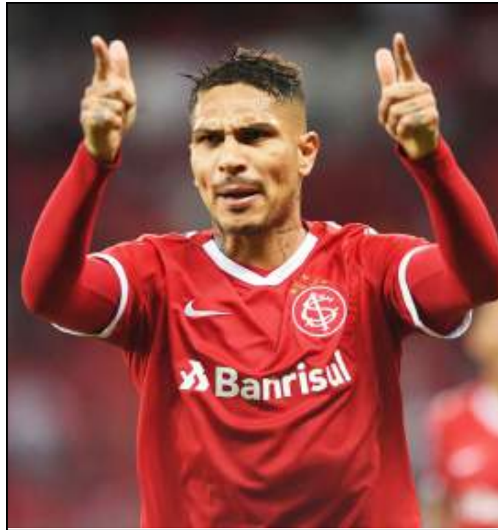
Guerrero comemora gol que iniciou vitória colorada no domingo