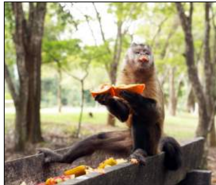
É preciso resistir à vontade de alimentar os animais