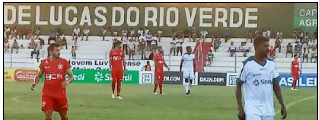
O Luverdense ficou novamente no empate jogando em casa