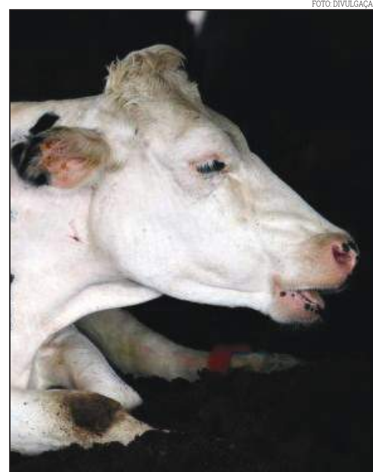
Suspensão atende a acordo sanitário entre Brasil e China

De acordo com a pasta, mesmo com o caso registrado em Mato Grosso, a classificação de risco para a doença não será alterada e continuará como “insignificante” no país. No começo de maio, uma comitiva brasileira, chefiada pela ministra da Agricultura, Tereza Cristina, visitou uma série de países asiáticos. Um dos principais objetivos da visita era a liberação de frigoríficos brasileiros para exportar para a China. Segundo a Associação Brasileira das Indústrias Exportadoras de Carne (Abiec), a China é principal mercado para carne do Brasil em faturamento e o segundo em volume (atrás somente de Hong Kong). Em 2018, os embarques de carne bovina para a China somaram 322,4 mil toneladas e US$ 1,49 bilhão. Os números representam alta de 52,54% e 60,04%, respectivamente, em relação a 2017.