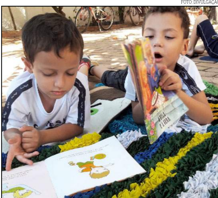
Leitura sob as árvores: alternativa às salas de aula