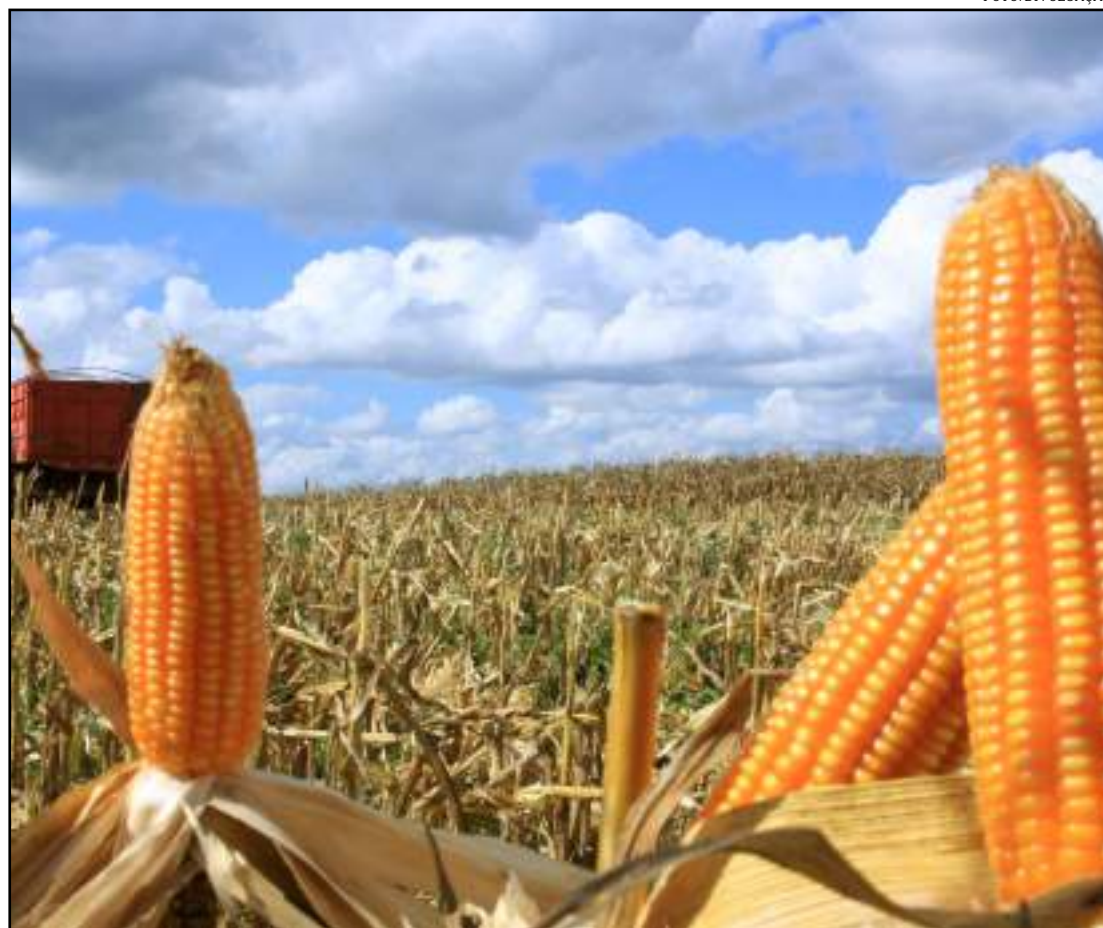
Em uma fazenda, colheita começou 20 dias antes do prazo previsto

“Porque tem o problema da gripe suína africana. O rebanho de suínos da China é de pouco mais de 400 milhões de animais e nós trabalhamos com fontes de mais de 100 milhões de cabeças sacrificadas. Isso significa um plantel que vai consumir 25% menos”, diz Sartori.