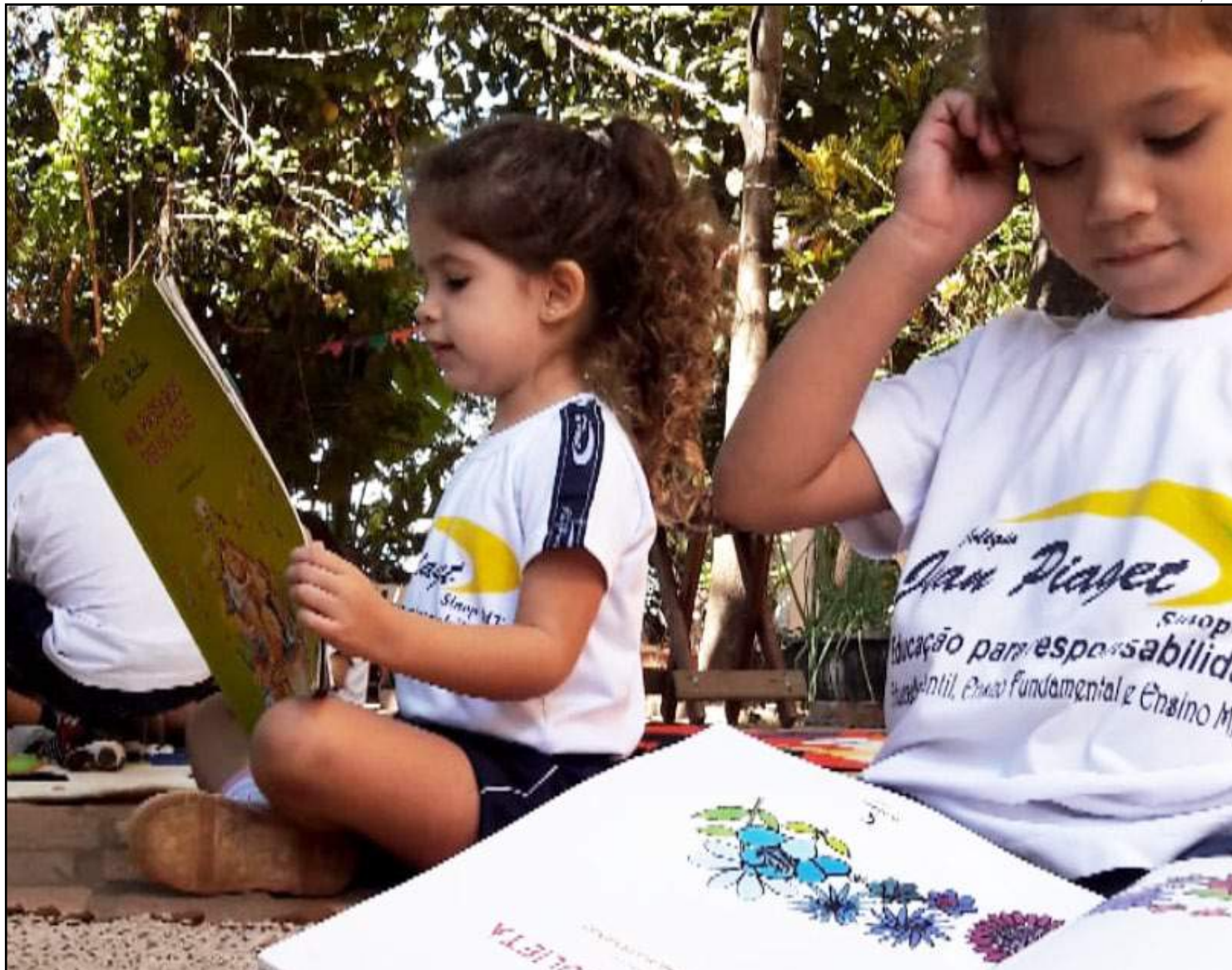
Educação para os menores dentro das salas de aula, mas também fora delas

SC – O conceito partiu das experiências que adquiri e por que passei. Eu trabalhei no governo de São Paulo (gestão da Luíza Erundina), na equipe do professor Paulo Freire. Ele, inclusive, foi uma espécie de chefe durante determinado período, enquanto ele foi secretário de Educação. Posteriormente, com a saída dele, o Mário Sérgio Cortella foi o meu chefe. Então se desenvolveram políticas públicas de educação e eu participei de todas essas, participei da construção de programas em escolas importantes de formação humana, como o Colégio Santa Maria. A minha conceituação veio com