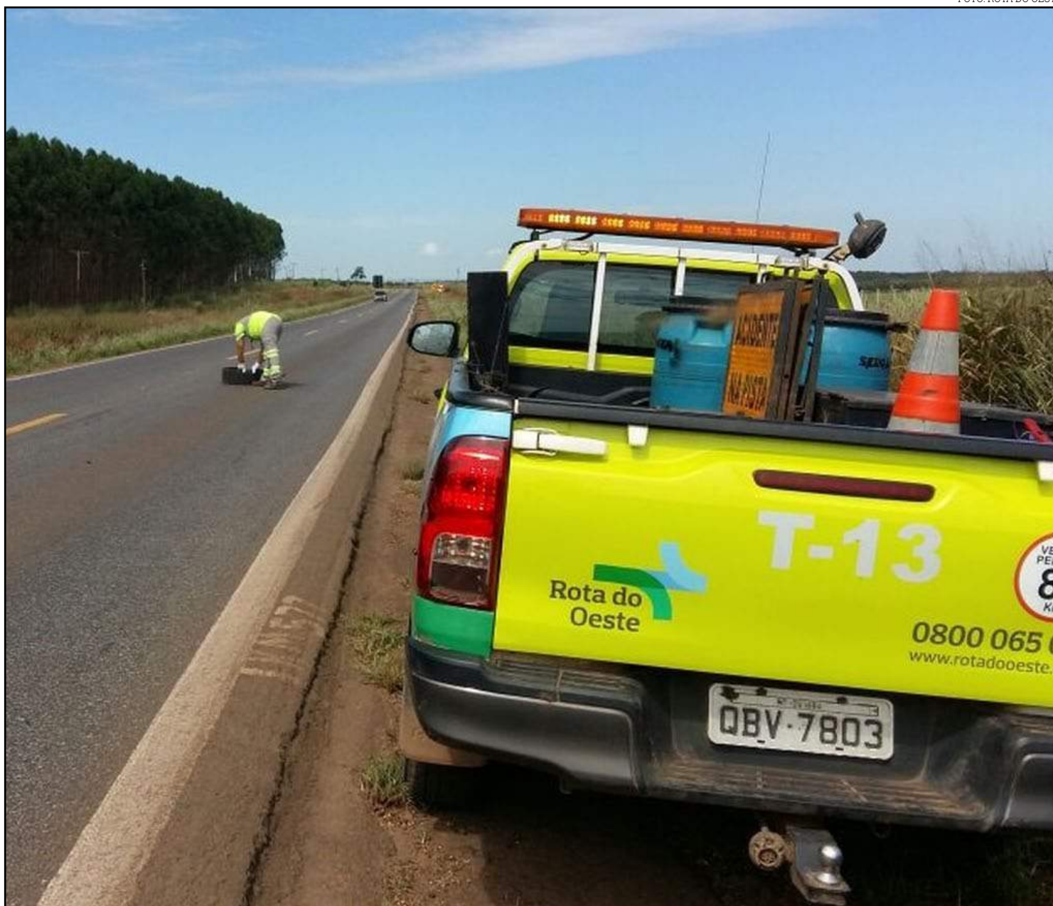
Concessionária atua na destinação adequada, protegendo o meio ambiente

A prática de "atirar do veículo ou abandonar na via objetos ou substâncias" é considerada infração de trânsito média, com previsão de multa, de acordo com o artigo 172 do Código Nacional de Trânsito (CTB). Do total de resíduos removidos, 68,6% são reciclados ou coprocessados. O principal material recolhido da rodovia são os pneumáticos, que somam 312 toneladas encaminhadas para a empresa Ecopneu para serem trituradas e, posteriormente, usadas como combustível para caldeiras. Também passam pelo coprocessamento os materiais contaminados (que tiveram algum contato com produto químico, como embalagens de agrotóxicos, de Arla, estopas embebidas em combustível, etc). Para destinação adequada das 28,7 toneladas de materiais recicláveis, a Rota do Oeste mantém convênio com a Colecta (Rondonópolis), Reciclate (Várzea Grande), Luverdense Ambiental (Lucas do Rio Verde), Recicla Sorriso (Sorriso) e Reciclo (Sinop). O restante, apontado como não reciclável, é encaminhado para aterros sanitários licenciados. Para coletar e armazenar os materiais descartados no trecho sob concessão da BR-163, a Rota do Oeste conta com 18 veículos de inspeção, 18 guinchos e locais apropriados nas 18 bases de atendimento.