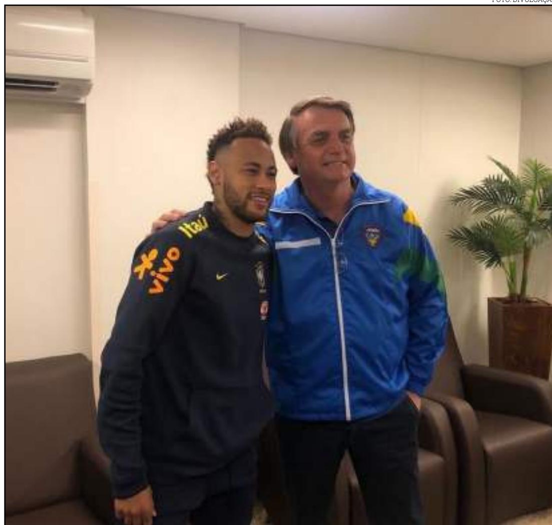
Bolsonaro abraça Neymar e posa para foto depois de contusão

Neymar saiu de campo logo após o gol de Richarlison. Sentiu dores ao tentar o drible no meio de campo. O atacante caiu no chão, se levantou e tentou seguir em campo. Ele se agachou, pediu para não receber a bola até sair para o banco de reservas, onde chorou momentos antes de descer para o vestiário.