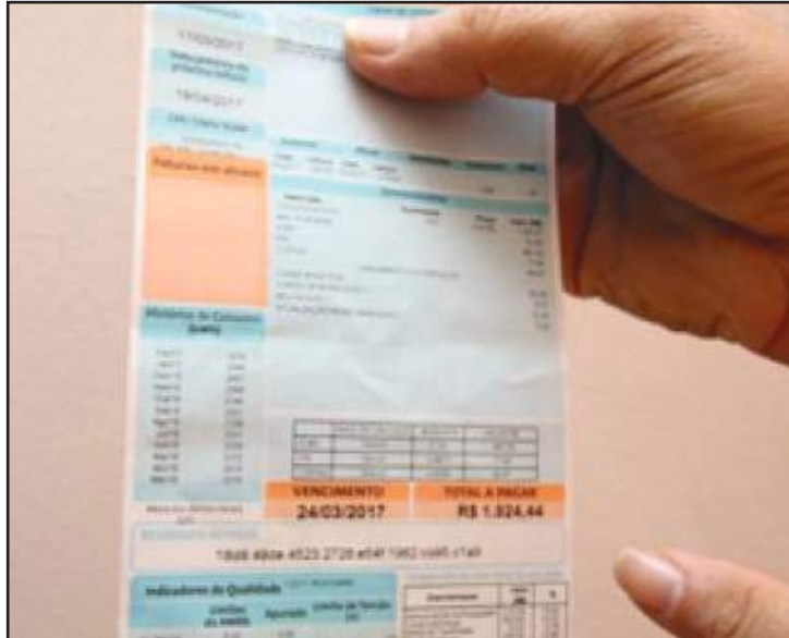
De maio/2018 a maio/2019, setor foi alvo de 27% das reclamações

As famílias com renda mensal de até três salários e que possuam membros portadores de doença ou deficiência, cujo tratamento