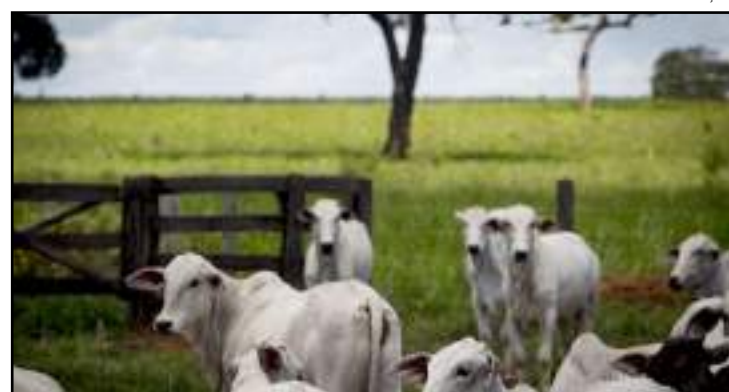
Semana passada, arrobas do boi e da vaca gorda seguiram em queda

Semana passada, em Mato Grosso, as arrobas do