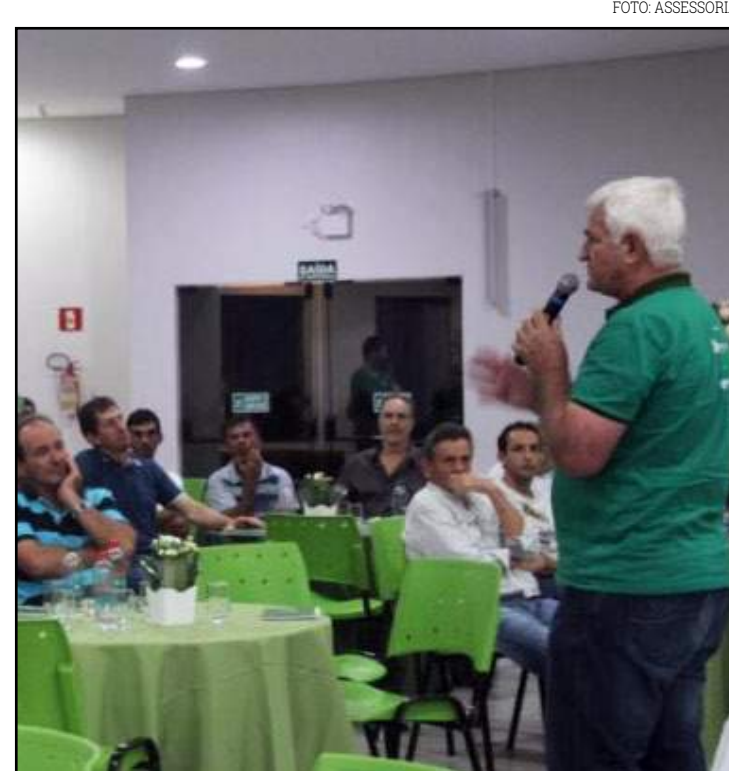
Evento contempla 24 municípios em Mato Grosso