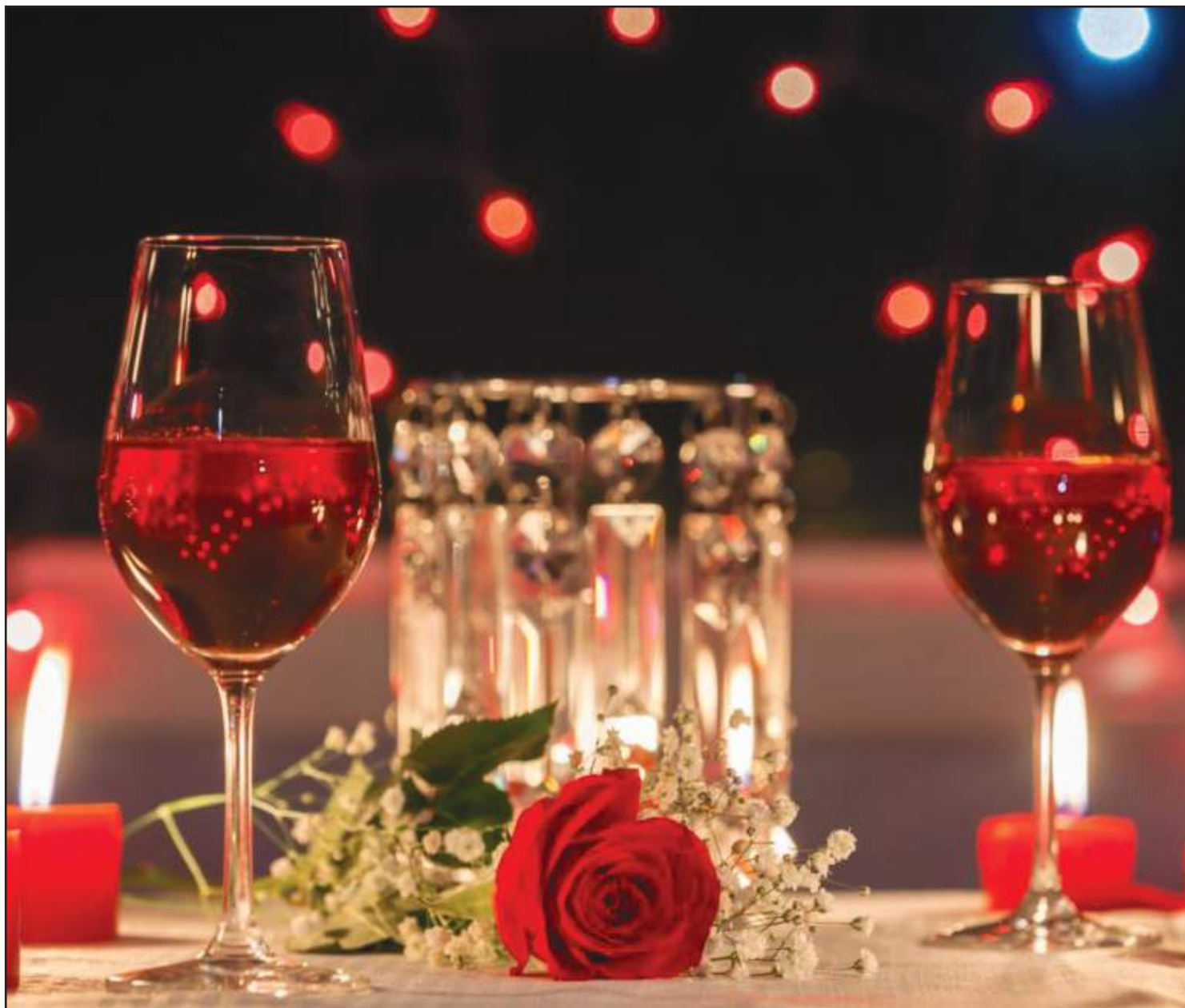
Jantar romântico está entre as principais opções para a data