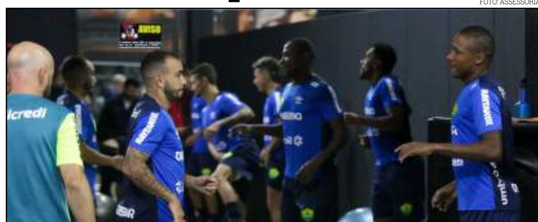
Equipe treinou ontem em academia de Londrina