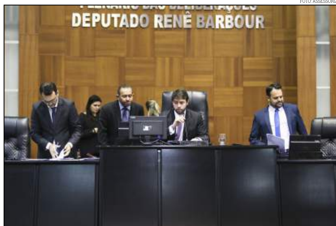
Plenário na Assembleia Legislativa de MT

A maior parte dos deputados estaduais deverão ter em torno de R$ 2,5 milhões e 2,78 milhões em emendas liberadas. No dia 2 de abril de 2019, os deputados de