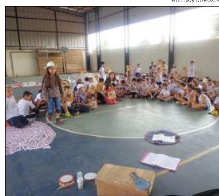
Atividades lúdicas e diferenciadas são a marca do Colégio

de minha própria prática, dos meus estudos e dos estudos que eu fazia coletivamente com os colegas, com as oportunidades educacionais que eu tive. Foram muito ricas.