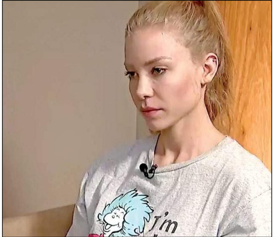
Modelo concedeu entrevista ao SBT

"Vi o que falam de mim. Tem muitos trabalhos para fazer do que todo esse escândalo. Eu não iria me expor dessa forma para arranjar dinheiro dele"