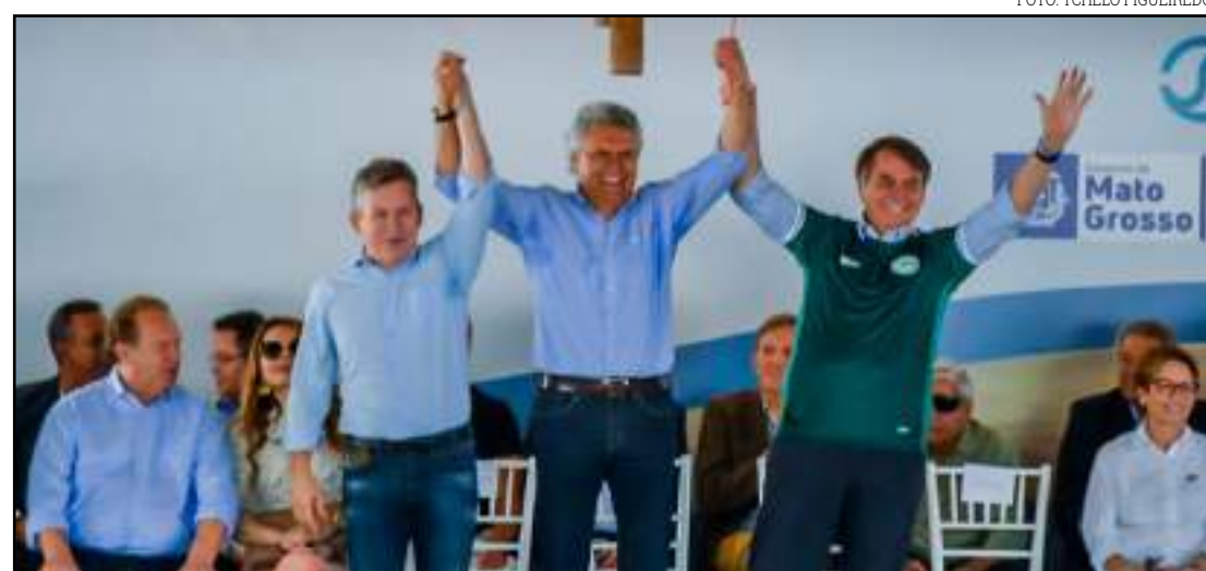
Mendes, Caiado e Bolsonaro "Juntos pelo Araguaia"

Ao todo, são R$ 400 milhões anuais que Mato