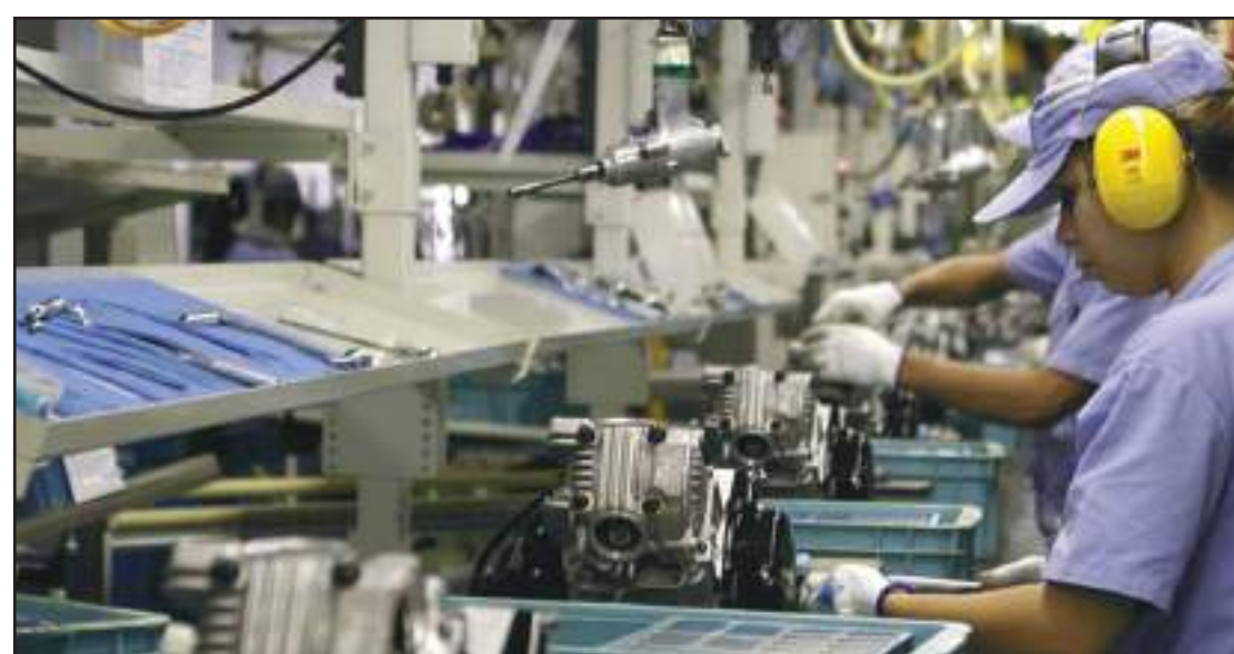
Entre as 26 atividades pesquisadas, 20 tiveram alta

Na passagem de março para abril, houve alta em três das quatro grandes categorias econômicas, com destaque para os bens de consumo duráveis (3,4%). Também tiveram crescimento os bens de capital, isto é, as máquinas e equipamentos (2,9%), e os bens de consumo semi