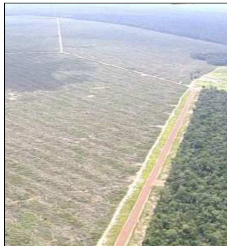
São 4.431 queimadas registradas até o dia 3 de junho