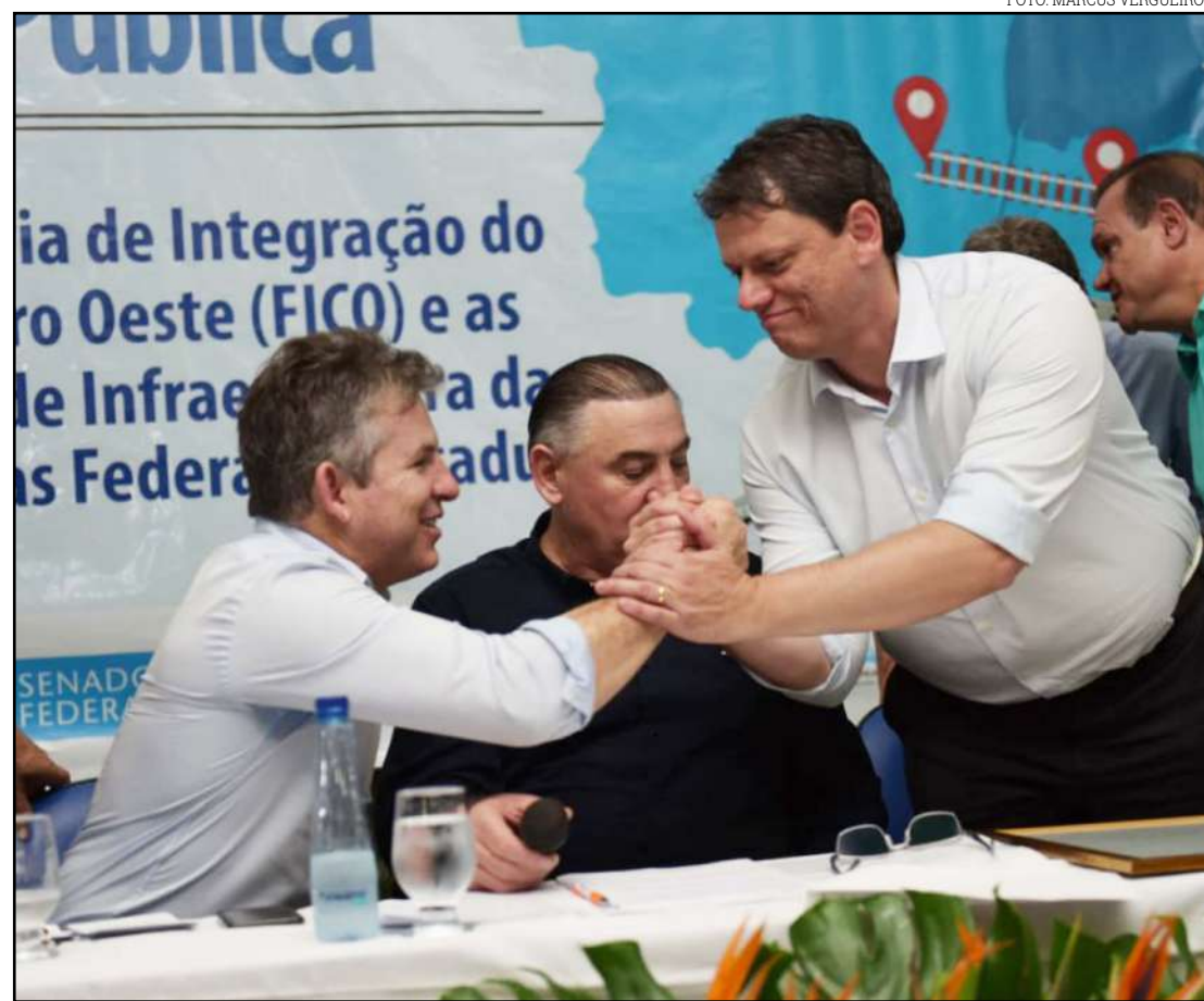
Encontro entre Mauro Mendes e ministro da Infraestrutura

Mendes acrescentou ainda que a ampliação da malha ferroviária e a viabilização de rodovias importantes para Mato Grosso, vão promover uma "revolução" em todas as regiões do estado. Na audiência pública sobre a implantação da Ferrovia de Integração Centro-Oeste (Fico), realizada na cidade de Água Boa, o governador apresentou números que confirmam o potencial de Mato Grosso para ajudar no crescimento econômico do Brasil, caso o governo federal realize os investimentos nas rodovias federais, como também, na malha ferroviária.