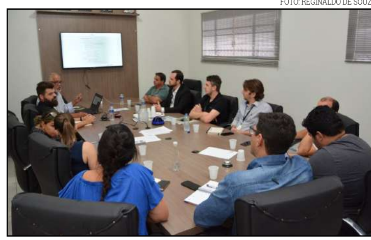
Reunião de apresentação do estudo sobre o transporte coletivo

Quem também participou da reunião foi a diretoria do IFMT, já a ideia é de a prefeitura viabilizar o transporte gratuito para eles. Atualmente, 40 ônibus circulam somente no perímetro urbano do município para fazer o transporte de 3.171 alunos (dados de 2018).