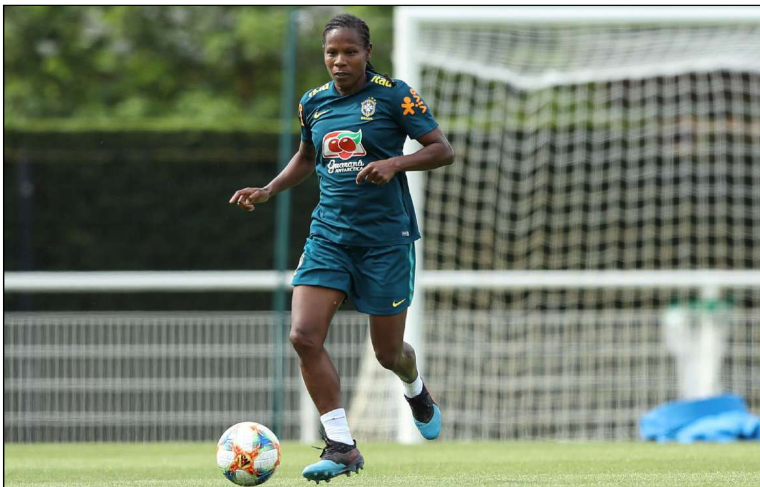
Formiga precisou até de injeção para superar dores

O jogo entre Brasil e Itália será nesta terça-feira (18). As italianas já estão classificadas com duas vitórias e foram a surpresa do grupo C.