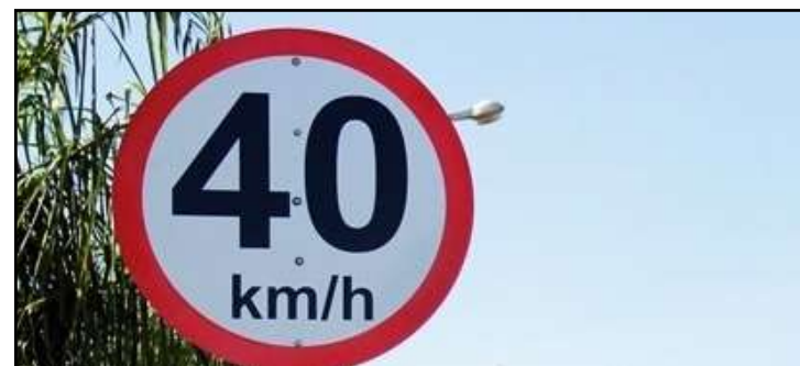
Decreto entrou em vigor na data da publicação, 12 de junho