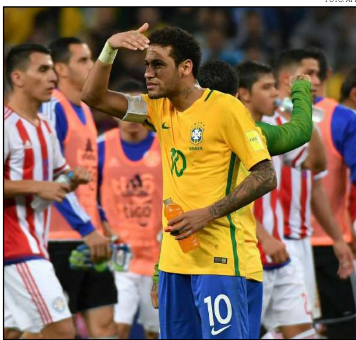
Última vez que as duas seleções se enfrentaram foi em 2017

O último confronto entre Brasil e Paraguai foi em março de 2017, pela 14ª rodada das eliminatórias para a Copa do Mundo de 2018. A Seleção venceu por 3 a 0 a partida, disputada na Arena Corinthians.