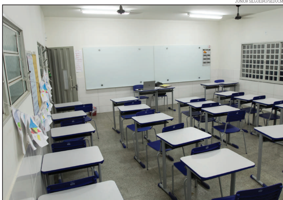
Paralisação está completando um mês