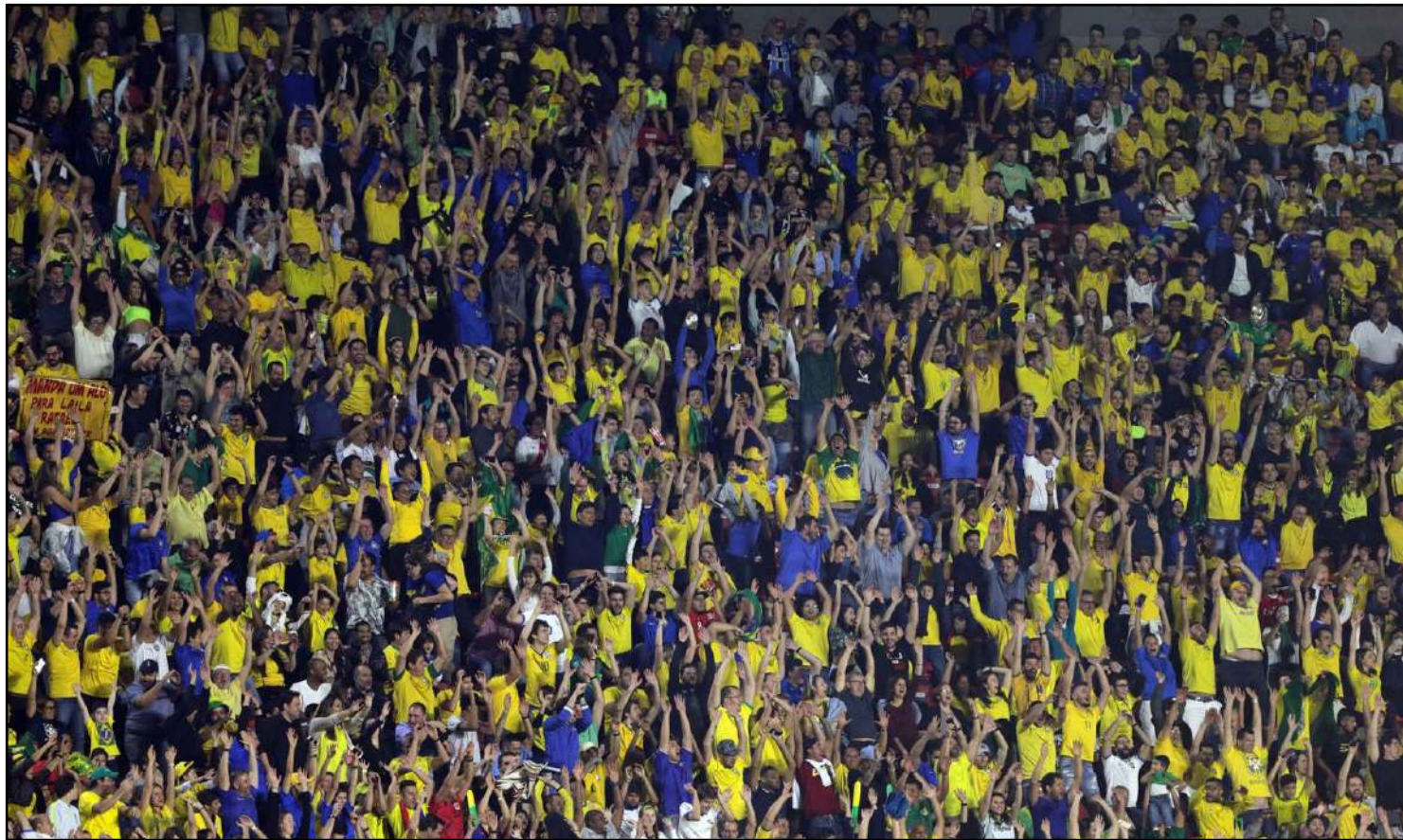
Torcida pagou caro para assistir estreia da seleção no Morumbi

O jogo que definiu o adversário do Brasil nas quartas de final foi o menos privilegiado pelo público. Equador x Japão foi a partida com menor público (2.106 pagantes) e menor arrecadação (R$ 301.525).