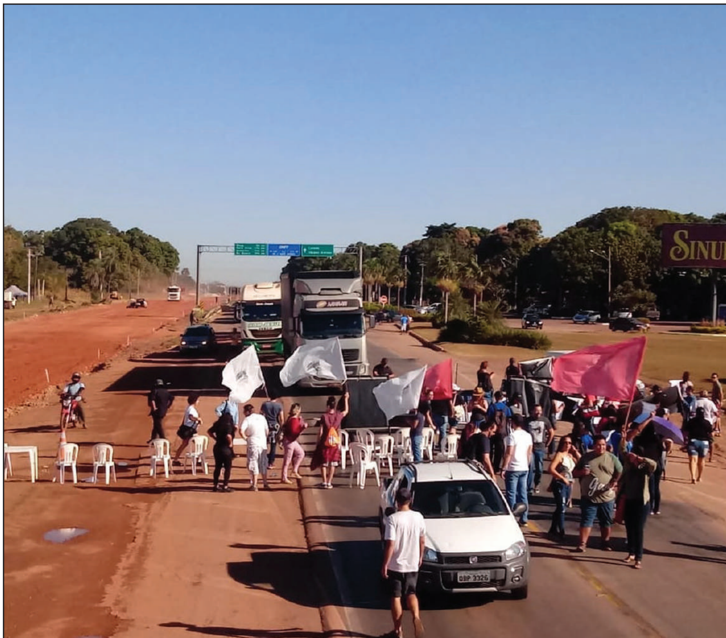
Em greve há quase um mês, servidores bloqueiam rodovia em Cuiabá

De acordo com a página do Sintep no Facebook, ainda estão previstas para os próximos dias outras manifestações. Nesta quarta (26), acampamento itinerante em frente à Assembleia Legislativa; na quinta, a parada é na frente do Palácio do Governo; na sexta, grande ato da educação no Tribunal Regional do Trabalho (TRT). No sábado, haverá uma reunião da direção ampliada, na sede central do Sintep, e à noite comemoração pelo aniversário do sindicato. Na próxima segunda (1º), assembleia geral com ato público na Escola Estadual Presidente Médici.