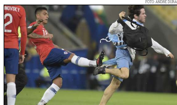
Jara chuta torcedor que invadiu o gramado do Maracanã em Chile x Uruguai

Sobre a partida, Rueda conta que gostou do que viu, principalmente por causa das mudanças forçadas que precisou fazer. Vidal não foi a campo por causa de um desconforto físico, enquanto Isla e Beausejour, por exemplo, estavam pendurados com dois cartões amarelos. “Foi uma partida muito equilibrada. Tínhamos consciência da qualidade do rival que tínhamos pela frente. Mas o Chile fez um bom jogo, mostramos caráter, ordem. Foi uma atuação muito positiva”, disse o comandante.