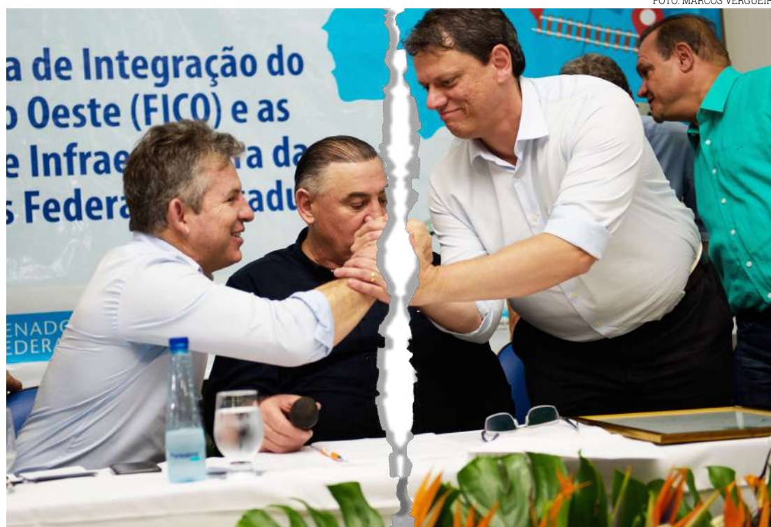
Visita do ministro a Mato Grosso: corte de recursos

Na ocasião, foi lançado o edital para obras de dre-