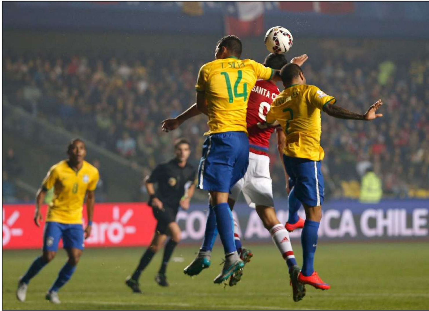
Thiago Silva cometeu pênalti trapalhado contra o Paraguai em 2015

A escalação que Dunga escolheu para o jogo teve: Jefferson; Daniel Alves, Thiago Silva, Miranda e Filipe Luís; Fernandinho, Elias e Philippe Coutinho; Willian, Robinho e Roberto Firmino. Marquinhos e Casemiro, presentes no atual elenco de Tite, ficaram no banco de reservas daquele embate.