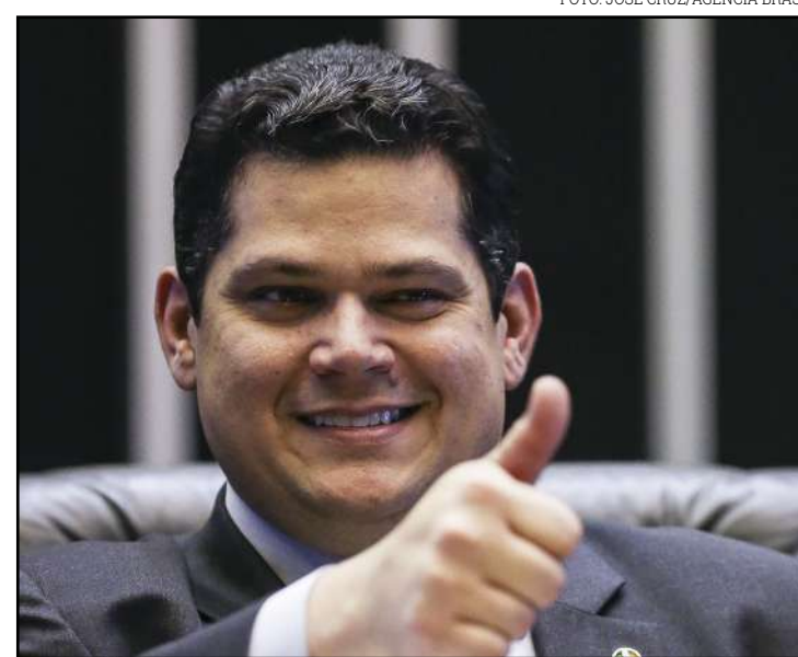
Alcolumbre falou grosso contra o governo