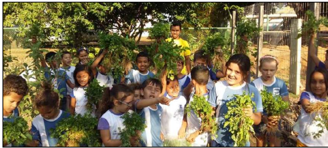
Crianças participam do projeto orientadas por alunos de Agronomia