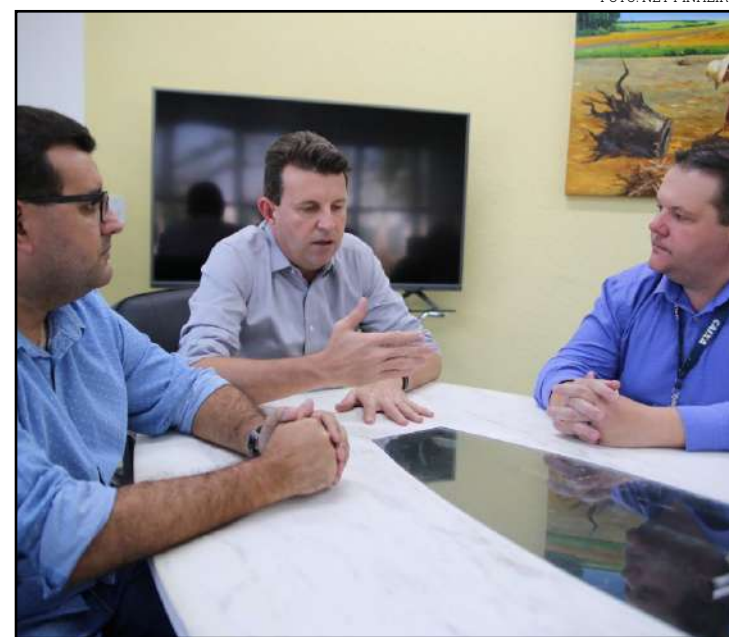
Moradia é um direito a dignidade