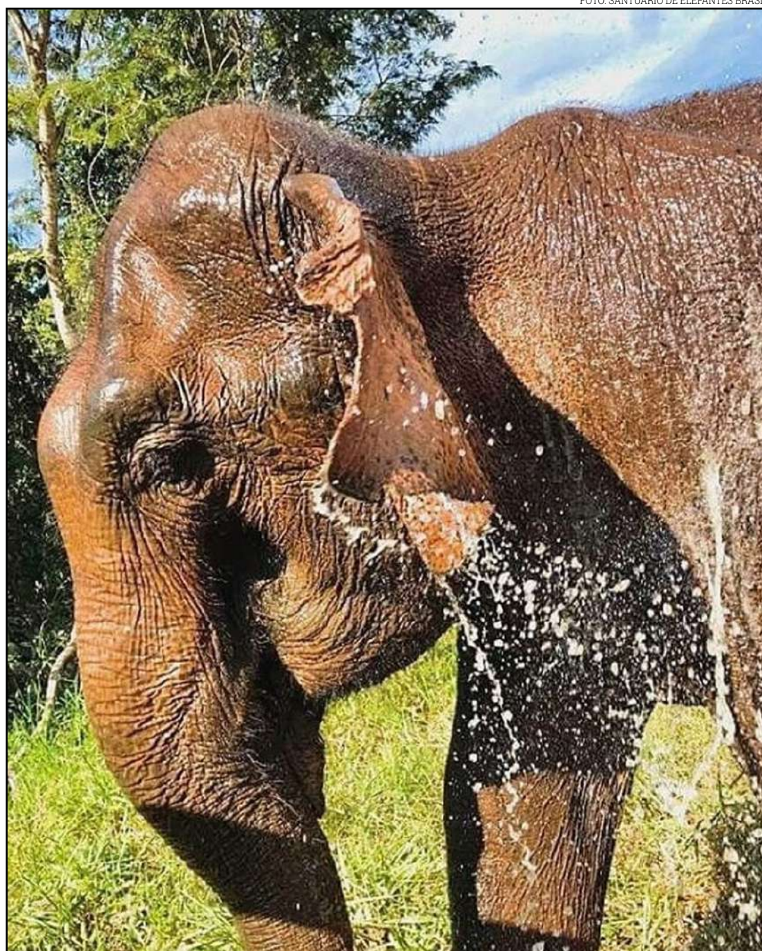
Animal foi encontrado preso e morreu de forma silenciosa

No sítio, entretanto, foram constatadas irregularidades. As duas ficavam acorrentadas, sem poderem ter contato uma com a outra, e não tinham um lugar com sombra para ficar. Foi nessa época que o Ministério Público entrou em contato com a ONG Internacional Global Sanctuary for Elephants (Santuário Global dos Elefantes) para que pudesse acolher Guida e Maia.