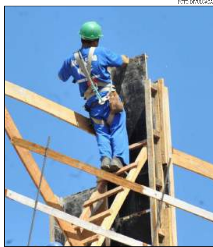
Confiança dos empresários melhorou em junho

O indicador de expectativa de nível de atividade ficou em 54,4 pontos, e os índices de expectativas de novos empreendimentos e serviços, de compra de insumos e matérias-primas e de número de empregados ficaram em 52,9 pontos.