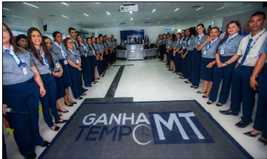
Unidade Ganha Tempo em Sinop

A Representação Externa foi proposta no Tribunal de Contas pela empresa Shopping do Cidadão Serviços e Informática S/A, que ficou em segundo lugar na licitação. A empresa fez um pedido de medida cautelar solicitando a anulação do contrato porque, além da falta de do-