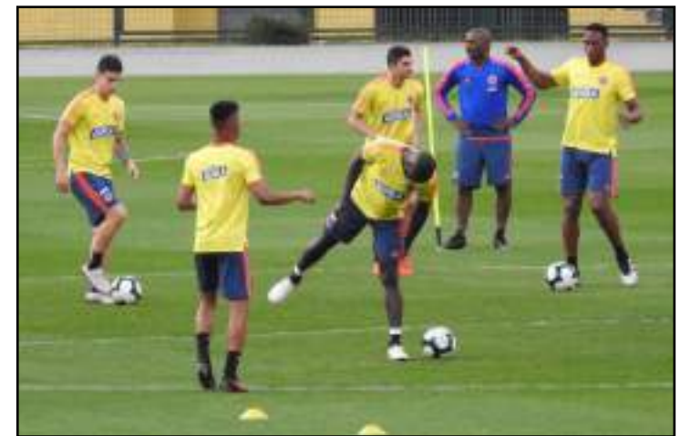
Colômbia treinou no Pacaembu