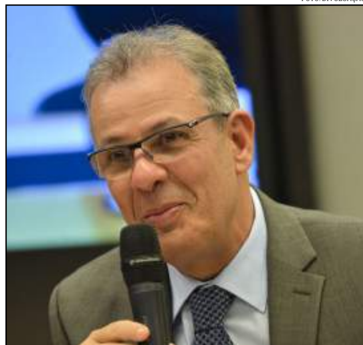
Preço encarece custos de produção, diz ministro

De acordo com o ministro, entre os objetivos do novo modelo para o mercado de gás natural estão, além de garantir o abastecimento nacional, ampliar os investi-