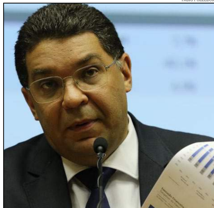
O secretário do Tesouro Nacional, Mansueto Almeida

A média de países emergentes, como o Brasil, é de uma dívida de cerca de 50% do PIB, conforme dados informados pelo Tesouro Nacional. "Se o Brasil fosse um país desenvolvido, uma dívida bruta de quase 80% do PIB não seria tão preocupan-