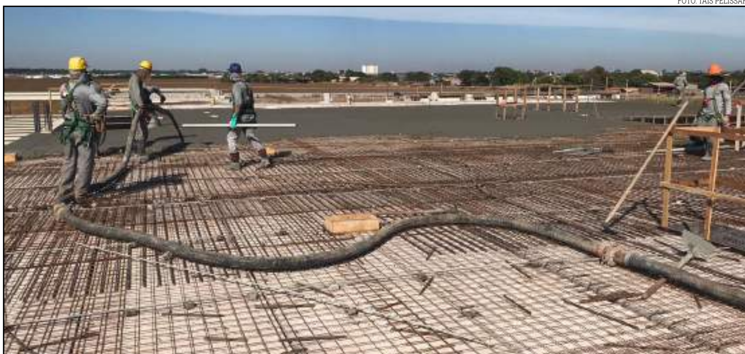
Concretagem já está sendo executada no Shopping Sinop

dito que isso seja um ponto fraco para o comércio local”, afirma.