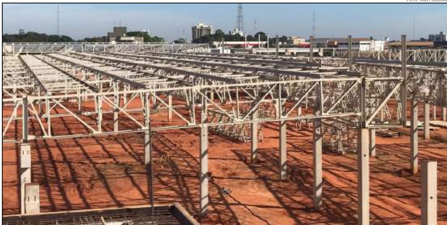
Estrutura está sendo erguida em região privilegiada