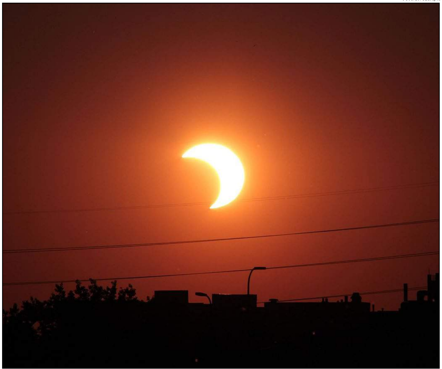
Sinop, Cuiabá e Lucas do Rio Verde verão eclipse parcial do sol

Água Boa: 17h09 às 18h12; Alta Floresta: 16h11 às 18h35; Aripuanã: às 16h04 às 17h39; Barra do Garças: 17h06 às 18h09; Cuiabá: das 16h01 às 17h25; Guarantã do Norte: 16h13 às 17h30; Juína: 16h03 às 17h41; Lucas do Rio Verde: 16h05 às 18h28; Rondonópolis: 16h01 às 17h17; Sinop: 16h08 às 17h29; V.B.S. Trindade: 15h56 às 17h41.