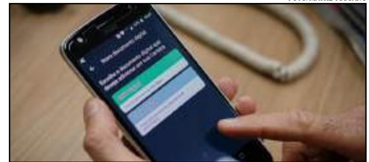
Documento tem a mesma validade jurídica do documento impresso