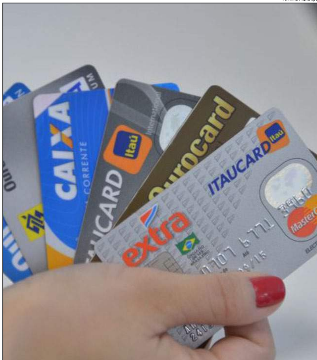
Brasileiro tem usado com frequência cartão para pagamentos

"O assunto cartão de crédito não é hoje um problema para a indústria do ponto de vista da inadimplência. Com o fato de ter uma carteira muito pequena de rotativo, a gente tem uma inadimplência muito menor", disse o presidente da Abecs.