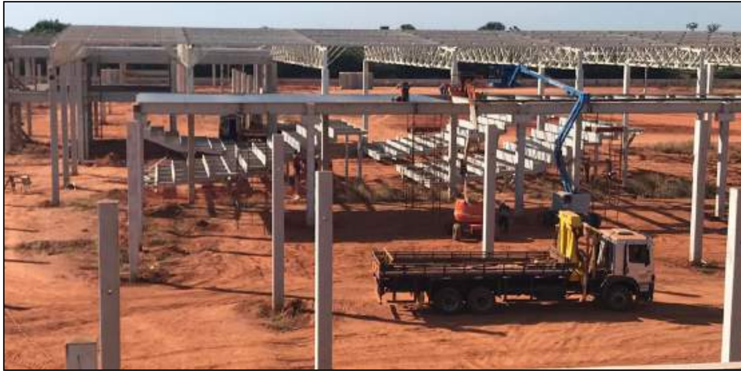
Shopping em construção: inauguração prevista para abril/2020

Sabe-se que o formato de atendimento também muda em termos de condições, pois a maioria dos shoppings é climatizada e existem promoções conjuntas. “Já no comércio local ainda tem lojas que não são climatizadas, só trabalham com promoções conjuntas realizadas por entidades. Acre-