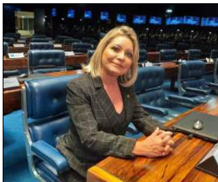
Senadora Selma Arruda – PSL-MT

A senadora teve mandato cassado por 7 votos a 0. Apesar da decisão, a congressista continua no cargo até que o caso seja julgado em definitivo pelo Tribunal Superior Eleitoral.