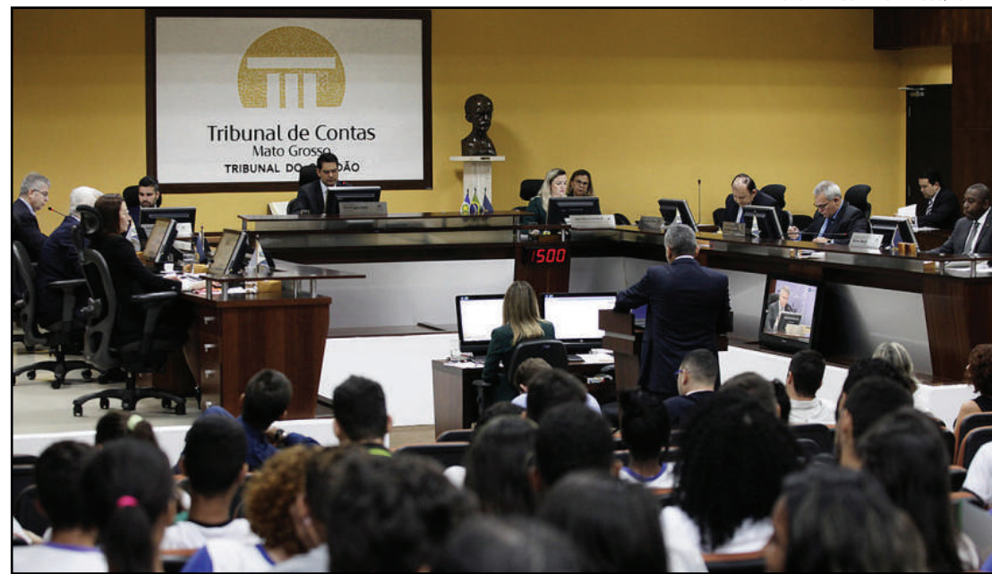
Espaço eletrônico tem gerado economia

São submetidos a julgamento no Plenário Virtual processos relativos a aposentadorias, pensões, reformas, reservas remuneradas e eventuais retificações desses atos previdenciários, consultas, homologações de julgamentos singulares para constituição de títulos exe-