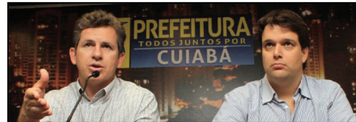
Mendes reagiu às declarações do presidente da Fiemt

A prefeitura de Peixoto de Azevedo estará repassando através da Secretaria Municipal de Educação o valor total de R$ 291.600,00 para o Transportes Escolar destes Acadêmicos que estudam em Colíder e Guarantã do Norte.