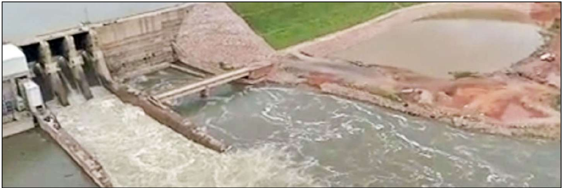
Usina hidrelétrica é autorizada a funcionar em fase de testes