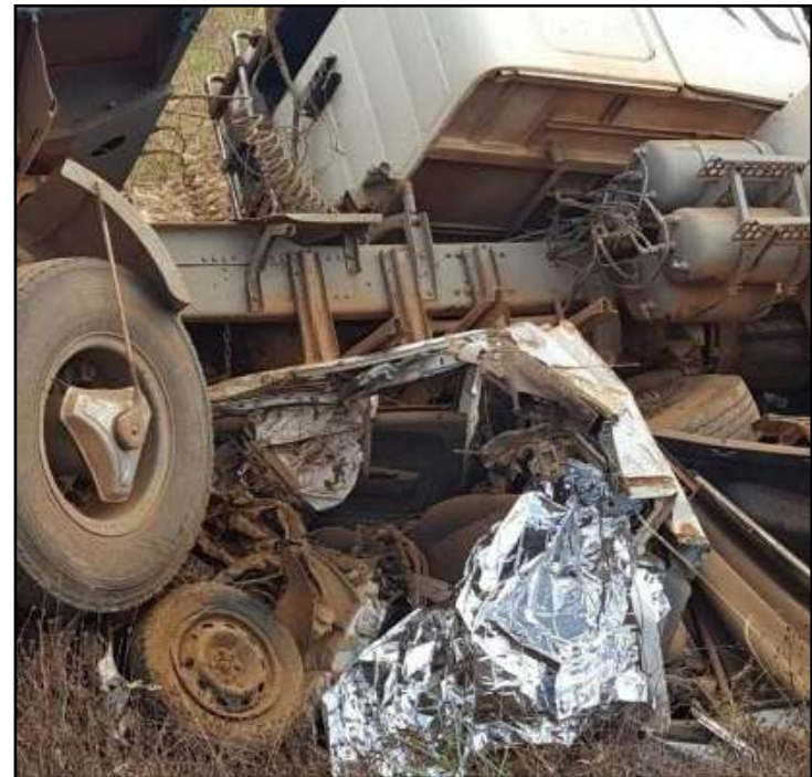
Colisão fatal ocorreu entre Sorriso e Ipiranga do Norte