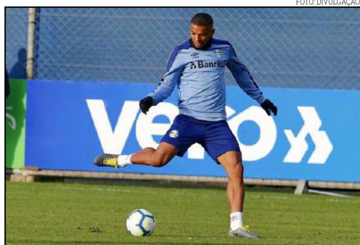
Zagueiro treina, mas ainda não foi apresentado oficialmente