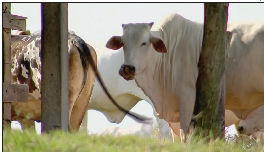
Um total de 200 propriedades terão que vacinar rebanho

Após a contaminação, o animal tem até três meses de vida, período em que se desenvolvem sintomas como isolamento, agressividade, salivação e dificuldade ao andar. O ser humano também pode ser infectado.