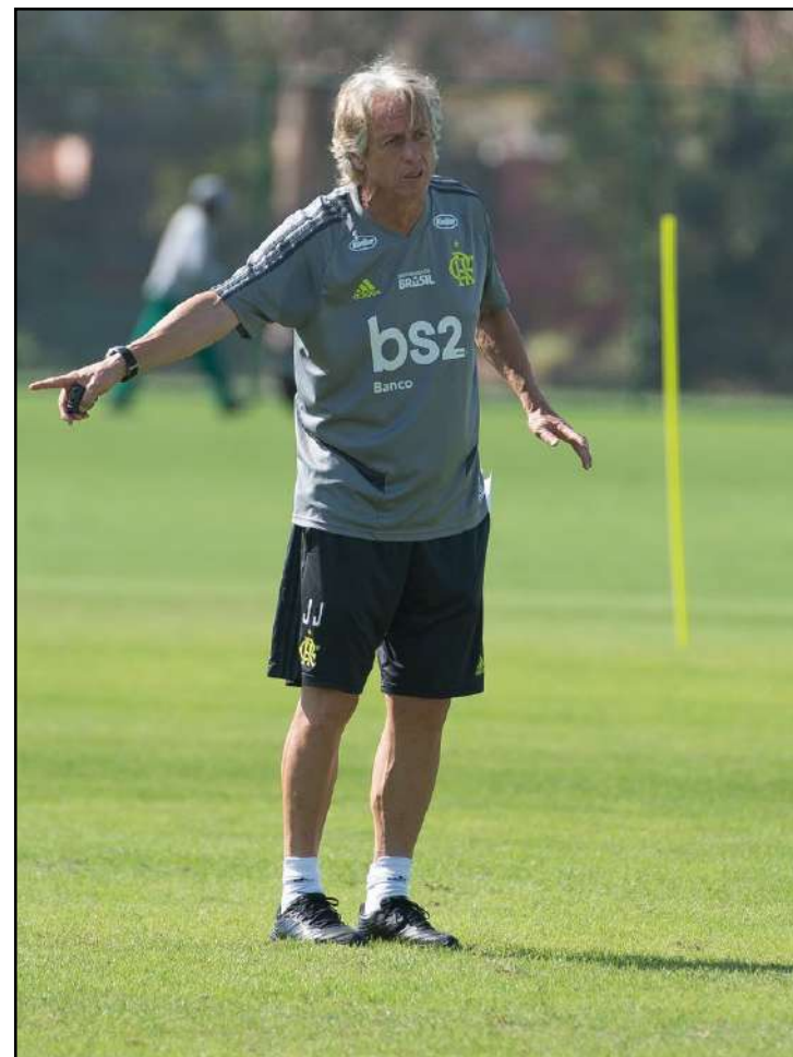
Jorge Jesus orienta os jogadores durante treino no Ninho do Urubu