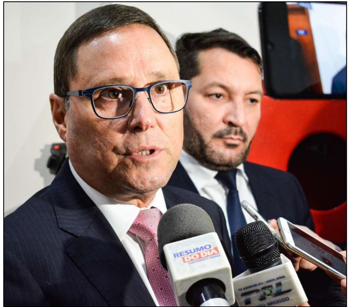
Audiência de conciliação parece ter sido positiva

Serão investidos ainda R$ 35 milhões para melhoria na infraestrutura das escolas. Outra reivindicação atendida pelo Governo é o chamamento do cadastro de reserva do concurso público de 2017, que vai contemplar vários municípios de Mato Grosso.