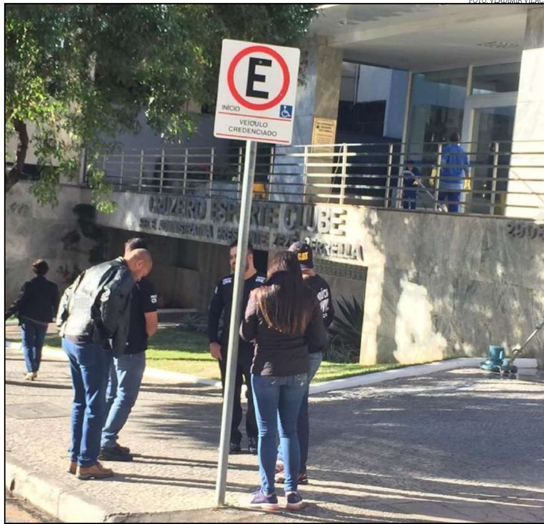
Polícia Civil cumpre mandados de busca e apreensão na sede do Cruzeiro

No fim de 2018, a Polícia Civil abriu inquérito para apurar irregularidades no clube. O inquérito se baseia em um balancete contábil analítico, que demonstra pagamentos feitos pelo Cruzeiro no decorrer do ano passado, ao qual o Fantástico também teve acesso. A reportagem foi além e conseguiu quase 200 páginas de contratos e planilhas de controle interno. Há evidências de que a diretoria cruzeirense quebrou regras da Fifa e da CBF, no âmbito do futebol, e do governo federal, por meio do Profut (programa de renegociação de dívidas fiscais com clubes).