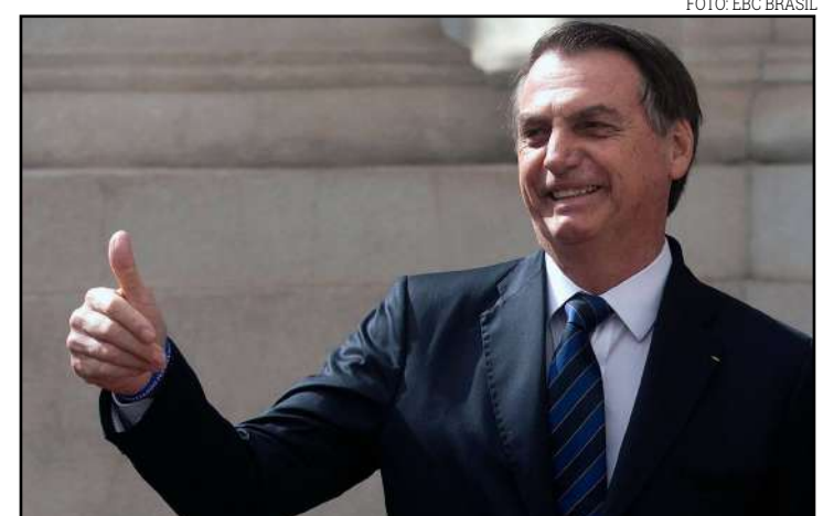
As emendas parlamentares são voltadas para a área da saúde