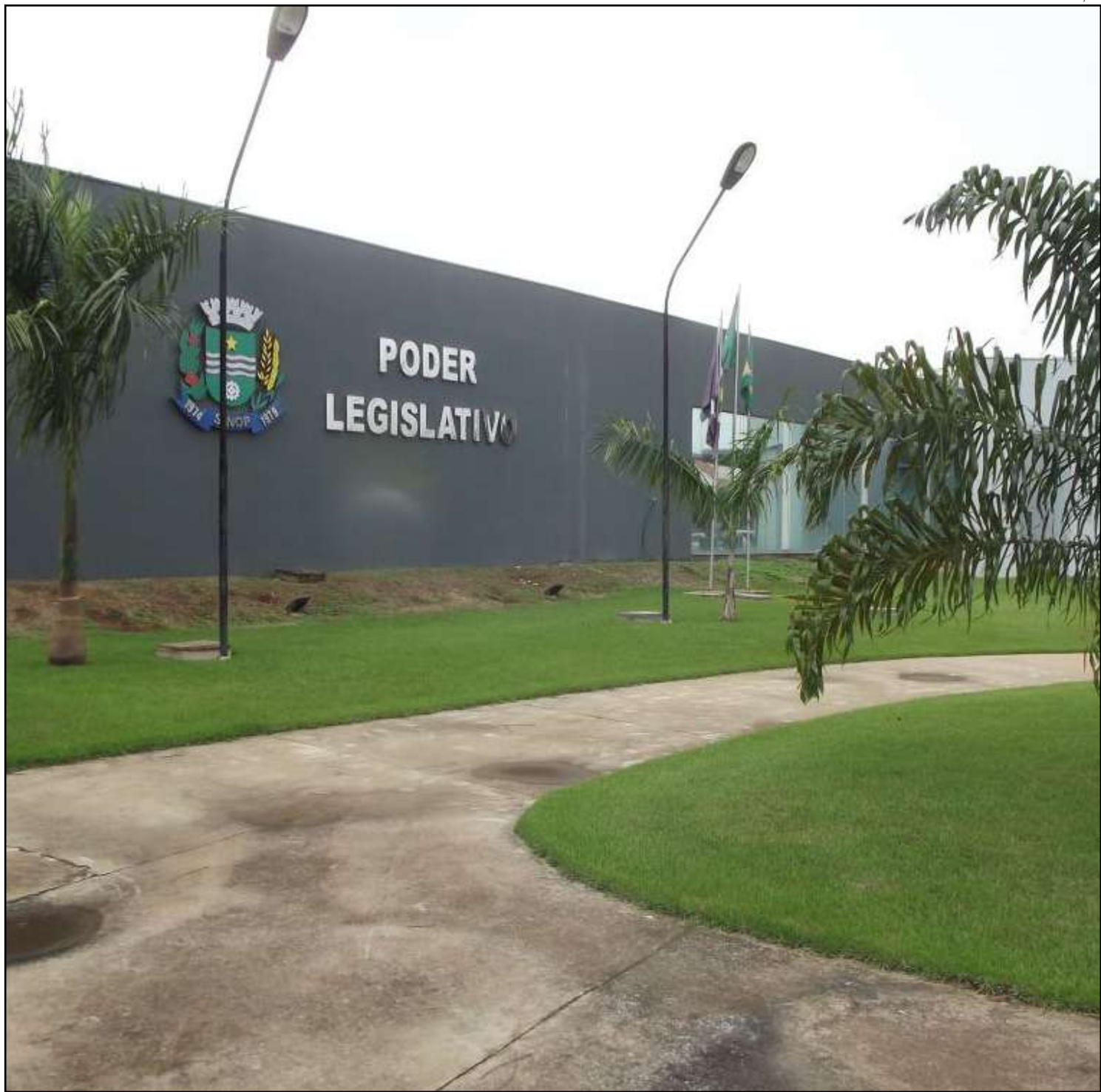
Relatório final da comissão deve ser votado pelos vereadores

“Independentemente, de ser ou não colocada em prática e de ter ou não caído em desuso, essa disposição afronta o comando constitucional supramencionado, na medida em que cria distinções entre os cidadãos, promovendo determinadas confissões em detrimento daquelas que não adotam referido livro, inibindo a liberdade de religião, e, por consequência, violando os princípios da laicidade do Estado e da liberdade de crença, impondo-se, pois, a declaração de inconstitucionalidade”, apontou o