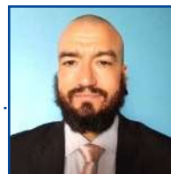
POR LEANDRO CARECA

Reservar períodos de tempo de descanso é excelente para seu corpo. Parar por alguns (poucos) minutos durante longos períodos em frente ao computador pode ser revigorante e ajudar a evitar transtornos maiores. Aproveite esse tempo para esticar o corpo, andar, ver coisas diferentes e conversar com quem estiver por perto. Sair do computador para o celular não vai adiantar praticamente nada.