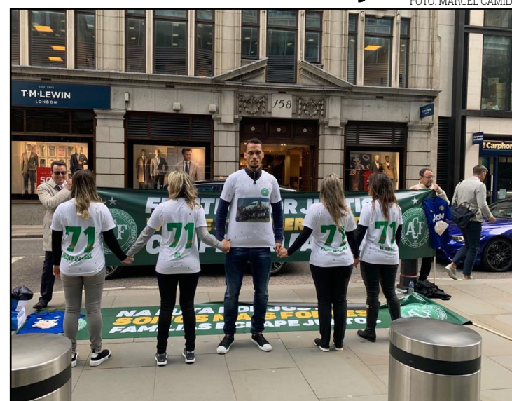
Neto e viúvas de acidente da Chape protestam em Londres

Os advogados das famílias dizem que a Aon é responsável pela avaliação de risco de seguros e que tinha