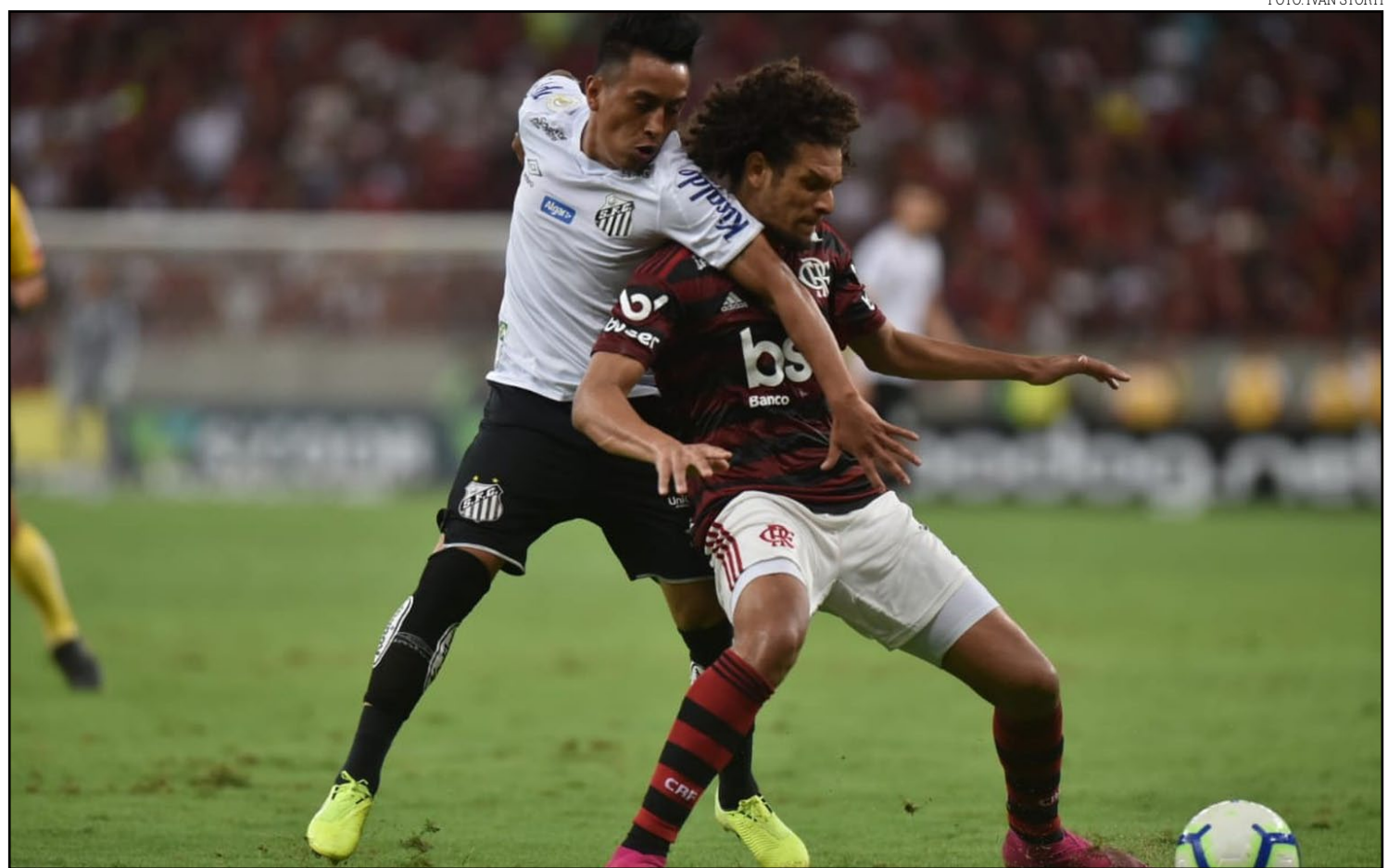
Cueva só jogou contra o Flamengo em quatro meses

O curioso é que, na entrevista ao site peruano, Cueva disse que “estava jan-