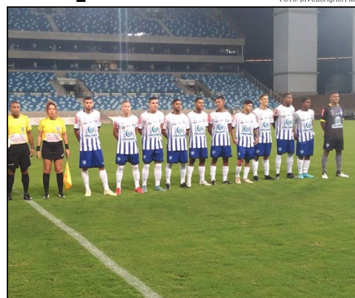
Sem www.FrazaoLeiloes.com.br, em igualdade de condições com os participantes de modo presencial. O horário mencionado neste edital, no site da leiloeira, catálogos ou em qualquer outro veículo de comunicação, consideram o horário oficial de Brasília/DF. As demais condições obedecerão ao que regula o Decreto nº 21.981 de 19 de outubro de 1932, com as alterações introduzidas pelo Decreto nº 22.427 de 1º de fevereiro de 1933, que regula a profissão de Leiloeiro Oficial.

Os jogos serão confirmados pela Federação Mato-grossense de Futebol e devem iniciar no próximo fim de semana, dias 5 e 6 de outubro. Os confrontos decisivos serão nos dias 12 e 13. A competição vale vaga na Copa do Brasil 2020. O Cuiabá é o único com a vaga garantida.