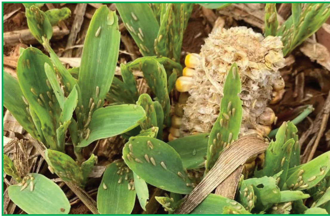
Especialistas capturaram mais de 400 cigarrinhas do milho por armadilha em lavouras

Assim que o plantio de milho se inicia, pontua Lucia Vivan, o monitoramento