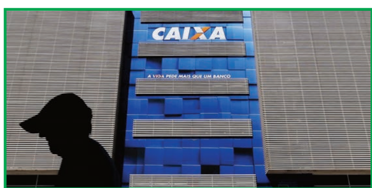
Pagamento do Auxílio Gás também começou nesta terça

Em janeiro, o valor mínimo do Auxílio Brasil voltará a R$ 400, a menos que uma nova proposta de emenda à Constituição seja aprovada. Tradicionalmente, as datas