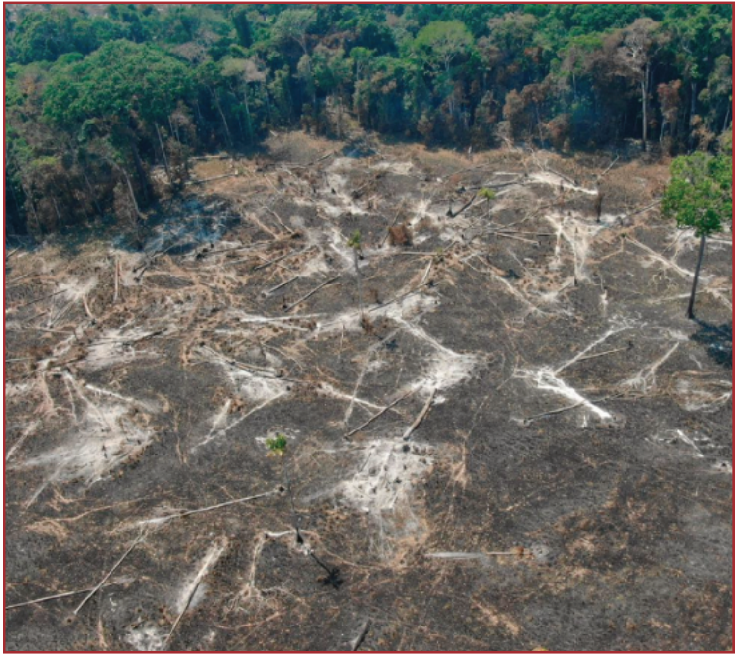
Foram 1.923 hectares fiscalizados

O Estado soma R$ 165 milhões investidos para esta finalidade, desde o início da atual gestão.