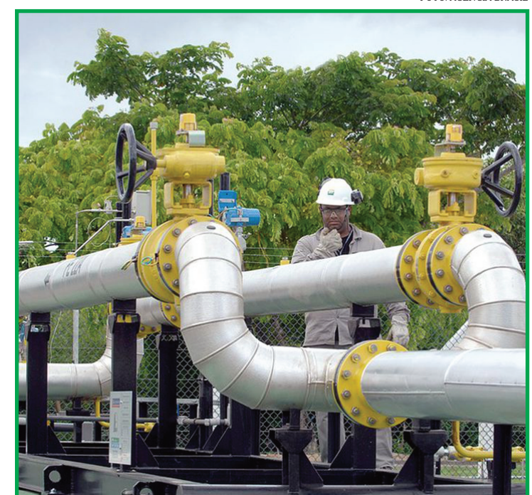
Novos valores serão atualizados em 1º de novembro

úteis do mês, mas o pagamento de outubro ocorrerá entre os dias 11 e 25.