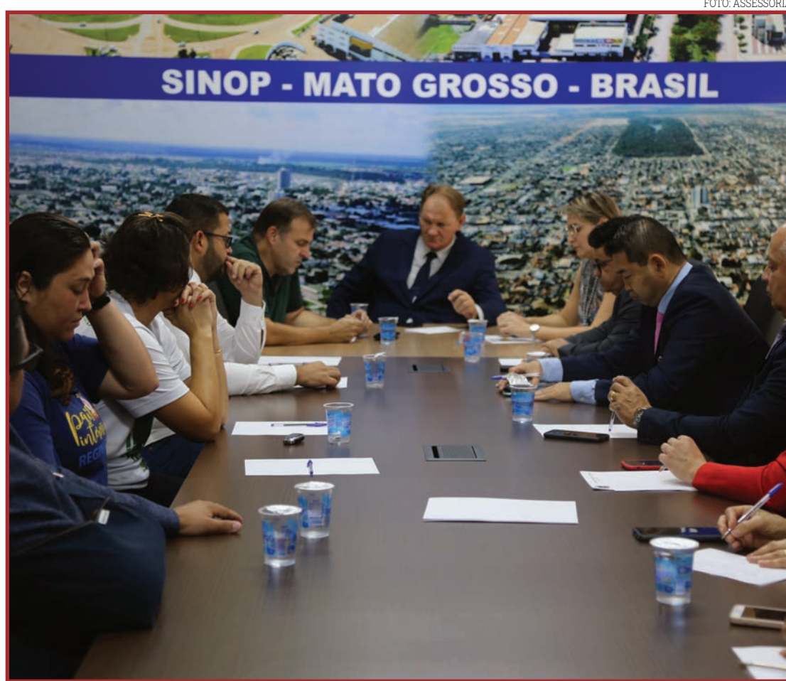
Representantes da Adesin apresentaram entidade aos vereadores

A Secretaria de Finanças prevê que 26% da receita serão aplicados na Educação e 25,44% na saúde.