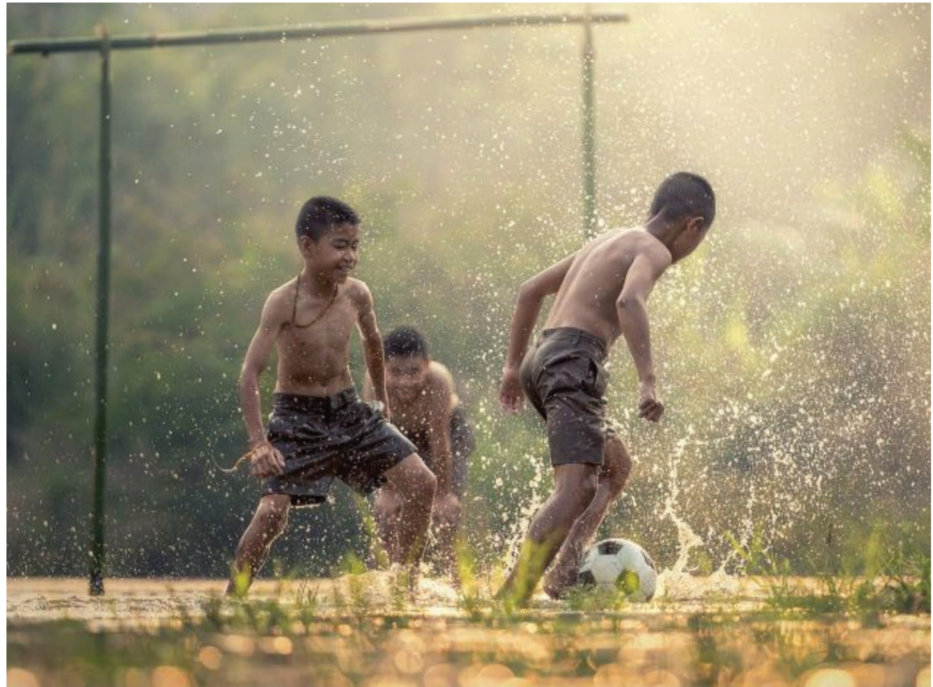
Datas serão celebradas nesta quarta-feira

Desde 1930, a santa é oficialmente a padroeira do país, após um decreto papal. Porém, só em 1980, quando o papa João Paulo II esteve no Brasil, que o então presidente João Figueiredo declarou feriado nacional no dia 12 de outubro. O Dia das Crianças é celebrado em diferentes datas mundo afora. Na Suíça, por exemplo, devido à Conferên-