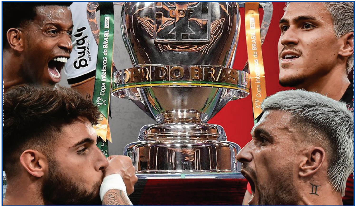
Flamengo e Corinthians já se enfrentaram em 2022

Sem os dois títulos no currículo, Dorival dificilmente fica no Flamengo em 2023. Vale destacar o fato de que a Copa do Brasil é o único título que falta