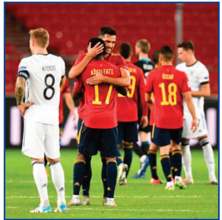
Espanha e Alemanha fazem clássico na segunda rodada

O Japão disputará sua sétima Copa do Mundo. A seleção japonesa não fica de fora de uma Copa do Mundo desde a França-1998 e, embora pareça que sempre participaram da competição, a Copa da França foi a primeira de sua história. Desde então, os japoneses têm sido uma figurinha repetida nas fases de grupos. Atualmente treinada