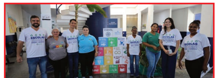
Primeiro gabinete Lixo Zero do Brasil é oficialmente lançado