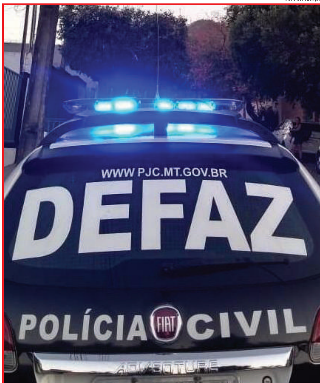
Trabalho detectou envolvimento de produtores rurais com uma empresa de fachada

Ao todo, estão sendo intimados 60 produtores rurais que, possivelmente, utilizaram a empresa investigada para a comercialização de produtos, sem a respectiva nota fiscal. A primeira fase da