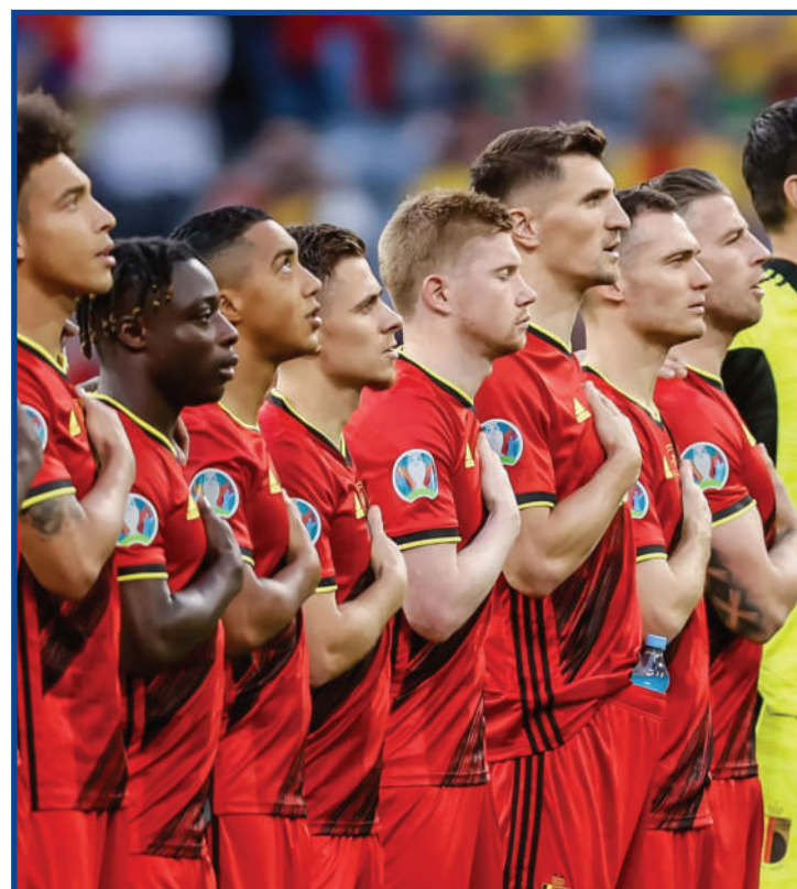
Jogadores da Bélgica cantam hino em jogo das Eliminatórias Europeias

Os croatas tiveram vida tranquila nas eliminatórias.