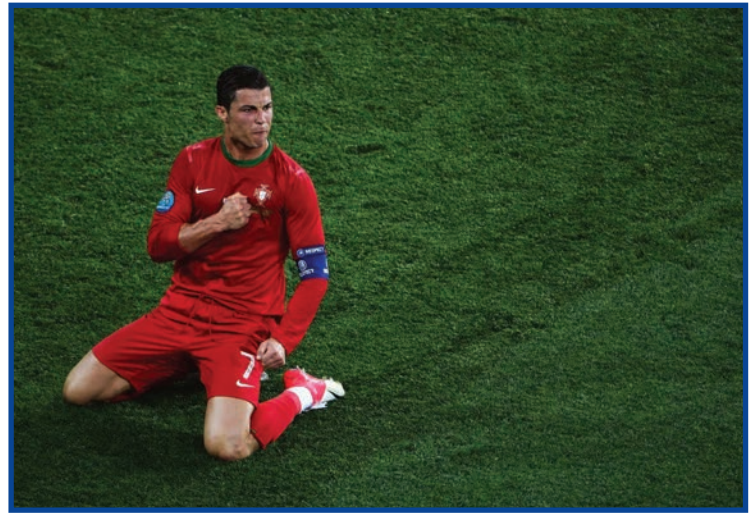
Última Copa de Cristiano Ronaldo