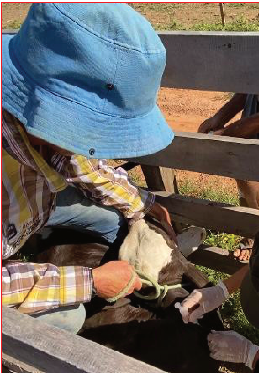
Produtores orientados sobre prazo de vacinação

A brucelose é uma doença dos animais transmissível ao homem. Ela ocasiona a quebra na produção animal e torna o produto da pecuária vulnerável a barreiras sanitárias, diminuindo sua competitividade no comércio internacional.