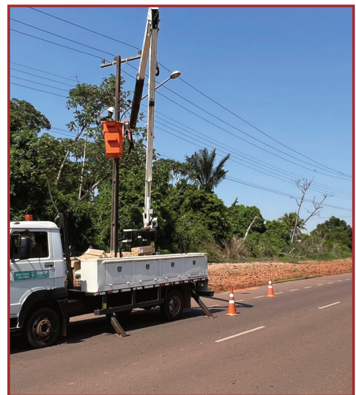
Previsão é que 28 mil sejam trocadas

lei prevê “pagamentos instantâneos autorizados pelo Banco Central do Brasil”. Isso significa, que a concessionária logo logo pode passar a aceitar também PIX e cartão de crédito no pagamento das tarifas. “Criar leis e dispositivos legais que melhorem a vida dos cidadãos é uma das obrigações dos parlamentares. Esta lei cumpre este objetivo, uma vez que grande parte da população opta, hoje em dia, por meios eletrônicos de pagamento que são mais rápidos e seguros”, disse o deputado.