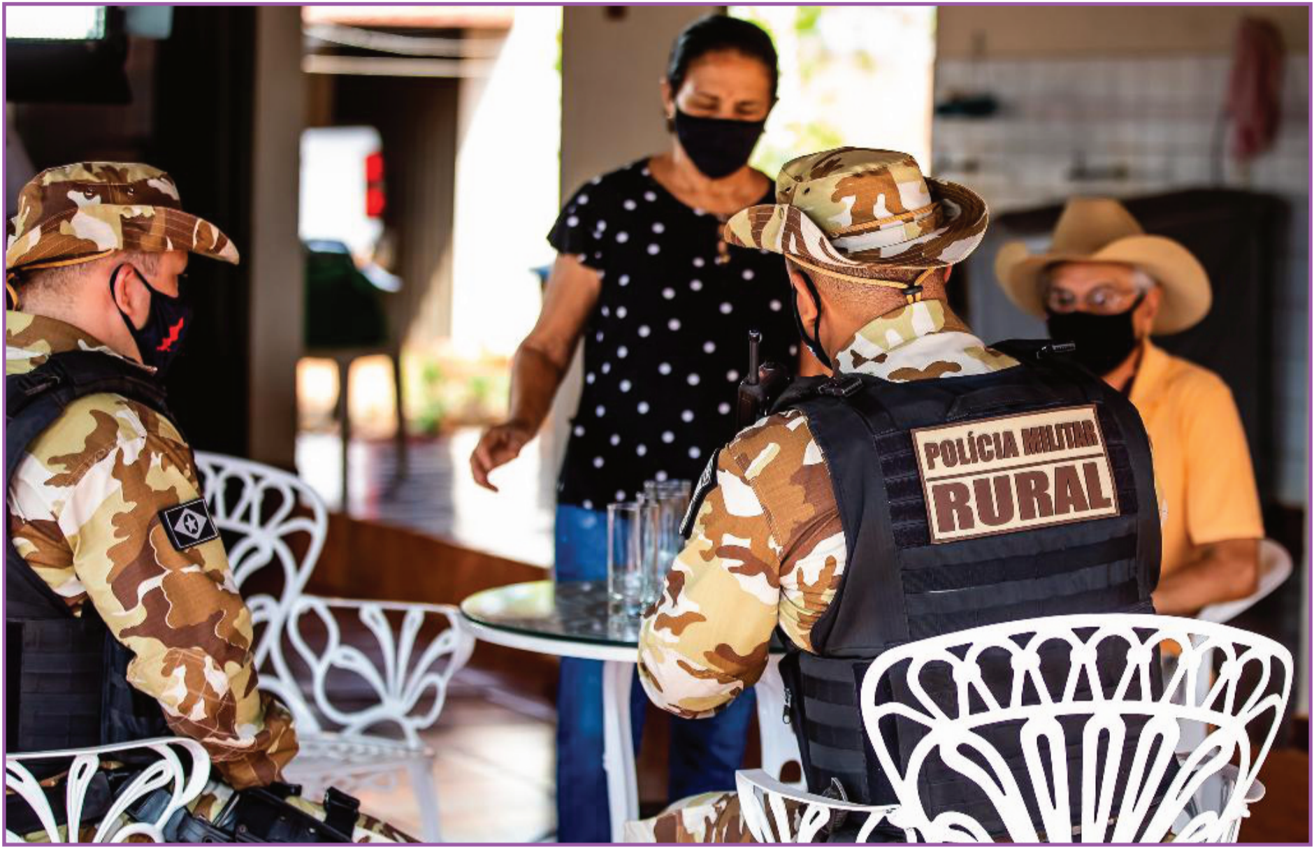
Este ano, casos somam 102 registros

A incidência de crimes contra o patrimônio rural também apresenta queda significativa. O número de roubos em propriedades agrícolas caiu 30% em relação a 2021. Já os registros de roubos e de furtos de gado reduziram 31% e 35%, respectivamente no comparativo com o mesmo