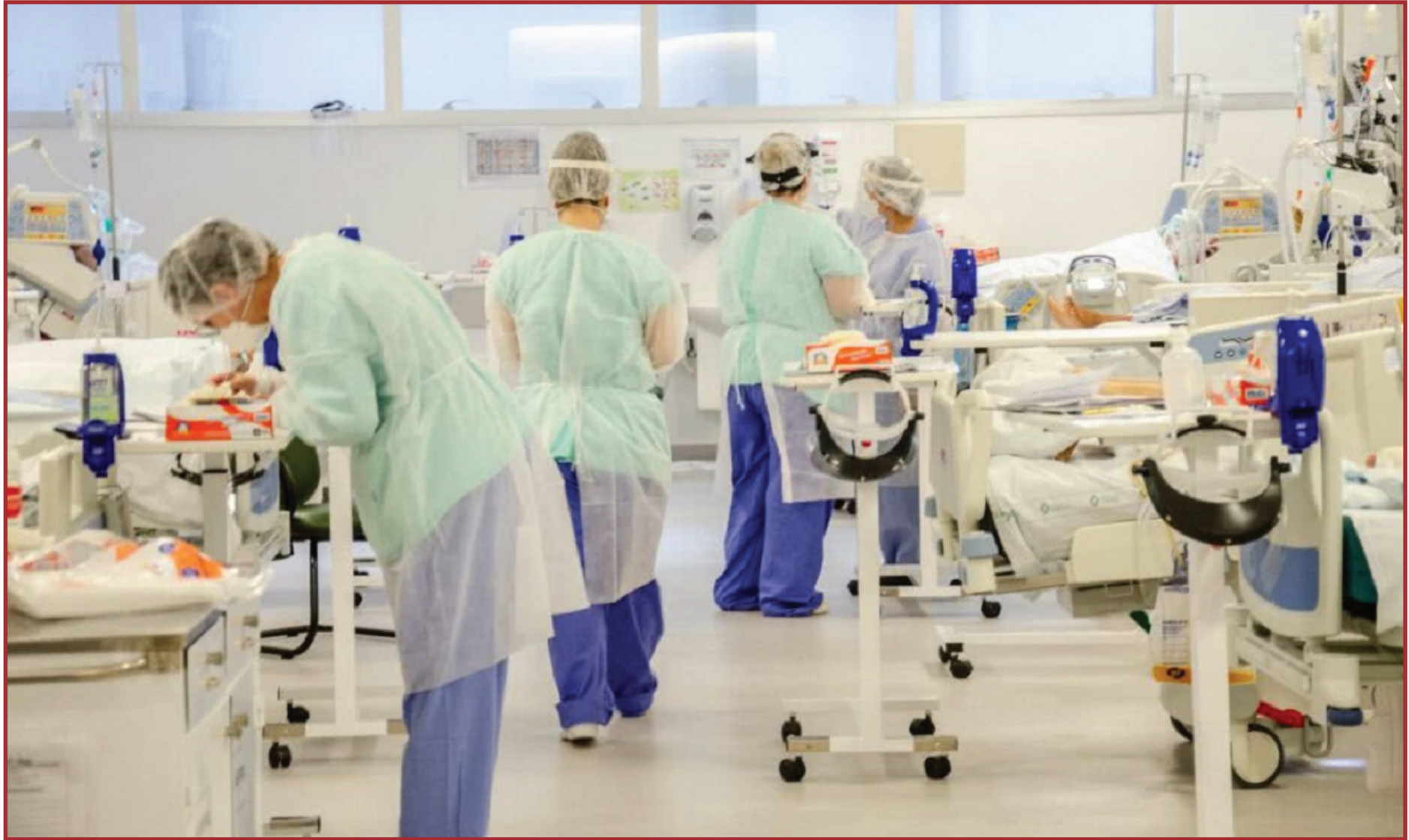
Aprovação é condição dada pelo STF

A transposição de saldos financeiros ociosos dos fundos estava autorizada até o fim de 2021, para o combate à pande-