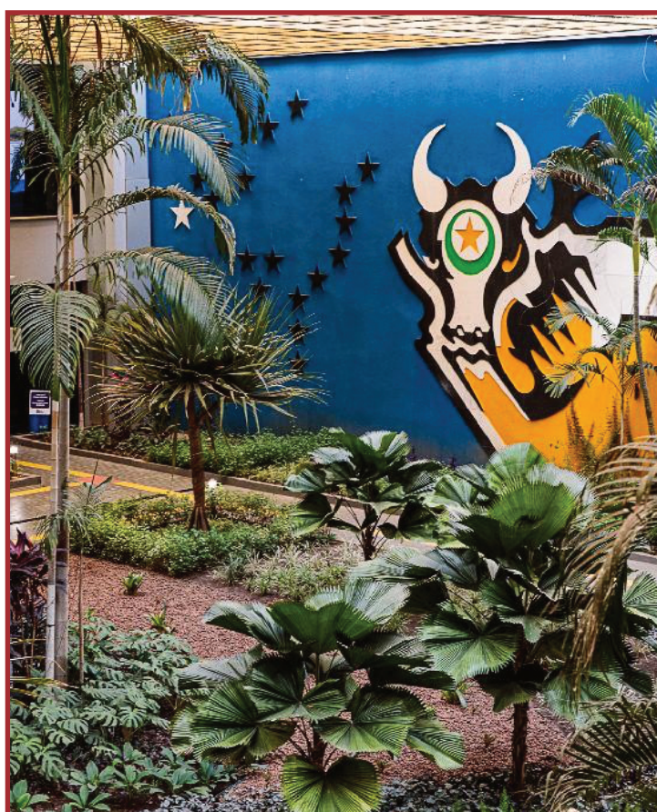
As multas somaram mais de R$ 175 mi aplicadas a 71 empresas

Já os acordos de leniência, firmados com sete empresas, somaram mais de R$ 185 milhões entre 2019 e 2022. O acordo de leniência é um instrumento administrativo, que guarda semelhanças com a colaboração premiada de pessoas físicas no âmbito penal.