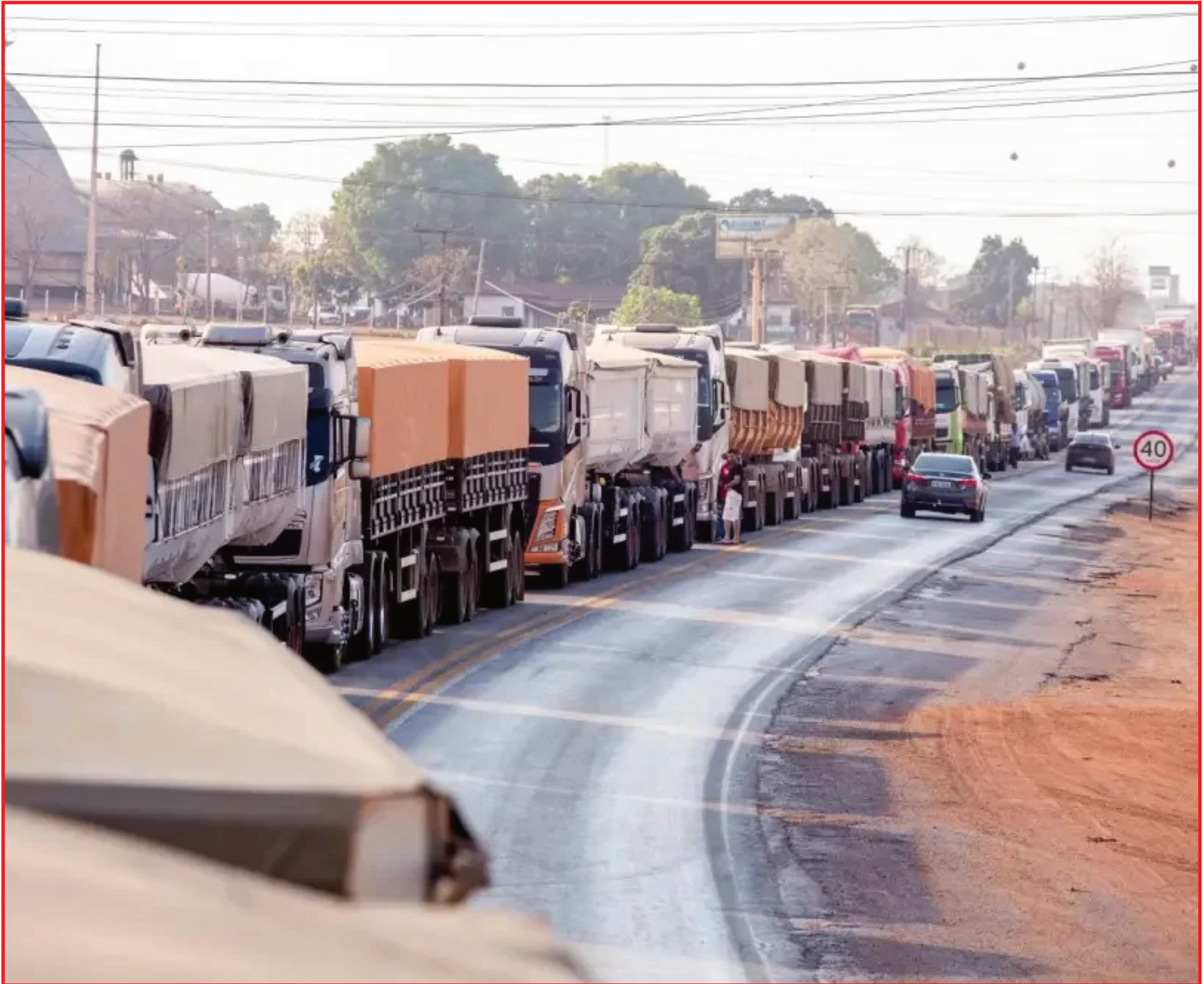
Bloqueio de caminhoneiros atrapalha abastecimento de alimentos

"A gente entende que esse aumento de uma forma inesperada e de um valor bastante expressivo, seja muito provavelmente da responsabilidade desses bloqueios. Se tratando de alimentos perecíveis, existe uma perda maior do produto então faz com que ele custe mais caro e o transporte, as pessoas paradas nas estradas e frete mais caro", disse.