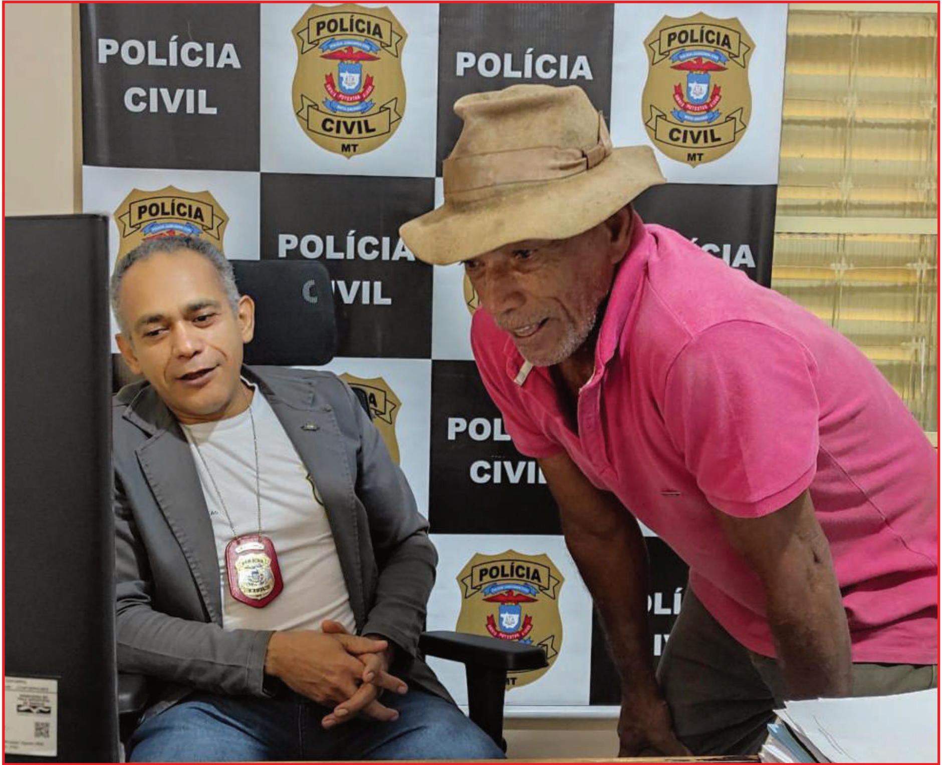
Senhor contou com ajuda de policiais para reencontrar seu irmão