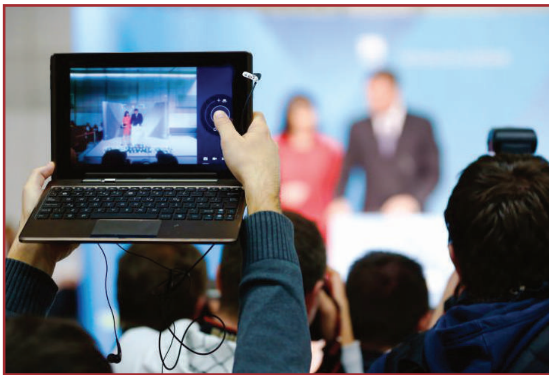
Proposta cria a figura do crime de censura eleitoral

O texto também altera a Lei Eleitoral para impedir qualquer tipo de fiscalização e controle de opiniões e publicações sobre candidatos feitas de ofício, ou seja, sem o aval do Ministério Público.