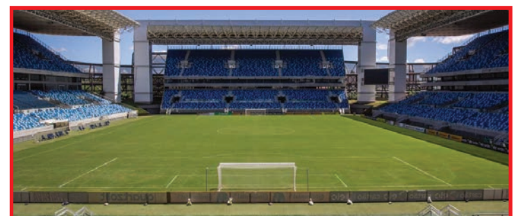
Início dos trabalhos está programado para o próximo dia 26