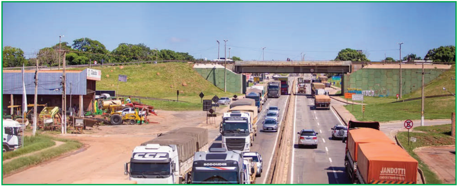
BR-163 em MT passará a ser administrada pelo Governo do Estado

Ao todo, a rodovia tem 822,8 km que passaram a fazer parte do controle acionário da