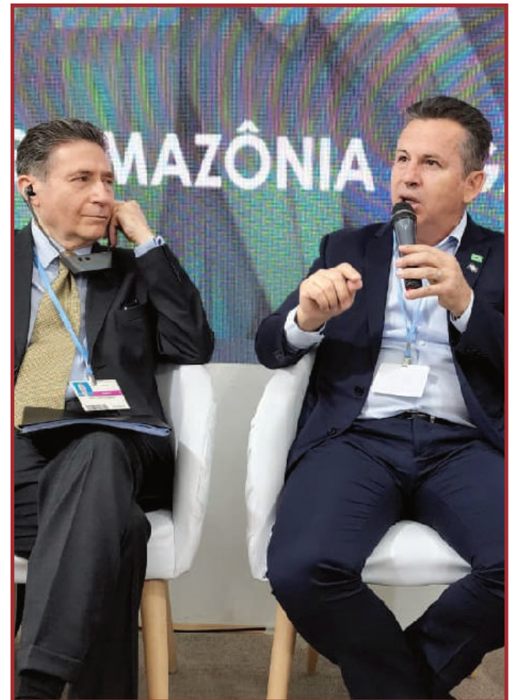
Mauro mostrou dados positivos obtidos com a política de tolerância zero aos crimes