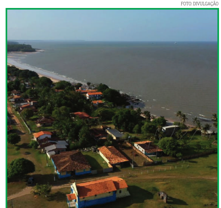
Até 2020, queijo do Marajó ainda não podia ser comercializado fora do estado