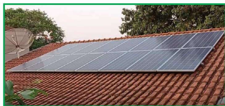
Segundo a Prefeitura, o desconto pode ser de até 25% sobre o imposto

Moradores que tiverem o interesse, podem protocolar as solicitações junto à Secretaria de Meio Ambiente e Desenvolvimento Urbano (Sema) em até 30 dias antes do vencimento do imposto. Segundo a Prefeitura de Cuiabá, o desconto deixará de ser concedido se as medidas sustentáveis deixarem