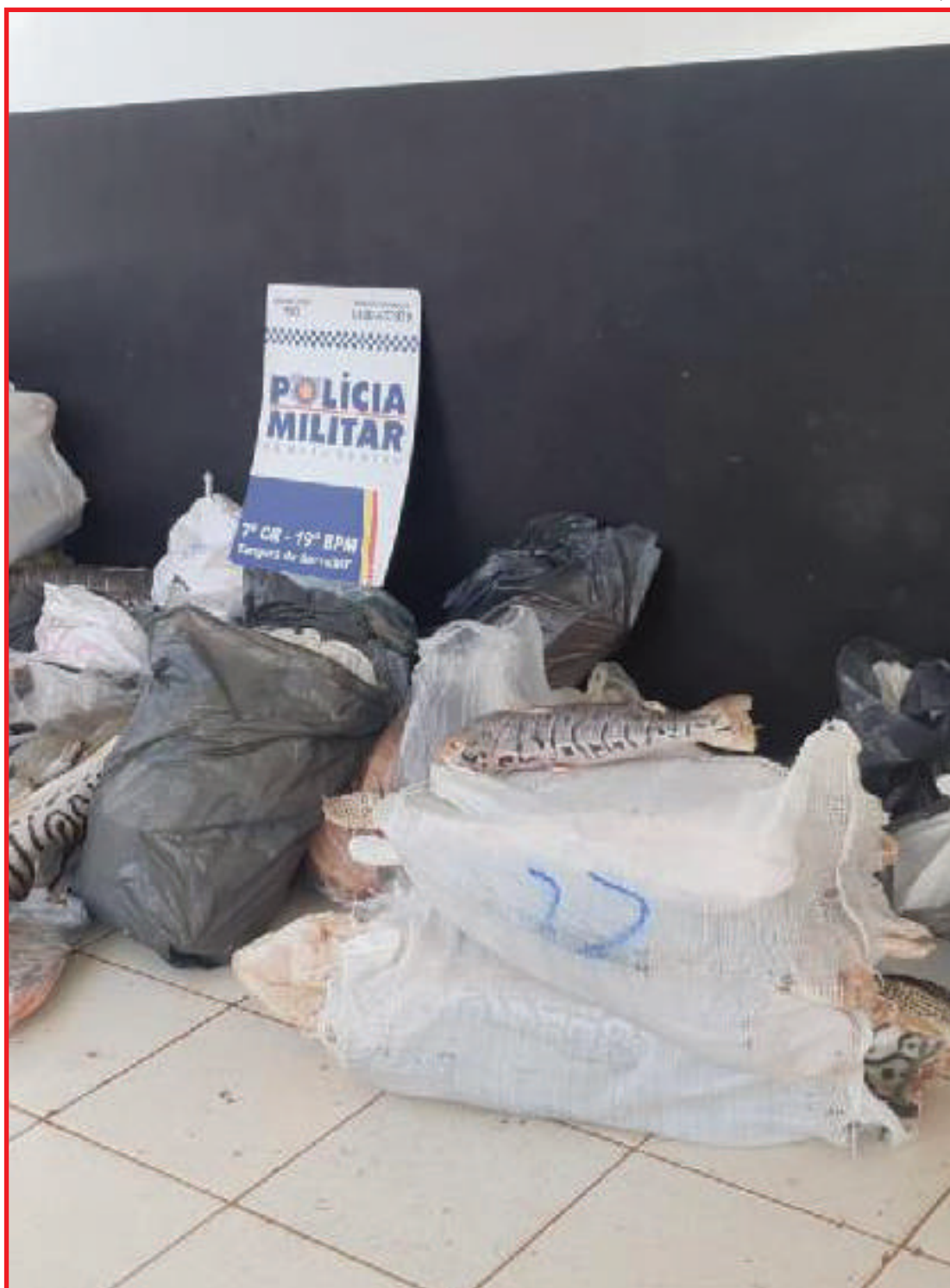
Apreensão ocorreu após militares receberem denúncia sobre o carregamento irregular

A sociedade pode contribuir com as ações da Polícia Militar de qualquer cidade do Estado, sem precisar se identificar, por meio do 190, ou disque-denúncia 0800.065.3939.