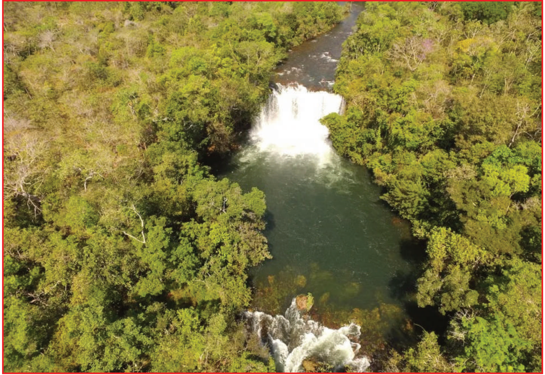
Rio do Sangue em Brasnorte

Na negociação, não foi realizado contrato escrito, tampouco a transferência junto ao Incra ou recolhido qualquer imposto referente ao negócio. Interrogado, o suspeito de adquirir a ilha disse que pretendia