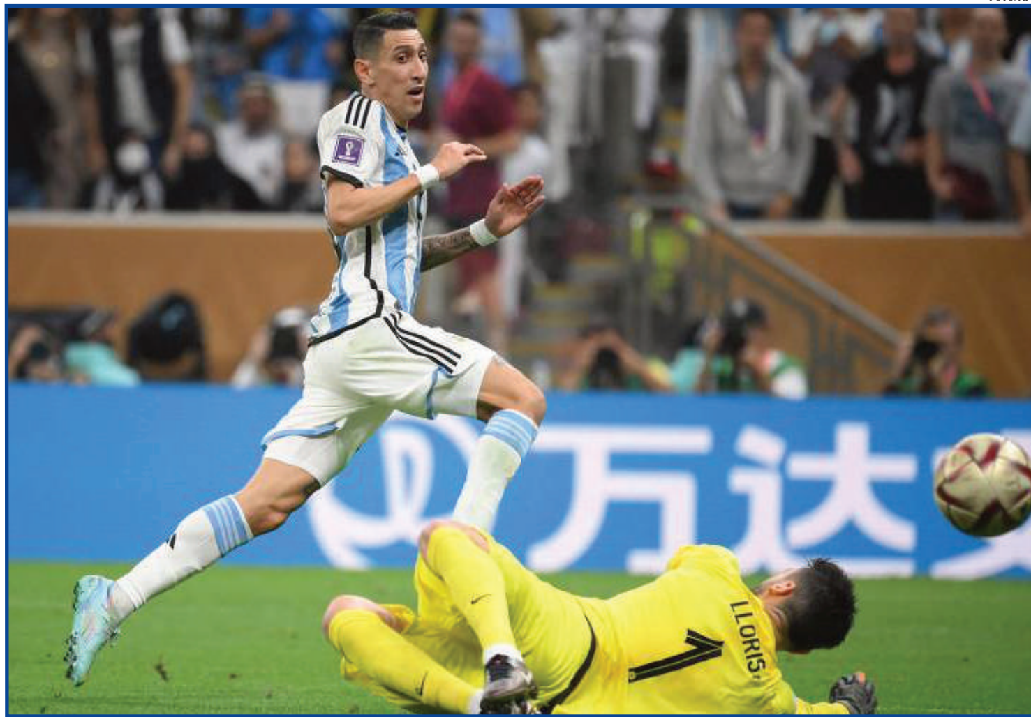
Di María marca o segundo gol da Argentina sobre a França na final da Copa

O balanço geral do duelo ficou em 93 minutos de superioridade argentina, enquanto os outros 49 foram de maior perigo dos franceses. No geral, a Argentina finalizou o dobro de vezes em relação à França. Foram 20 jogadas concluídas pelos campeões, contra 10 dos vices. Sem contar os chutes errados, houve 10 finalizações dos sul-americanos no alvo (3 gols e 7 defesas), ante 5 dos