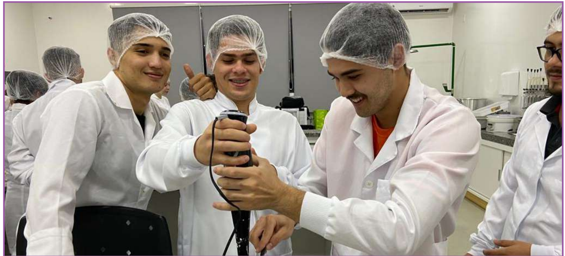
Responsável pela distribuição de produtos de necessidade das pessoas

Compete ainda especificar, prever e avaliar os resultados obtidos destes sistemas para a sociedade e garantir uma produção cada vez mais limpa e sustentável para o meio ambiente. Ou seja, realizar uma produção ecologicamente correta, socialmente justa, culturalmente diver-