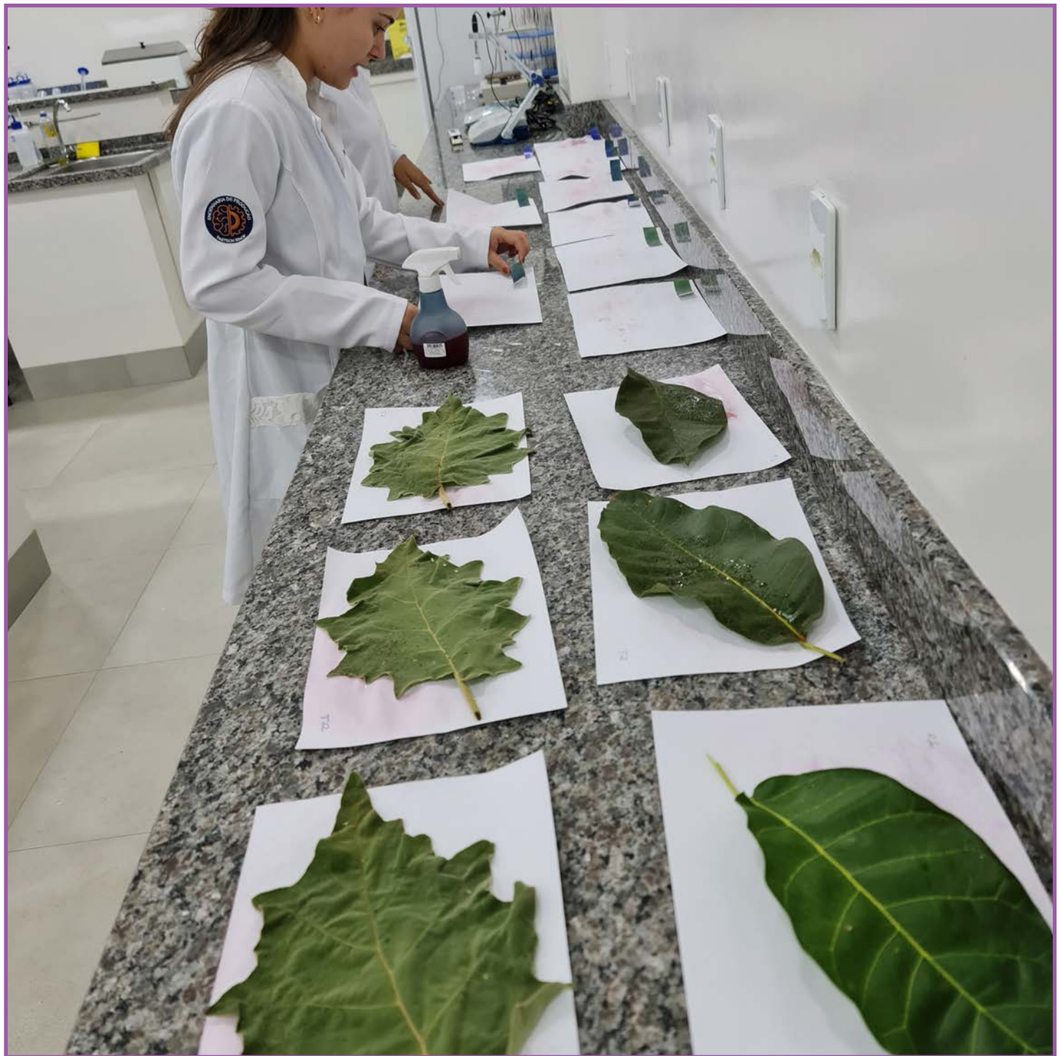
Aulas práticas em laboratório

“Quem conhece sabe, prezamos pela união entre teoria e a prática. E no curso de Gestão do Agronegócio estamos sempre realizando diversas visitas técnicas com nossos alunos pois é uma das diversas possibilidades de realização desse objetivo de conhecer na prática tudo