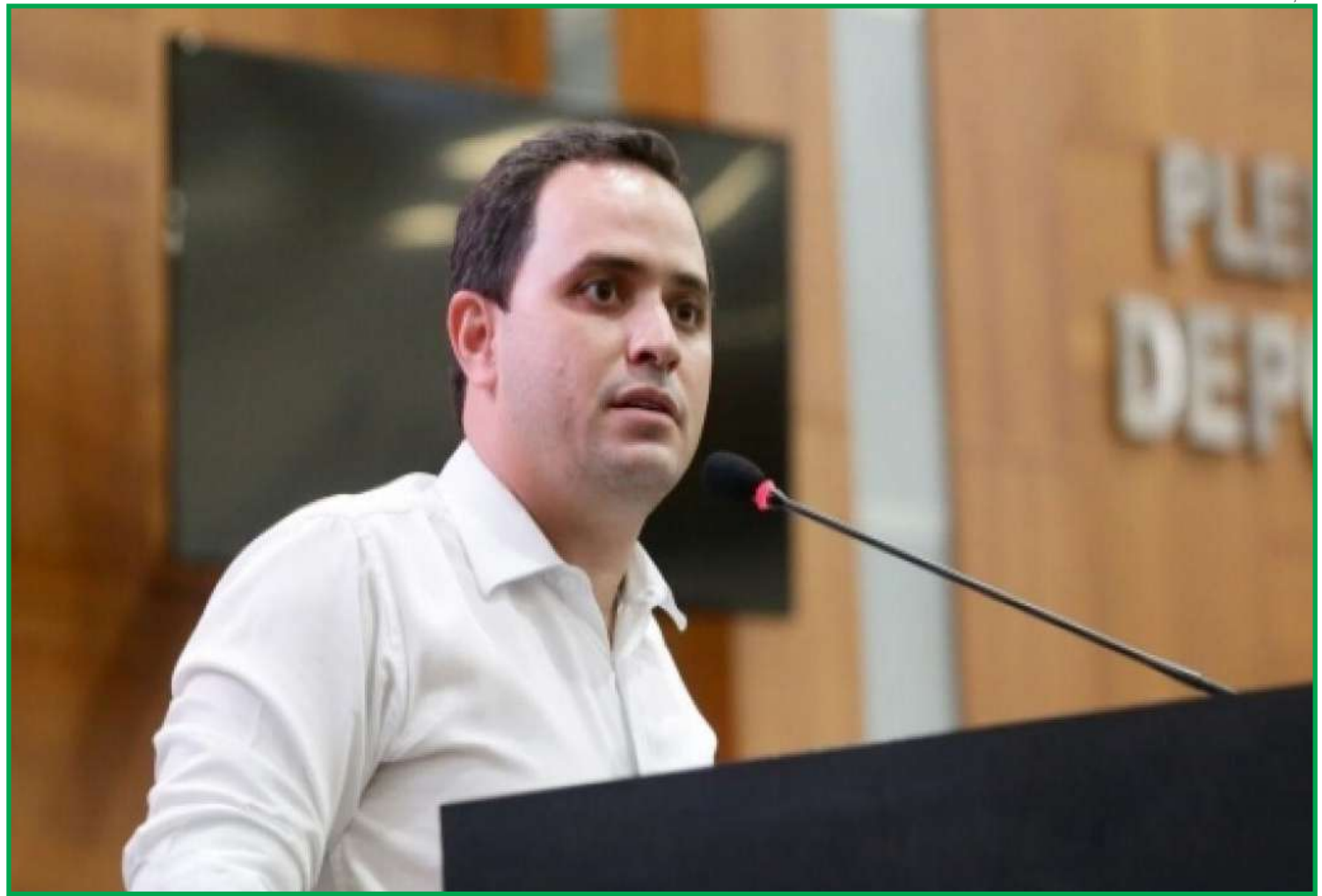
O Procon precisa ser provocado

"Dois apagões foram registrados e eu me pergunto: 'quem tem o telefone pós-pago, se atrasar um dia o pagamento da fatura, o que acontece?' Multa, juros. Agora, eles deixam a população sem internet por dois dias, faz perder dinheiro quem depende da telefonia e o que acontece com eles?", questiona o deputado.