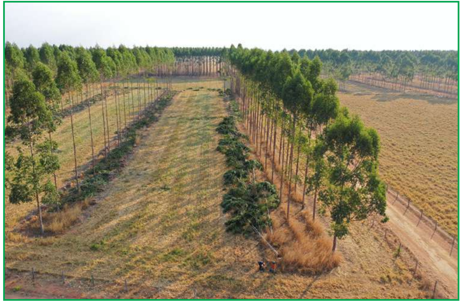
Uso da biomassa que gera calor e energia criou uma nova oportunidade de mercado