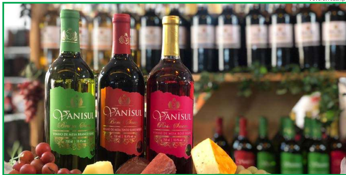
Cultura, gastronomia e moda integram programação da Feira Gaúcha

Na gastronomia, os visitantes poderão degustar pratos como a tradicional costela no fogo de chão e o porco no rolete; as famosas cucas, produzidas por des-