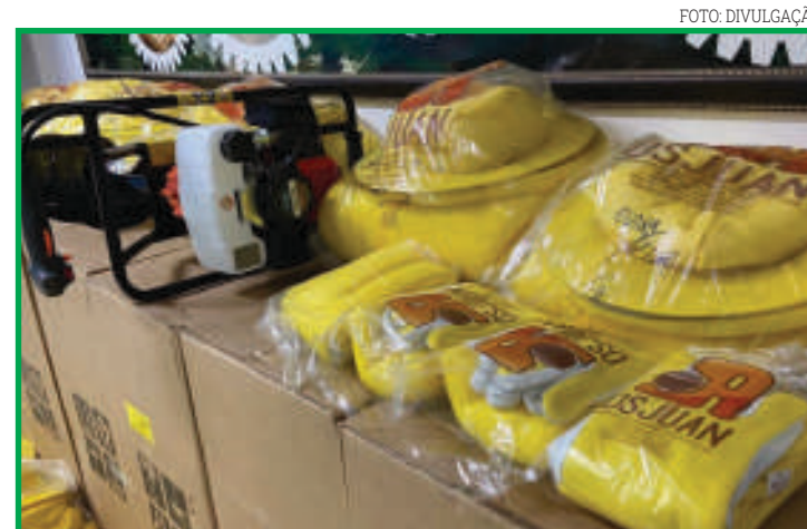
Equipamentos à apicultura

O zootecnista, mestre em Ciências Ambientais e co-