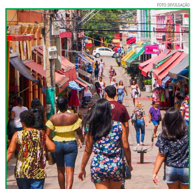
Região central de Cuiabá beneficiada com Projeto de Lei

intensificar as atividades de apicultura, mostrando que é possível produzir com sustentabilidade, contribuindo com renda e preservação da biodiversidade”.