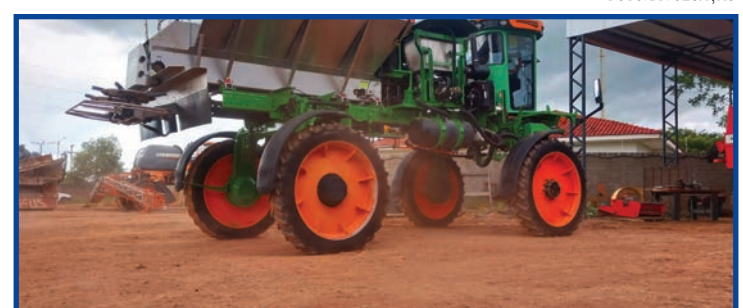
Visitantes poderão ver de perto todas as vantagens a Linha Z da MP Agro