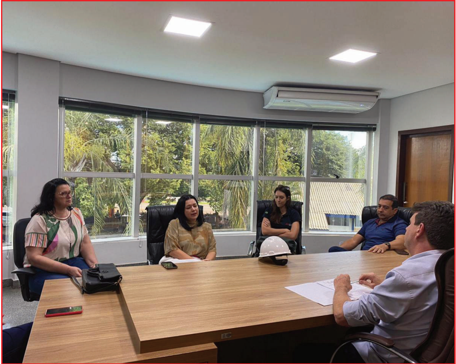
Unidade, que vai ser erguida no prolongamento da Avenida Araguaia

"Nossa expectativa é que esta escola fique pronta até meados de 2024, o que vai significar escola perto de casa para alunos que hoje estudam em unidades de outras regiões, precisam do transporte escolar ou demandam que os pais e