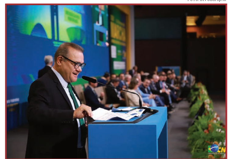
Apoio do senador às pautas municipalistas não é novidade