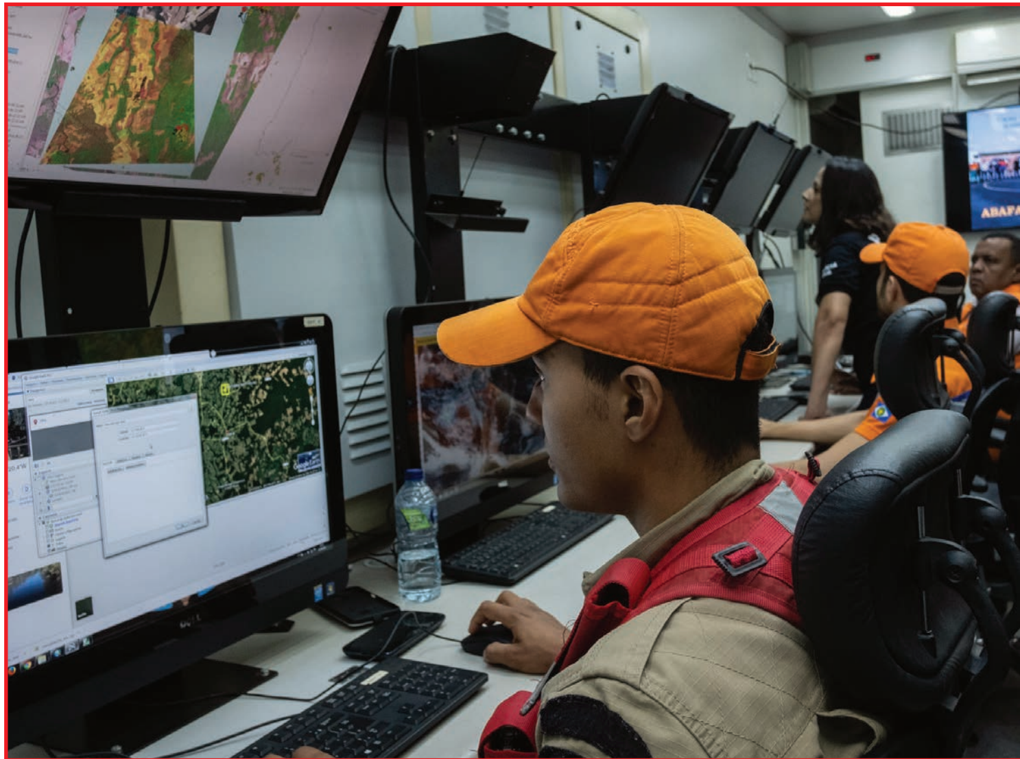
Monitoramento dos focos de calor