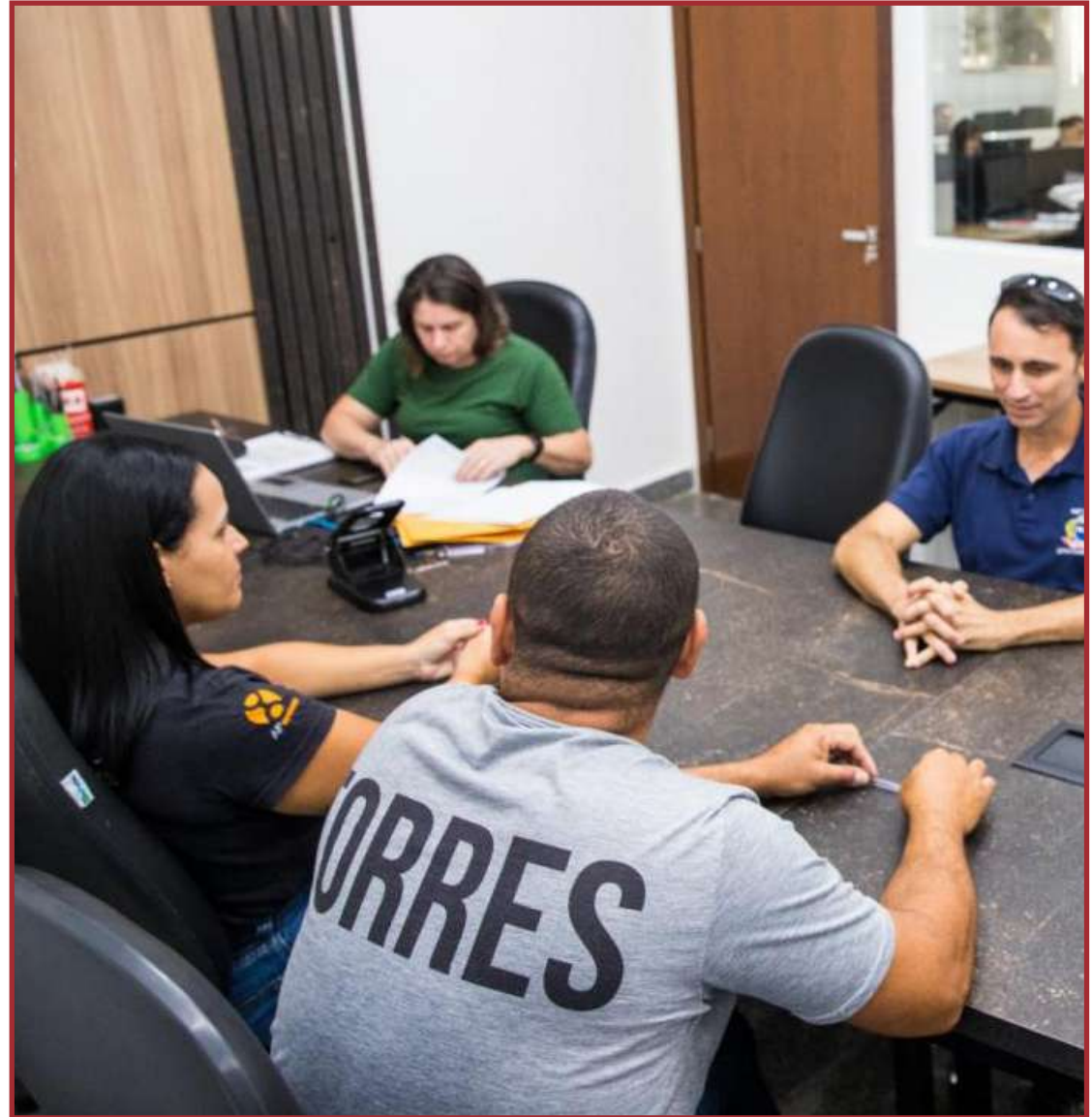
Monitoramento remoto em todas as 38 unidades escolares