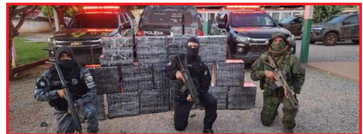
A 3ª apreensão realizada em pouco mais de uma semana