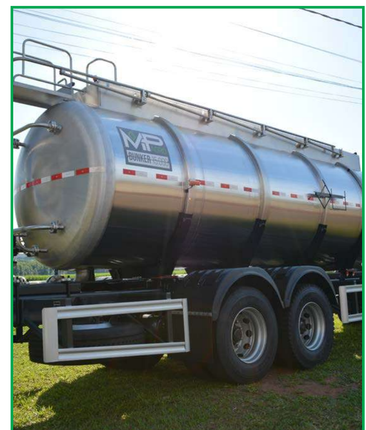
Bunker 15.000 da MP Agro Máquinas Agrícolas