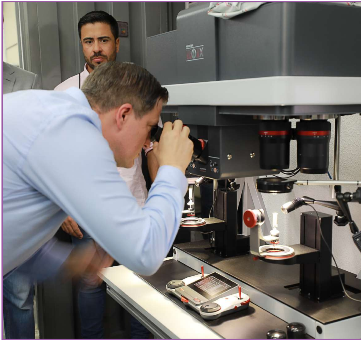
Maior central de análise balística do país

O SIB é um dos sistemas mais avançados do mundo, sendo utilizado pelas forças de segurança de mais de 80