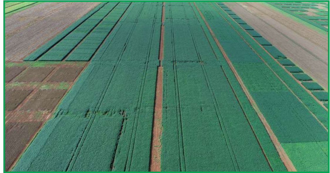
Diversos experimentos demonstram ganhos de produtividade

No padrão de manejo integrado, onde foi realizado o tratamento de sementes e aplicações foliares com produtos químicos, além do uso de biocontroladores, o pesquisador detalha que houve redução de até 40% na população de nematoides e de 30% na população de pragas com relação ao tratamento testemunha (apenas com inoculante biológico e sem manejo desses problemas). Em relação às doenças, o controle foi de até 50%, considerando a mancha alvo e cercosporiose