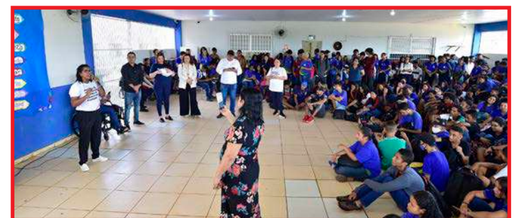
Palestra do Procon-MT, em Cuiabá