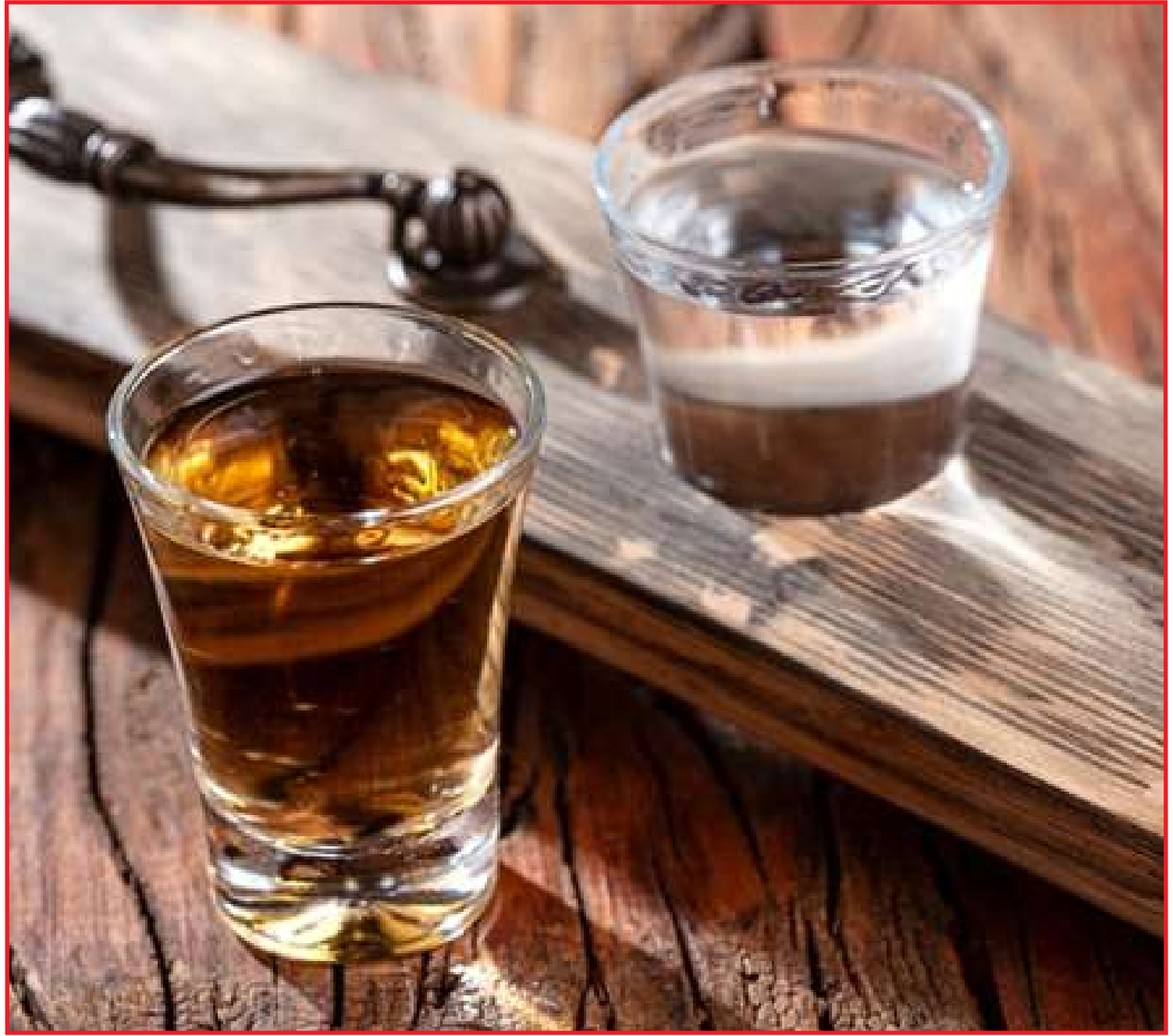
Água Doce ensina quais copos são os indicados para determinados drinques

O modelo é muito conhecido dos apreciadores de cervejas pilsen, uma das mais consumidas no mundo. Com um formato alongado, de base e bordas levemente estreitas, o copo é frequentemente confundido com o modelo lager. A taça permite a visualização e apreciação da bebida e favorece a formação da espuma em proporção ideal para consumo.