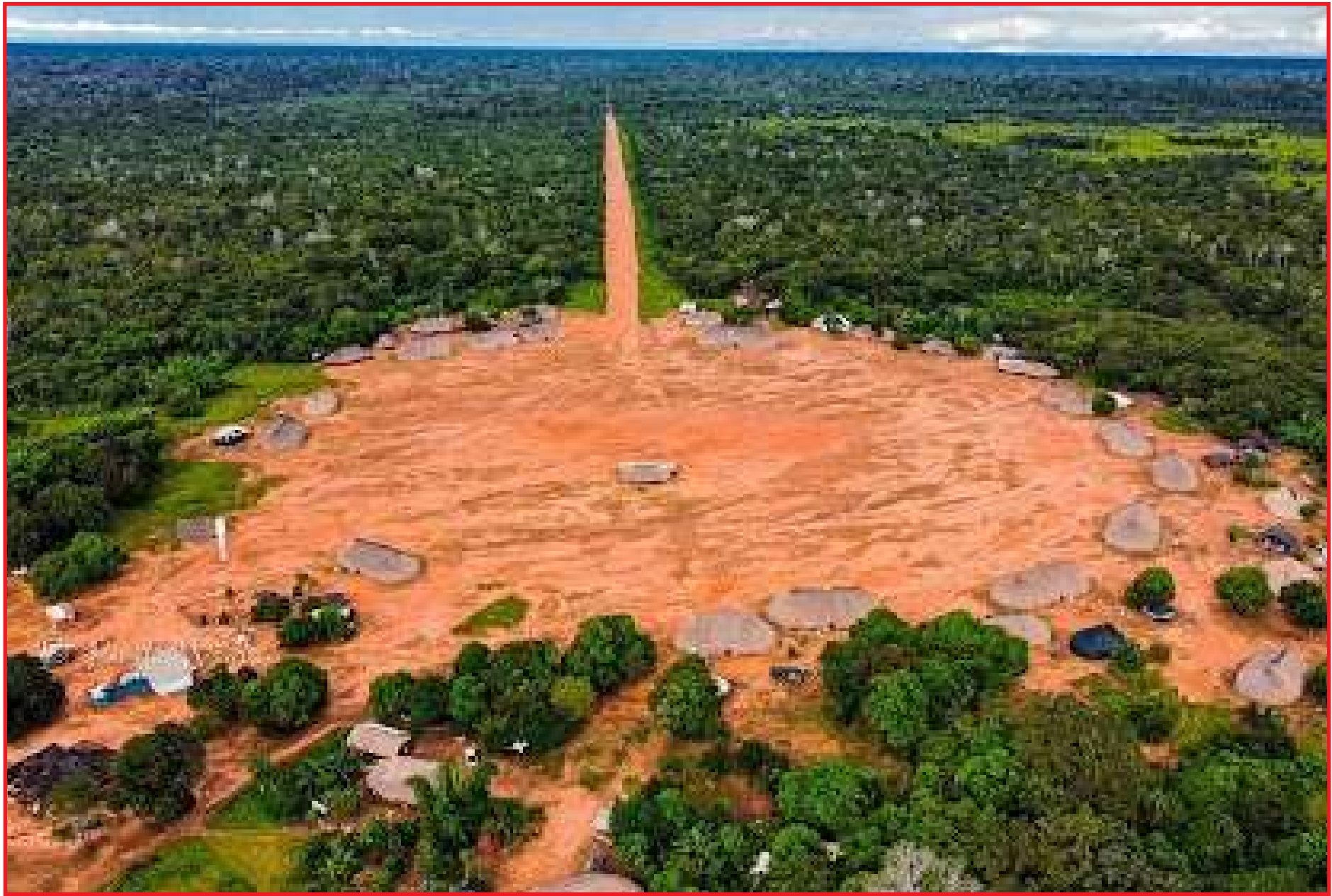
A Atiaia Renováveis, empresa de geração e comercialização de energias renováveis

Os levantamentos apontados pelo estudo foram aprovados pela FUNAI e pelos povos indígenas, estabelecendo alguns programas com viés ambiental, sociocultural e econômico, como por exemplo: Programa de Gestão do PBA, Programa de Comunicação Social, Programa de Desenvolvimento Social e Econômico, Programa de Sustentabilidade Etnoambiental, Programa de Apoio e Monitoramento Territorial e Ambiental, Programa de Infraestrutura e Capacitação em recuperação Ambiental, Programa de Fomento para as Práticas Alimentares, Programa de Saúde e Educação Ambiental, Programa de Fortalecimento das Organizações Indígenas e Programa de Valorização Cultural. No Programa de Gestão do PBA, por exemplo, foi estabelecida uma Comissão Gestora e dos Conselhos, formada por três caciques, um do alto, outro do médio e do baixo Xingu, para adquirirem programas de capacitação e também serem