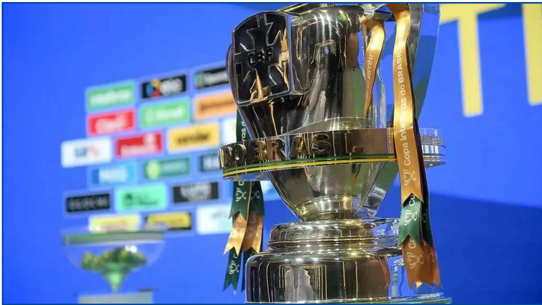
Taça da Copa do Brasil

Em 2006, foi registrado o menor número de times da Série A nas oitavas de final da Copa do Brasil. Foram apenas seis equipes, contra cinco da Série B, três da Série