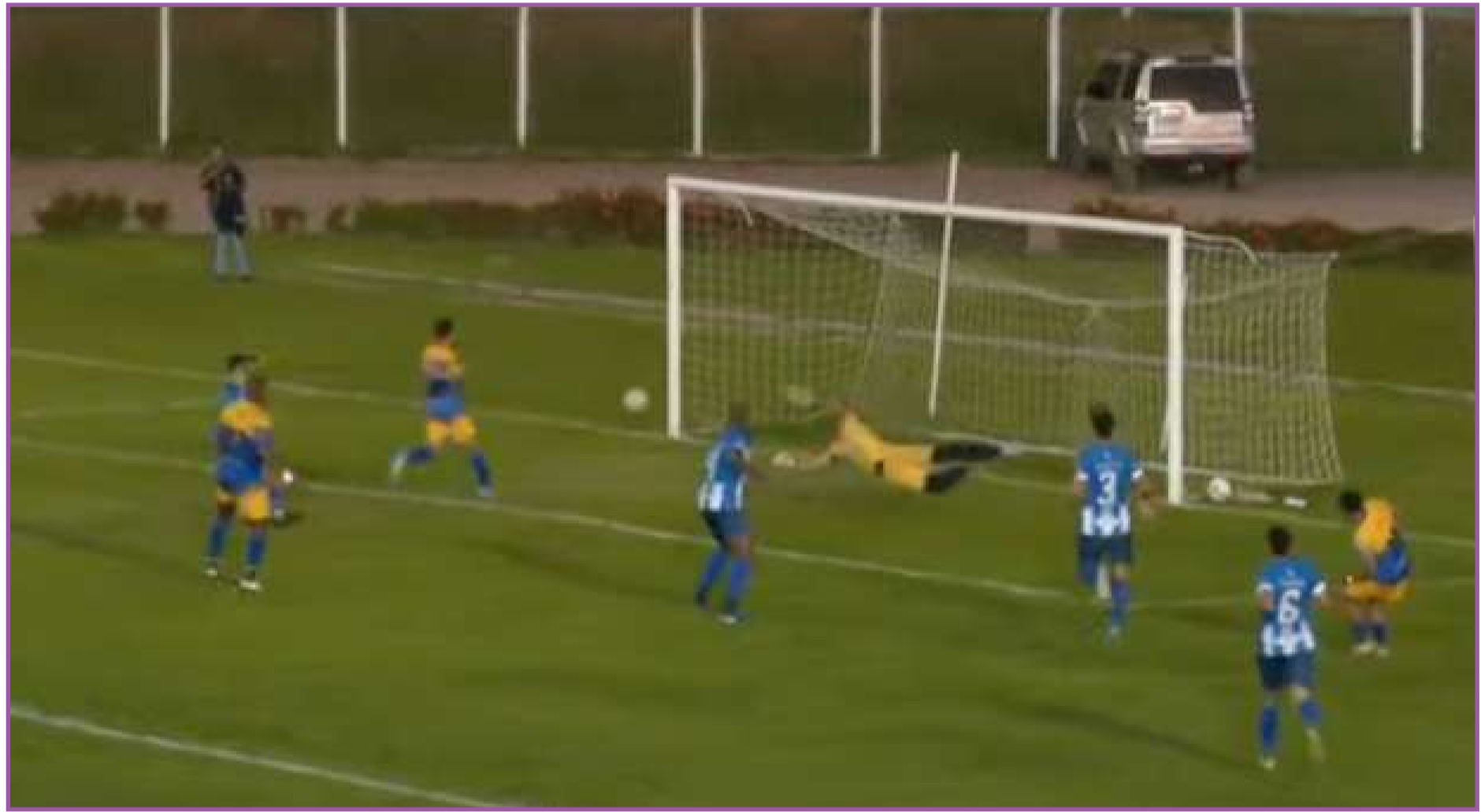
Sinop derrotado em casa para o Araguaia

Com 3 pontos em 3 jogos disputados, com saldo de gols zerado, o Galo do Norte terá apenas mais um jogo para fazer, diante do Paulistano, fora de casa, no próximo fim de semana. Mesmo que vença, só pode chegar a, no máximo, 6 pontos na classificação. Essa é a pontuação que Sorriso e Ara-