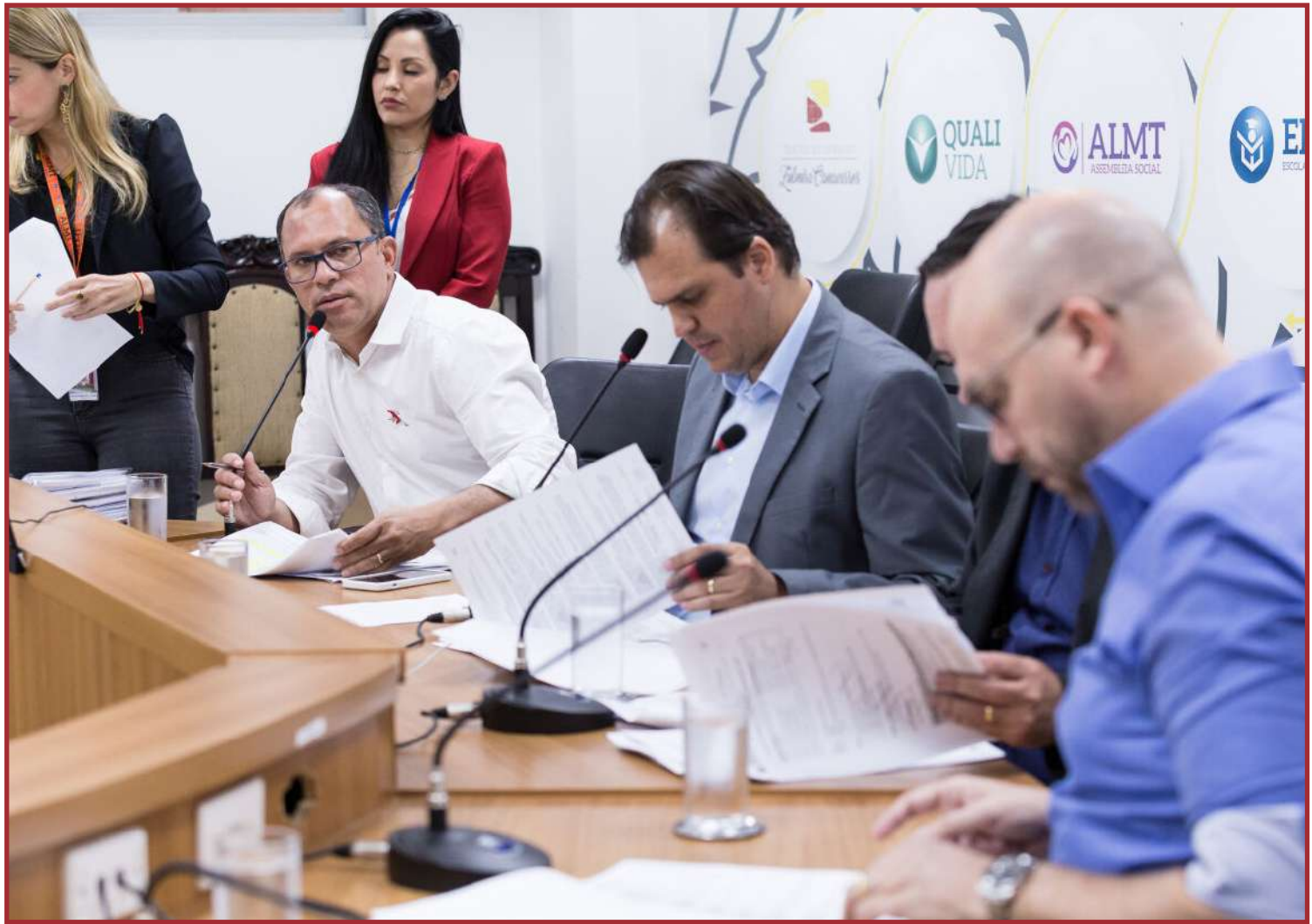
Reunião realizada na última terça

No que se refere à valorização da cultura matogrossense, recebeu parecer favorável o PL nº 265/2023, que institui a Política Estadual de Preservação do Patrimônio Cultural dos povos e comunidades indígenas, e o PL nº 365/2023, que altera a lei nº