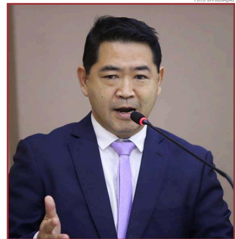
Vereador cobra longarinas para usuários da UBS Boa Esperança