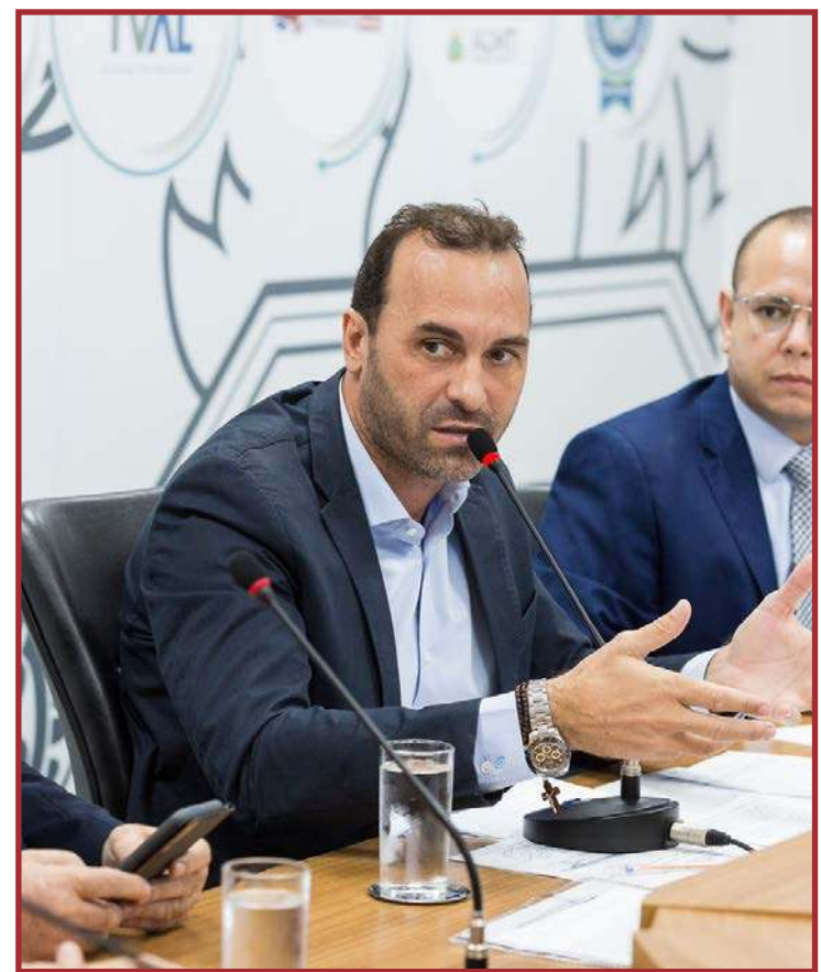
Relatório final da CST que propõe ao STF argumentos e dados para retomada do projeto

zação do projeto tem gerado incertezas e atrasos significativos. O relatório da CST destaca a importância de uma análise aprofundada das questões levantadas na ADI 6553, mas também